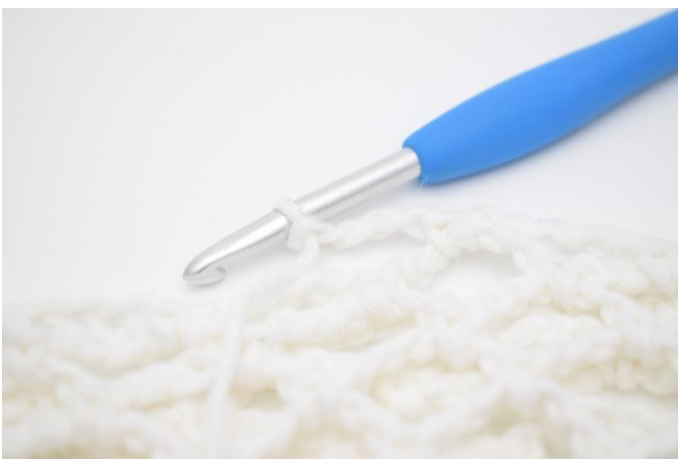
17. Det virkas ytterligare ett varv med färg nr 4. Detta varv virkas som innan men med 4 lm i stället för 5 lm.