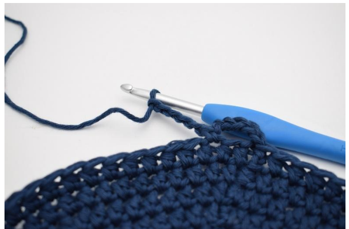
4. Lägg upp 5 lm.