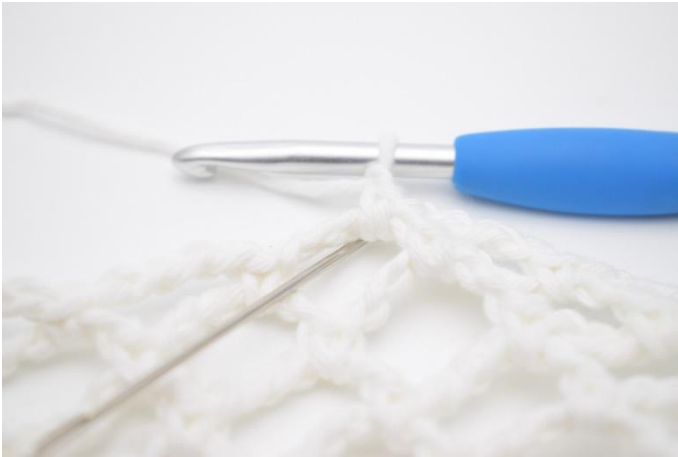
1. Lägg upp 1 lm, og virka 4 fm i lm-bågen.