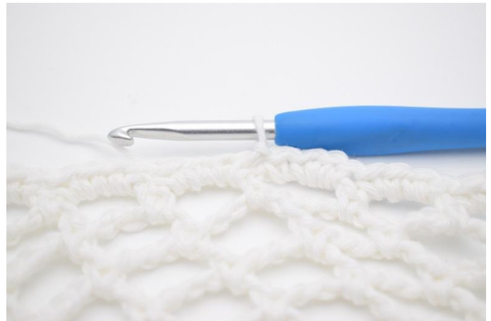
3. Avsluta med 1 sm.