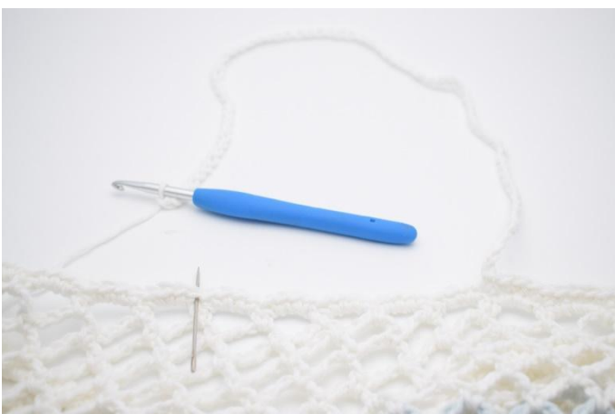
4. Nu virkas varvet med handtaget. Gör 1 lm, virka 1 fm i de följande 52 m. Lägg upp 75 lm. Hoppa över 20 masker,