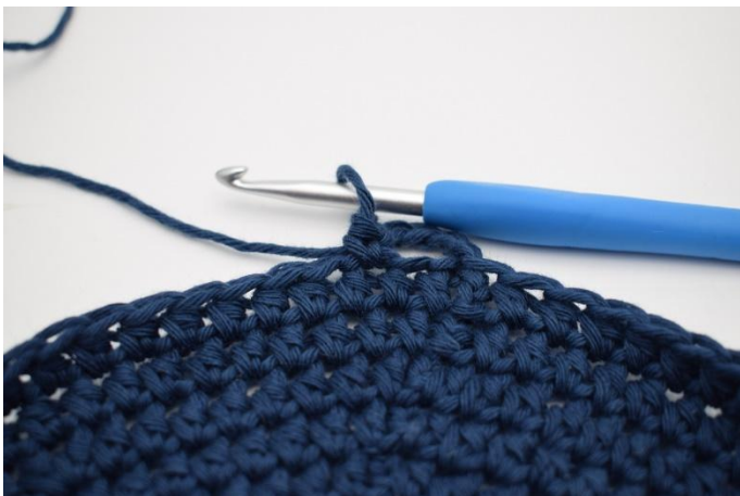
3. Hoppa över 1 m, virka 1 fm i nästa m.