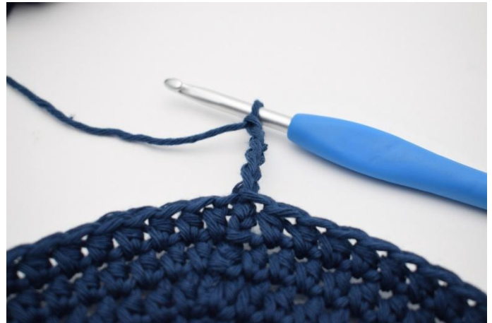
2. Lägg upp 5 lm.