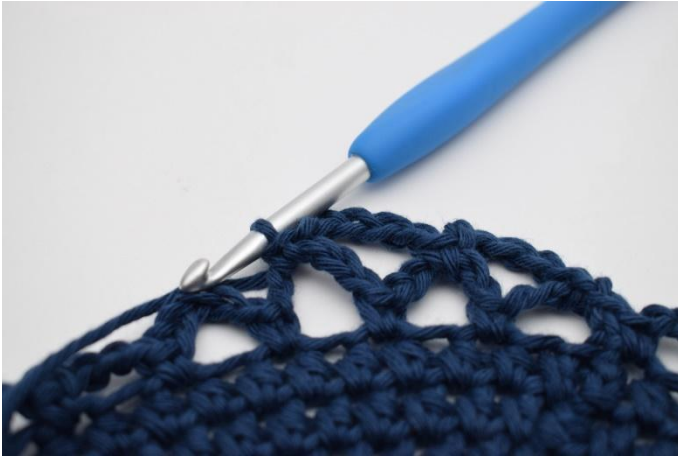
13. Virkas 1 fm.