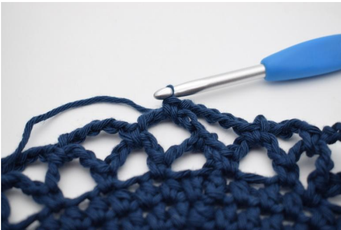
15. Nu börjar du på nästa varv. Varven upprepas med färgskiftningar som beskrivits längre upp i mönstret