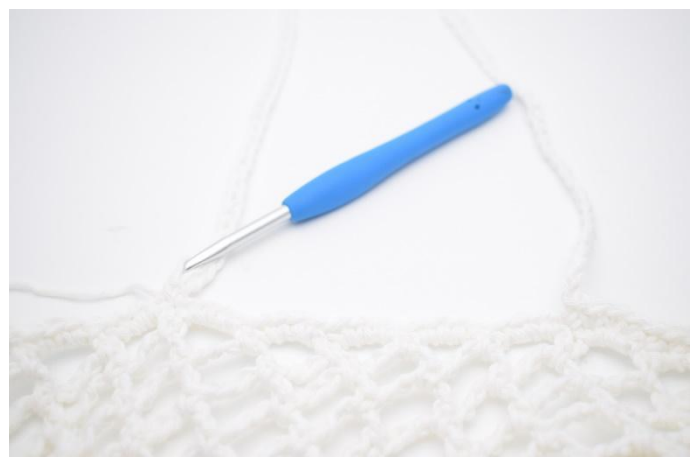
5. Virka 1 fm i nästa maska.