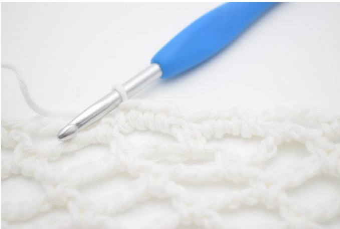
2. Virka 4 fm i lm-bågen. Detta upprepas hela vägen runt.