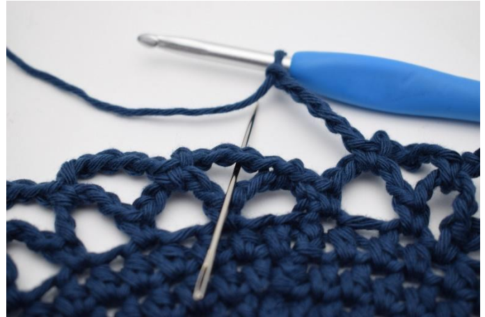
14. Upprepa varvet runt. Avsluta med 1 fm i den första lm-bågen som gjordes på första varvet.