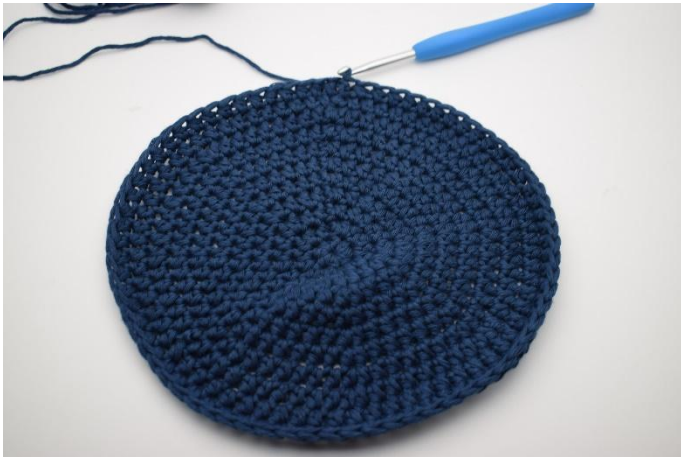
1. Här har botten precis avslutats med med 1 sm.