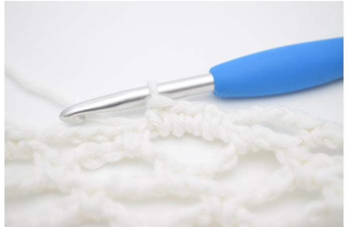
2. Så här.