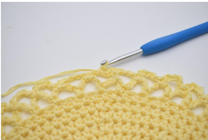
15. Nu börjar du på nästa varv. Varven upprepas med färgskiftningar som beskrivits längre upp i mönstret.