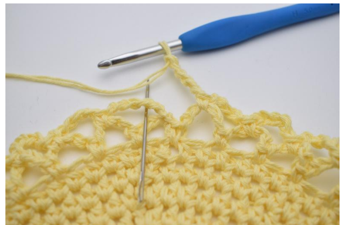
14. Upprepa varvet runt. Avsluta med 1 fm i den första lm-bågen som gjordes på första varvet.