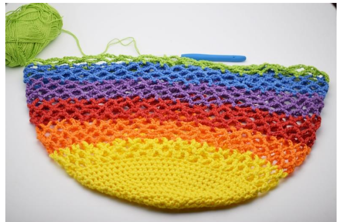
16. Här har alla 21 varv virkats.