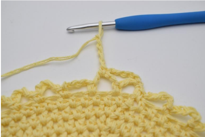
11. Lägg upp 5 lm.