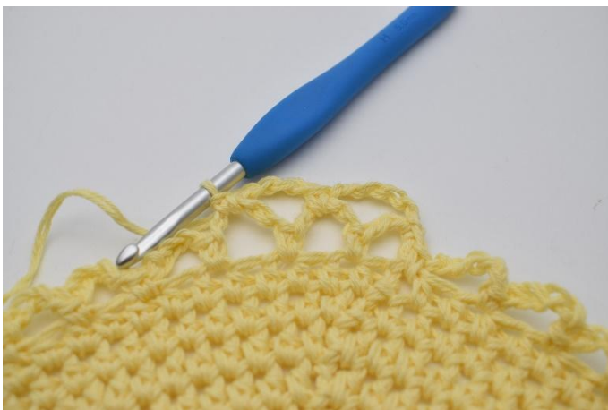
13. virkas 1 fm.