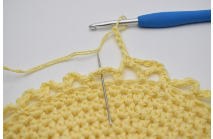
12. I nästa lm-båge. (Nålen markerar den här)