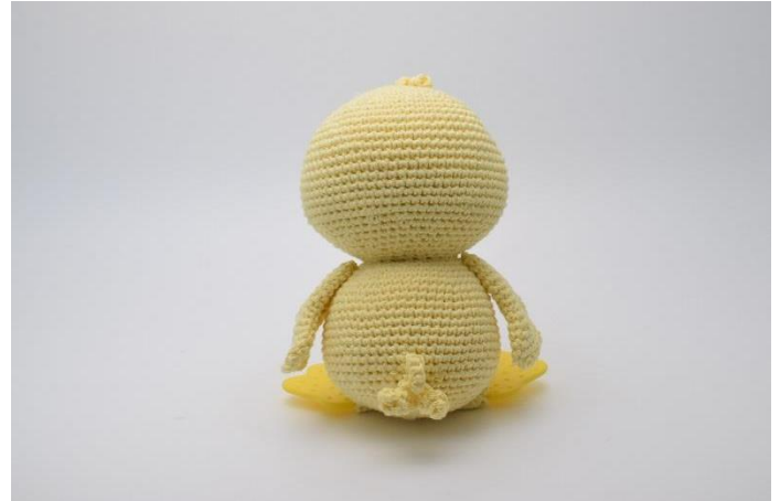
2. Samt bak på.

OBS: När man gör handarbeten och hemmagjorda saker, speciellt till bebisar, är det viktigt att man är noggrann med monteringen, speciellt med knutar och öglor.