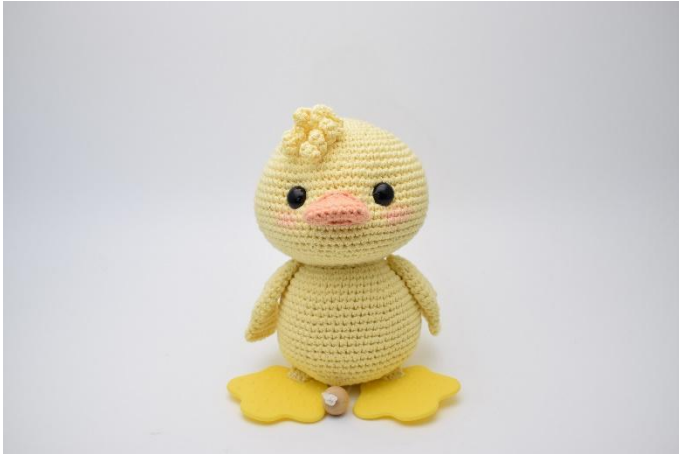
1. Sy fast lockarna överst på huvudet.