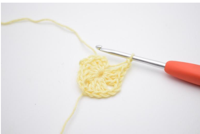
5. Upprepa "3 st och lägg upp 2 lm" 2 gånger till, och dra åt din mr lite lätt.