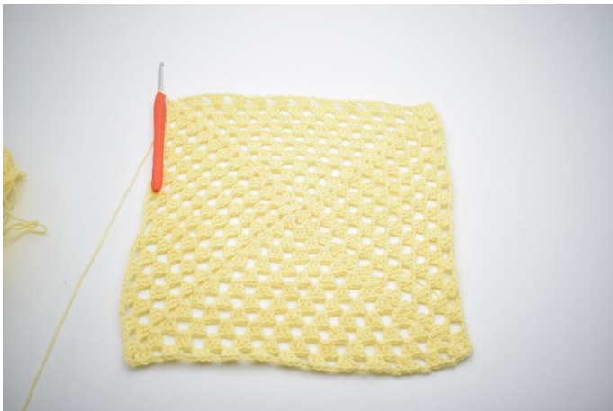
1. Upprepa varv 3 i allt 10 gånger eller tills du har den önskade storleken.