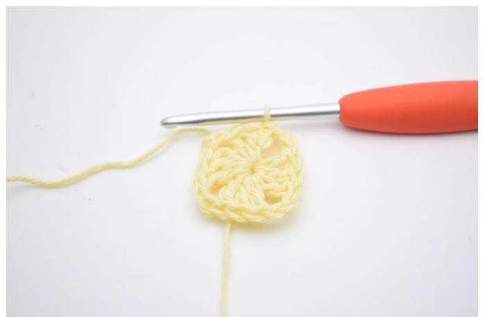
6. Lägg upp 2 lm. Avsluta varvet med 1 sm i 3:e lm från varvets början.