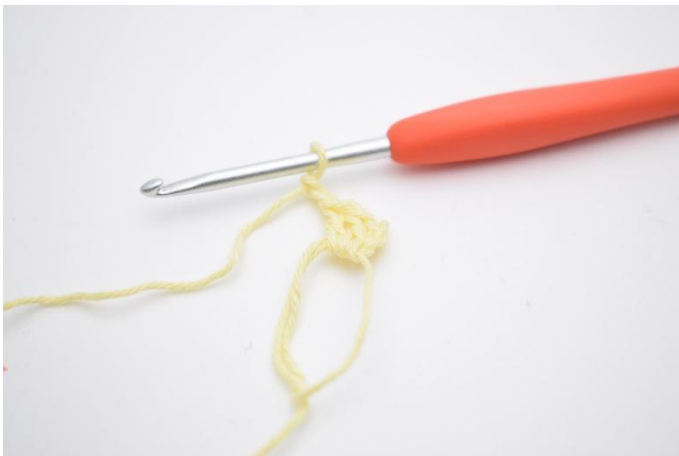
3. Lägg upp 2 lm.