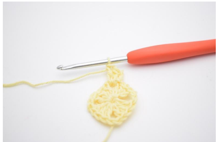
2. Virka 2 st ner i 1m-mellanrummet.