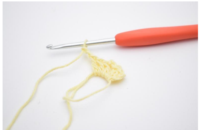
4. Virka "3 st och lägg upp 2 lm".