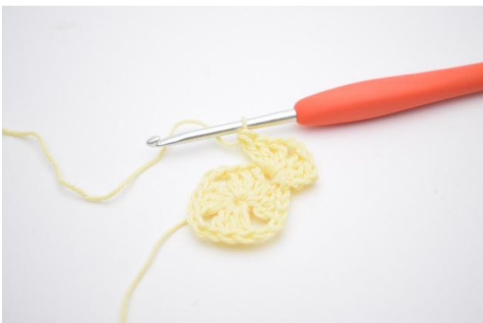
3. Gör 2 lm, virka 3 st ner i samma 1m-mellanrum.