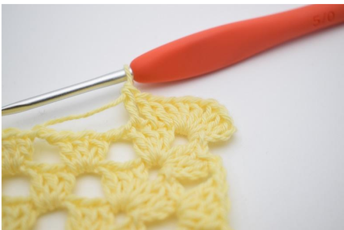
3. "Virka 1 st i de nästa 3 m.