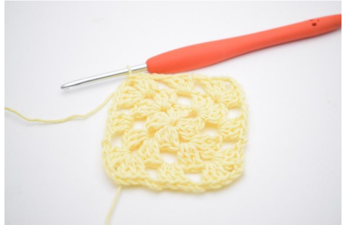
12. Så här.