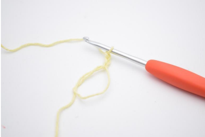
1. Gör en mr, och lägg upp 3 lm (ersätter 1:a st).