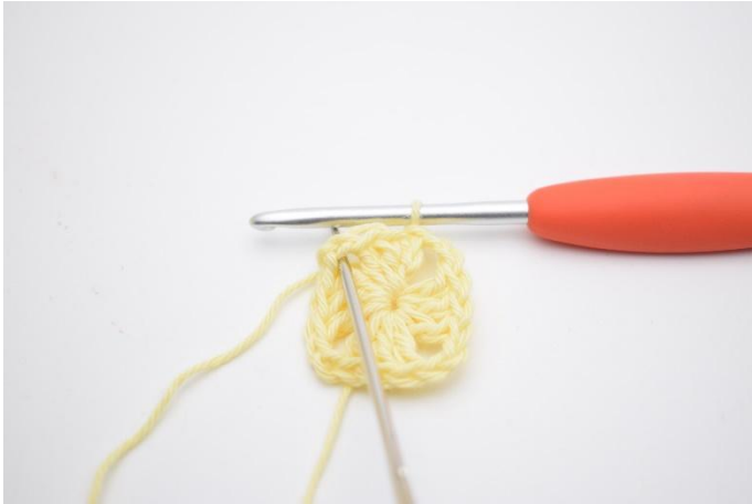
7. Gör nu smygmaskor fram till första "hörnet" (1m-mellanrum)