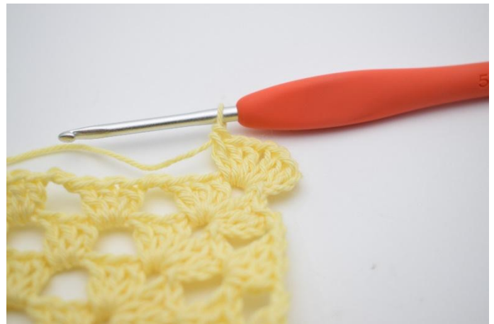
2. Lägg upp 3 lm och virka 2 st, 1 lm, 3 st i "hörnet" (1m-mellanrum)