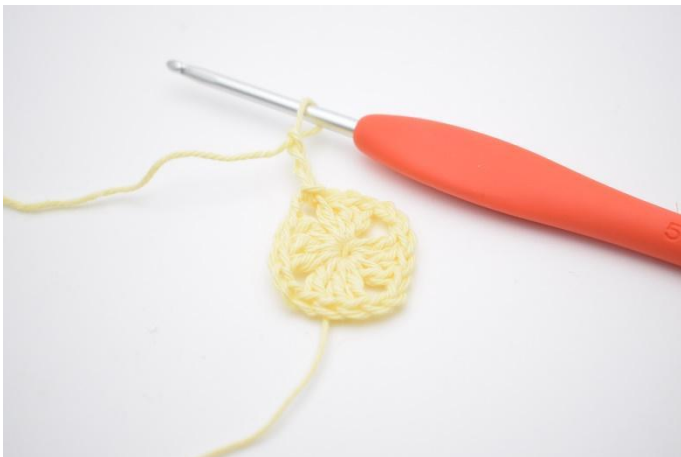
1. Lägg upp 3 lm (ersätter 1:a st).