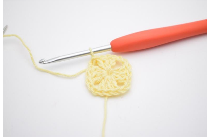
8. Så här.