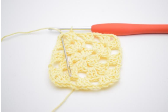
11. Gör sm fram till "hörnet".