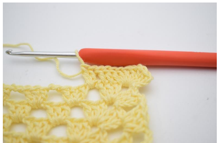
4. Virka 2 st i lm-mellanrummet".