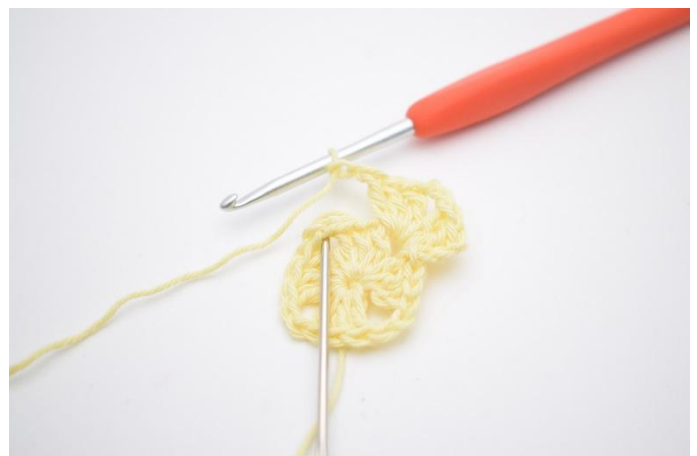
4. Gör 2 lm. Nu virkas det i nästa "horn" (1m-mellanrum).