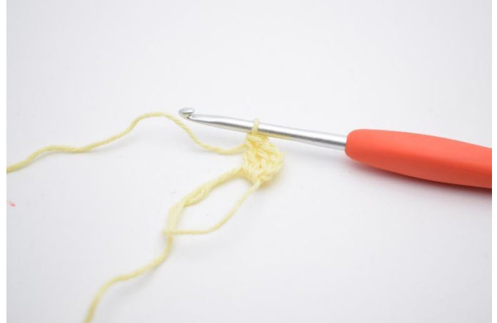
2. Virka 2 st i ringen.