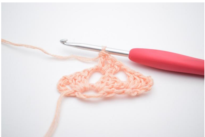
11. Virka 1 st grupp.