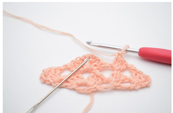
23. Nu virkas det igen i spetsen, och ner i lm bågen.