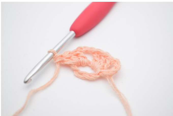
5. Virka 3 st ner i ringen.