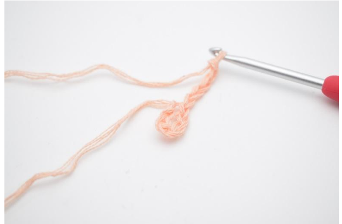
2. Lägg upp 5 lm.