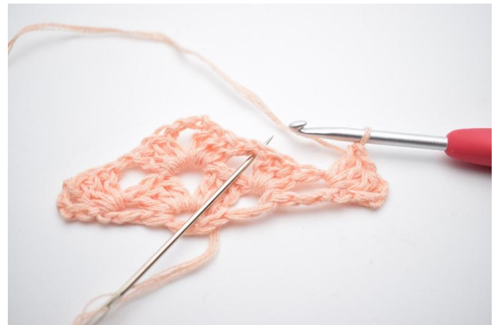
21. Gör 1 lm. Nästa st grupp virkas i nästa mellanrum.