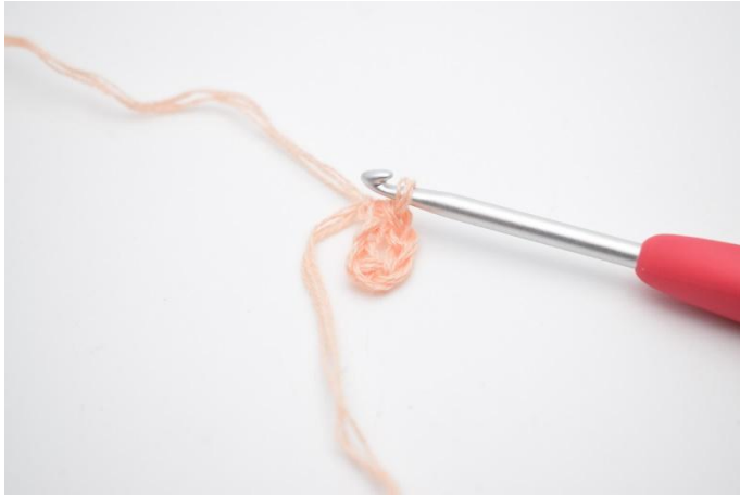
1. Lägg upp 6 lm, samla ihop dem till en ring med 1 sm.