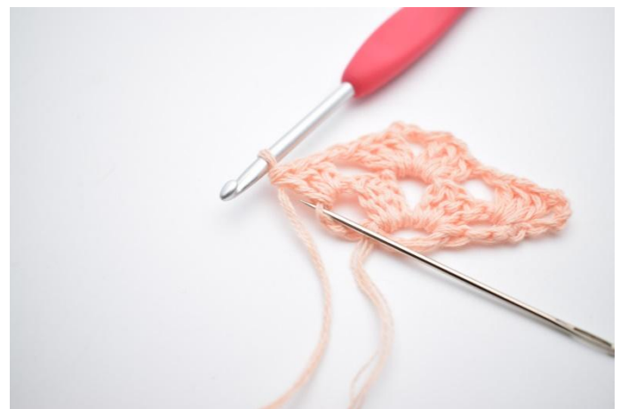
16. Gör 1 lm, nu virkas det i 4. lm från förra varvet.