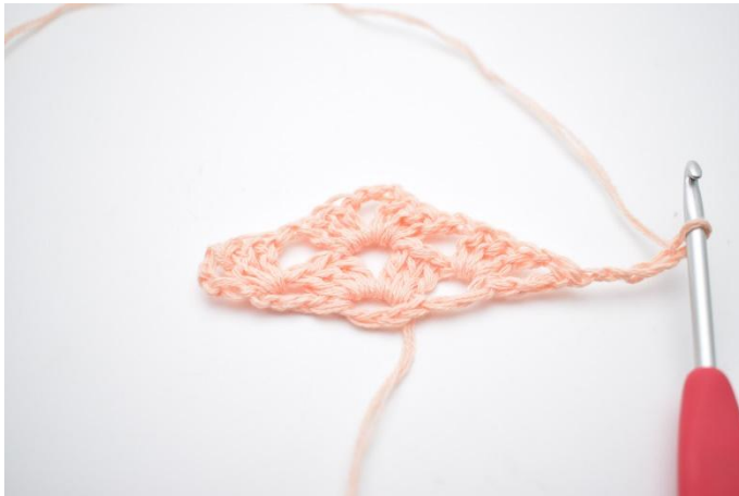
18. Vänd arbetet och lägg upp 5 lm.