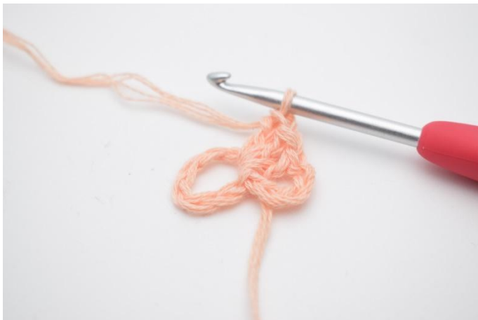
3. Virka 3 st ner i ringen.