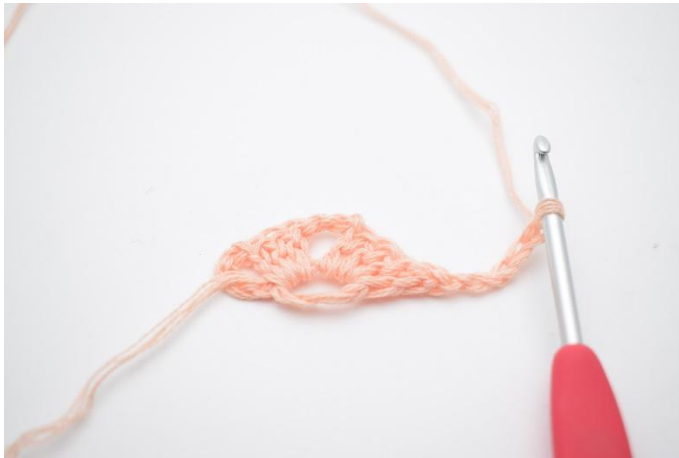
7. Vänd arbetet och lägg upp 5 lm...