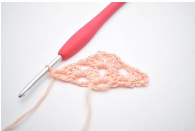
17. Det virkas 1 dbst.