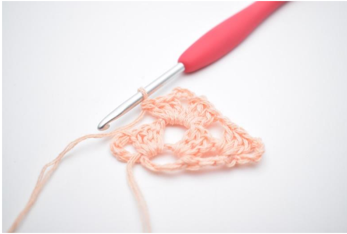
13. Virka 1 st grupp.