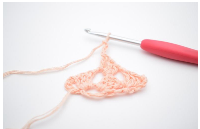
12. Lägg upp 3 lm. Det virkas åter ner i lm-bågen