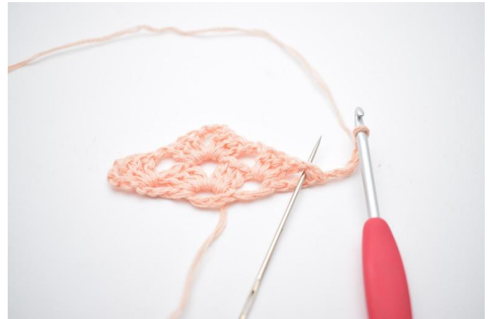
19. Det virkas nu i mellanrummet som nålen markerar på bilden.