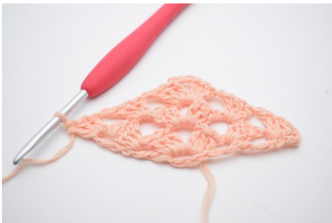
28. Virka 1 st grupp.