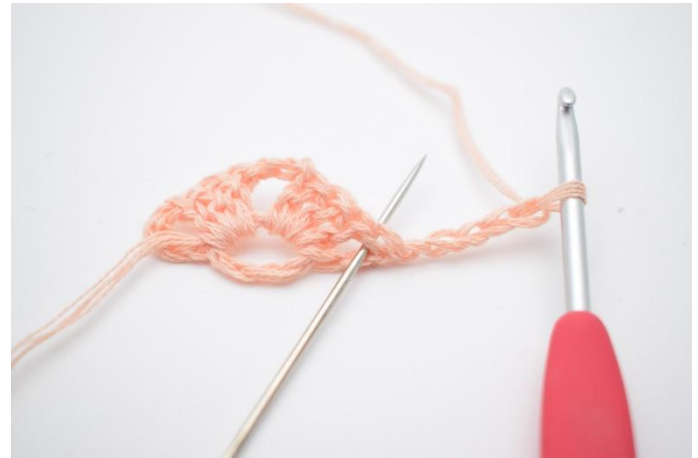
8. ..i mellanrummet som nålen på bilden markerar