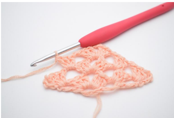
26. Virka 1 st grupp.