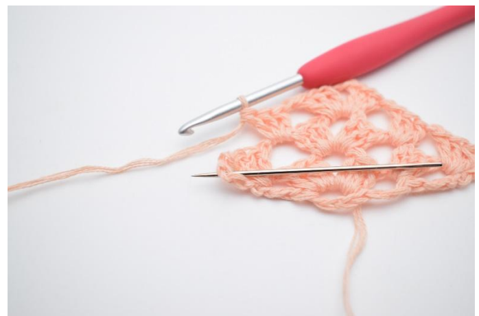
27. Gör 1 lm, nästa st grupp virkas i nästa mellanrum som nålen på bilden visar.