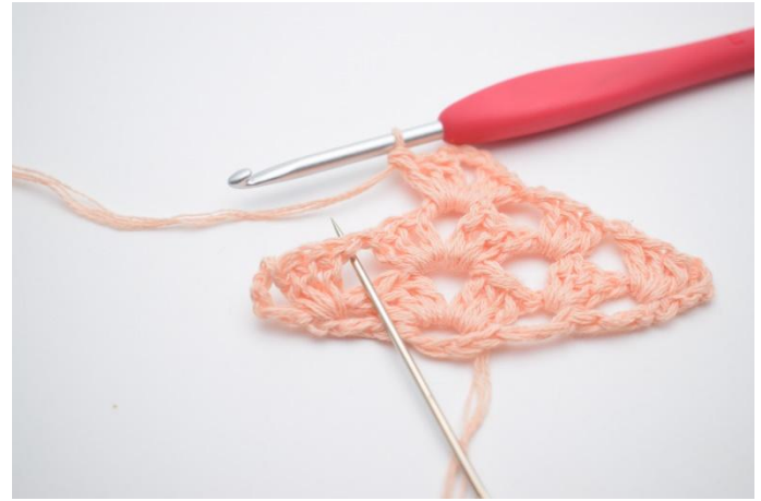
25. Gör 1 lm. Nästa st grupp virkas i nästa mellanrum som nålen på bilden visar.