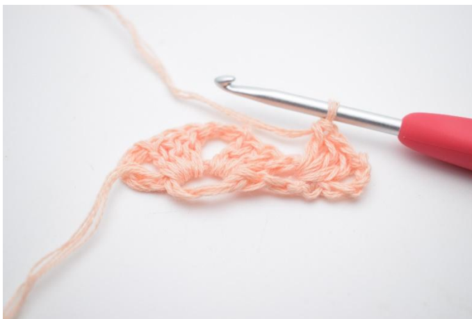
9. Virkas 1 st grupp.