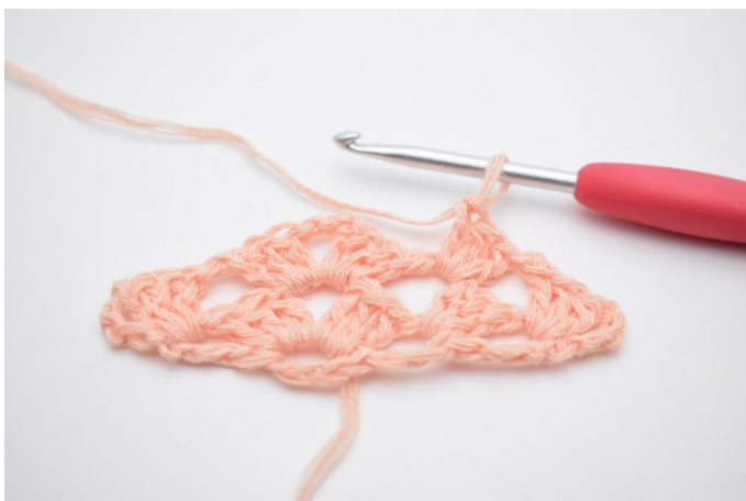
22. Virka 1 st grupp och gör 1 lm.