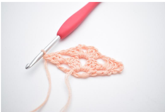
15. Virka 1 st grupp.