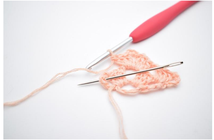
14. Gör 1 lm. Nästa st grupp virkas i mellanrummet som nålen på bilden visar.