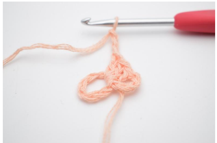
4. Lägg upp 3 lm.