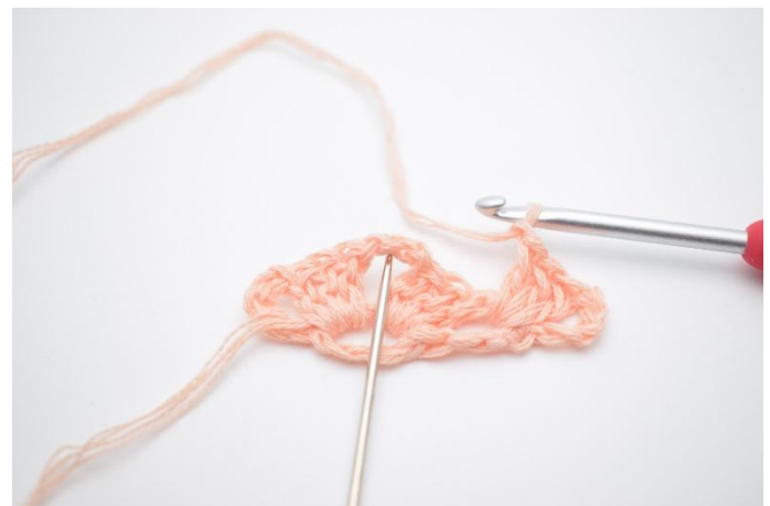
10. Gör 1 lm. Nu virkas det i lm bågen från förra varvet (detta är spetsen på sjalen).