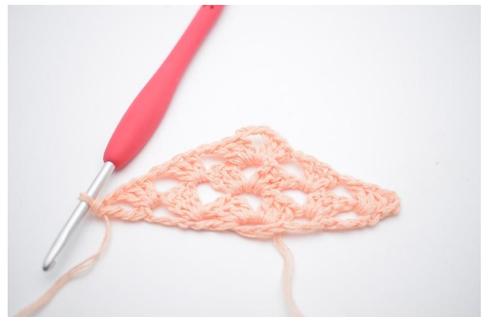
29. Gör 1 lm, virka 1 dbst i 4. lm från förra varvet.