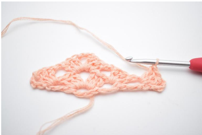
20. Virka 1 st grupp.