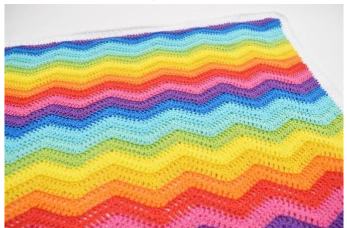
16. Upprepa nu dessa mönster varv som beskrivits i mönstret.