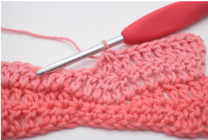
11. Virka 3 st tillsammans.