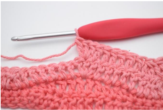
13. Virka 3 st i samma m.