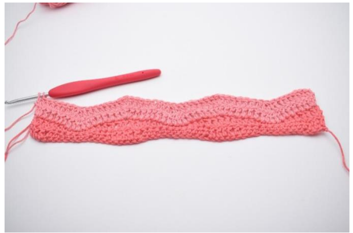
14. Upprepa och virka "1 st i de nästa 6 m, 3 st tillsammans, 1 st i de följande 6 m, och 3 st i nästa m" varvet ut,