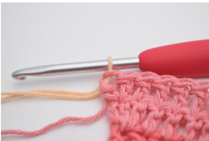
15. men avsluta med endast 2 st i sista m. Byt till färg nr 3 i sista drag i sista st. Vänd med 2 lm. Vägledning - Avslutnings varv: