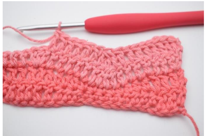
12. Virka 1 st i de nästa 6 m.