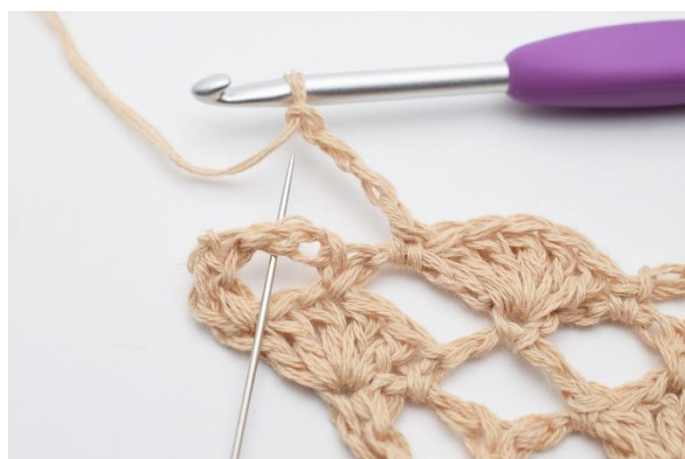
12. Lägg upp 4 lm, virka 1 fm i nästa lm-båge.