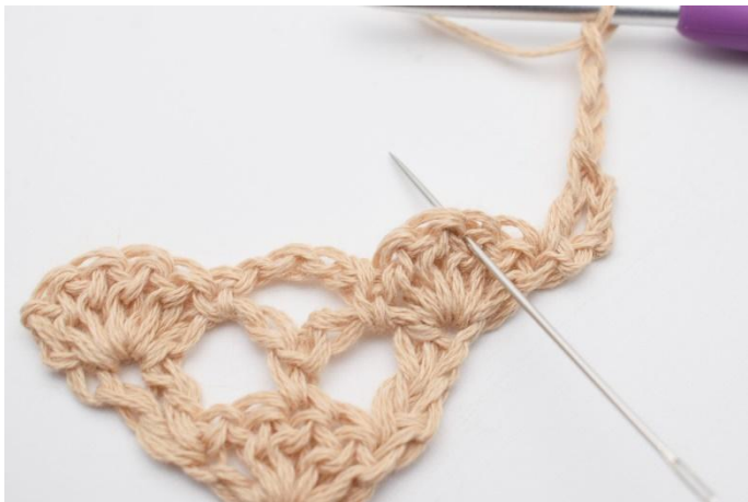
3. Lägg upp 3 lm. I den mittersta st i st-bågen under,