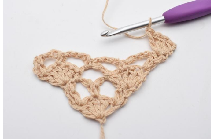
2. virkas 4 st. Det är nu gjort 1 st-båge med 5 st, där den första st är ersatt av en lm.