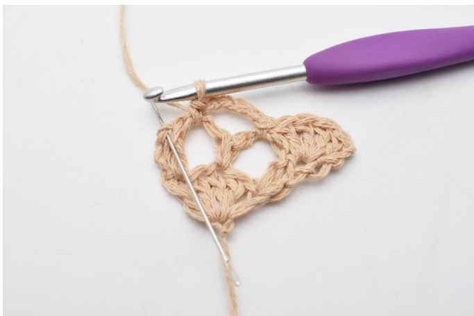
9. I den sista av de 2 st under,