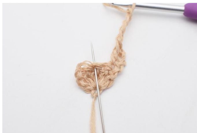
4. Lägg upp 3 lm, virka 1 fm i den mittersta st i bågen under.