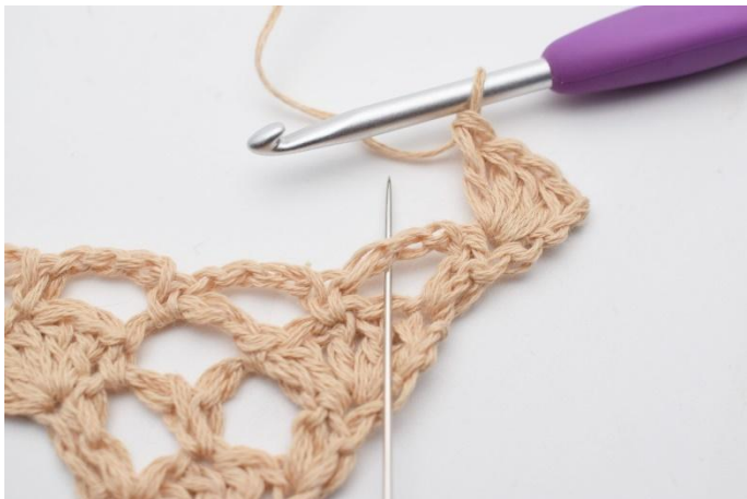
3. I lm-bågen under virkas 1 fm.