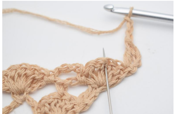
4. Lägg upp 3 lm och virka 1 fm i den mittersta st i st-bågen under, (nålen markerar här den mittersta maskan)