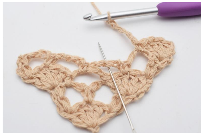
6. I nästa lm-båge,