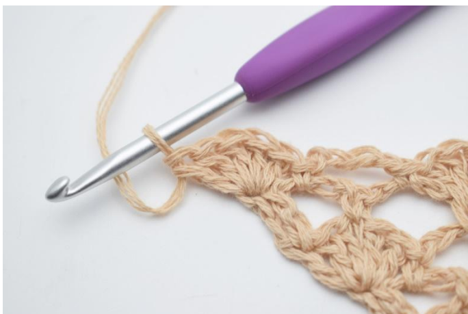
21. virkas 1 st-båge (5 st)