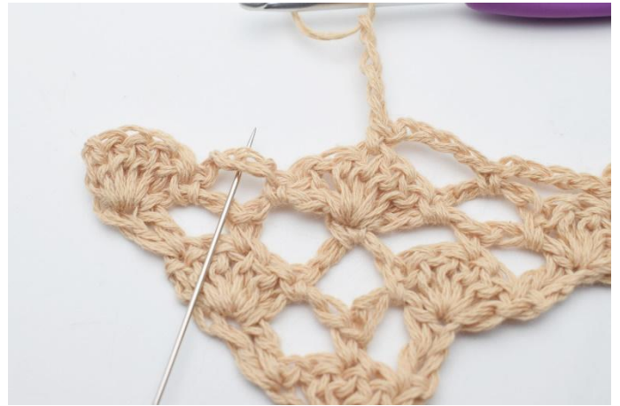
10. Lägg upp 4 lm, virka 1 fm i lm-bågen under.