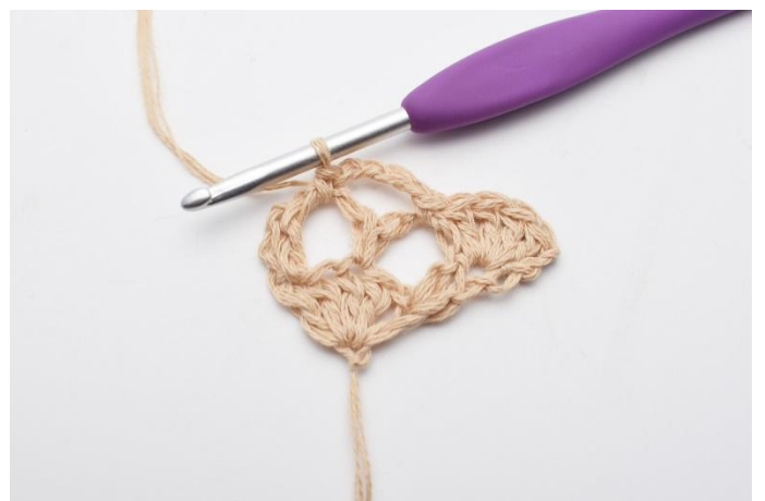
8. virkas 1 fm.