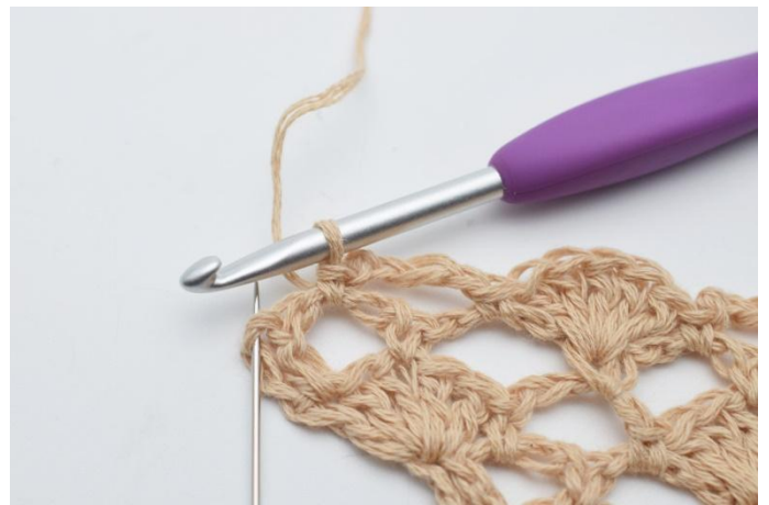
20. I sista maskan, (den som nålen markerar på bilden)