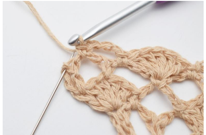
14. I sista maskan, (den som nålen markerar här)