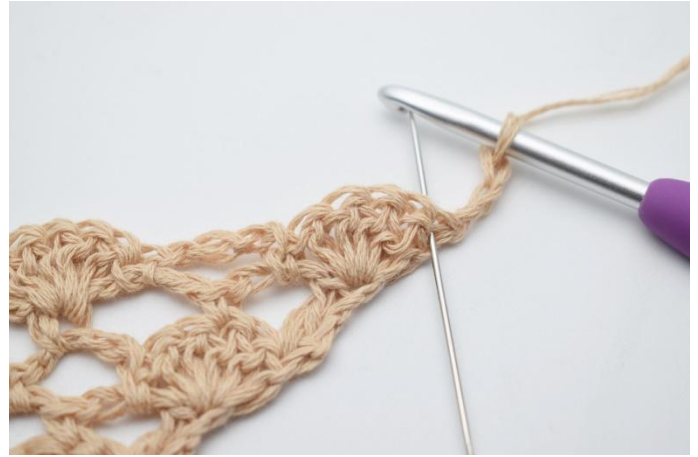
2. I första maskan, (den som nålen markerar här)