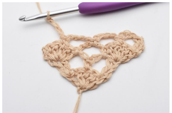
10. Lägg upp 3 lm.