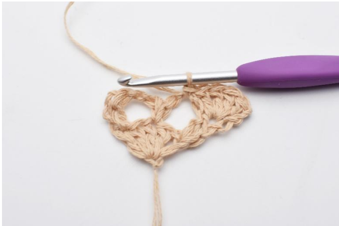
5. virkas nu 1 fm.