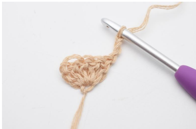
1. Vänd arbetet med 3 lm.