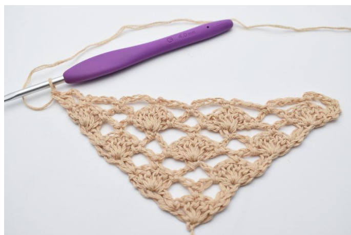
12. virkas 2 st.