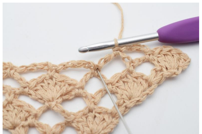
8. Nu virkas det 1 st-båge (5 st) i fm mellan de 2 nästa lm-bågarna. (Nålen markerar här den fm din st-båge ska virkas i)