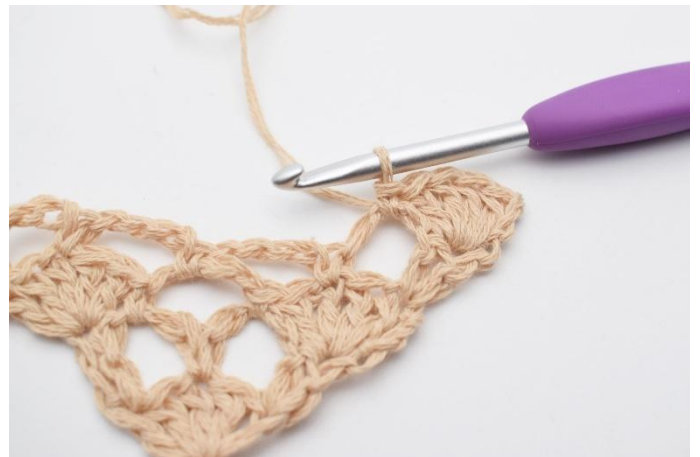
4. Så här.