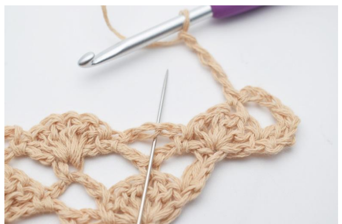
6. Lägg upp 4 lm. I den nästa lm-bågen virkas