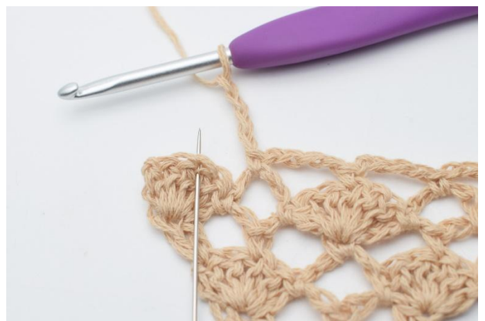
12. Lägg upp 4 lm, virka 1 fm i den mittersta st i nästa st-båge under. (nålen markerar här den mittersta maskan)