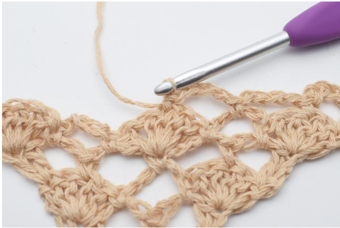
9. Så här.