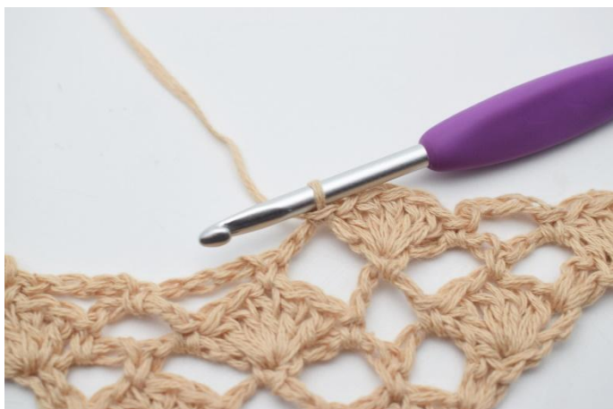
11. 1 fm.