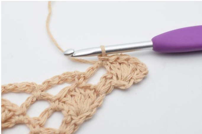
5. virkas 1 fm.