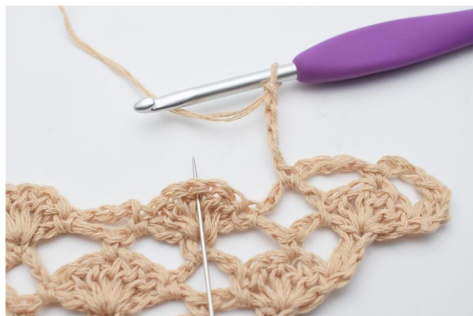
8. Lägg upp 4 lm, i den mittersta st i st-bågen under virkas