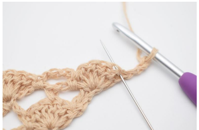
2. I första maskan, (den som nålen markerar på bilden)