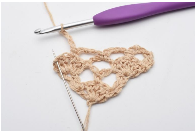
11. I den sista maskan virkas 2 st.