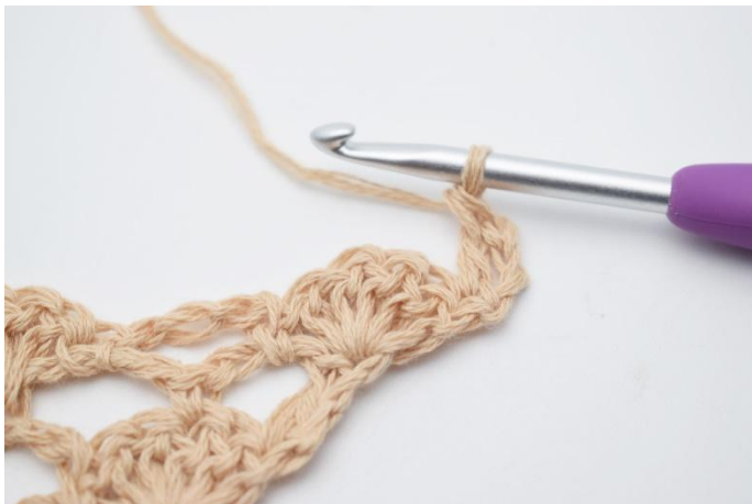
3. Virkas 1 st.