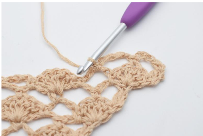
7. 1 fm.