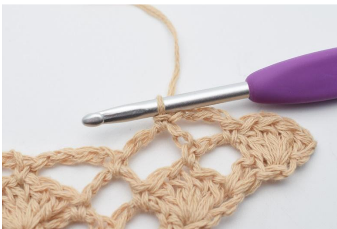
7. 1 fm.