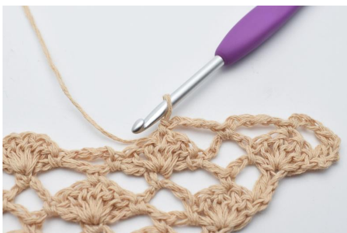
9. 1 fm.