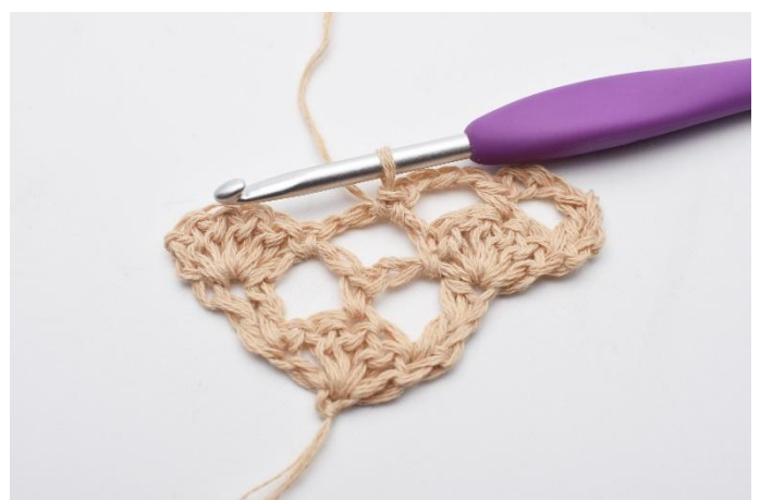
6. Så här.