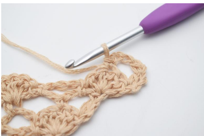
5. 1 fm.