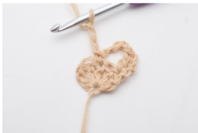
6. Lägg upp 3 lm,