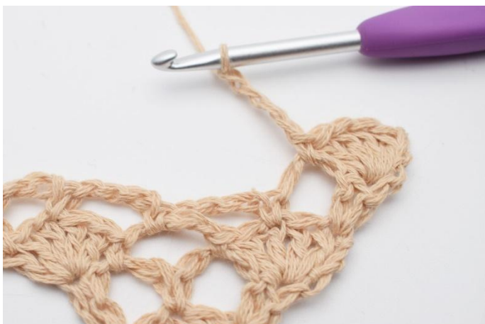
5. Lägg upp 4 lm.