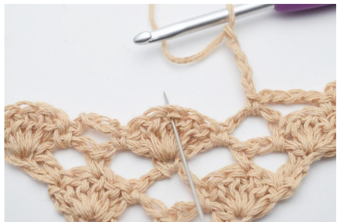
8. Lägg upp 4 lm, virka 1 fm i den mittersta st i nästa st-båge under, (nålen markerar här den mittersta maskan)