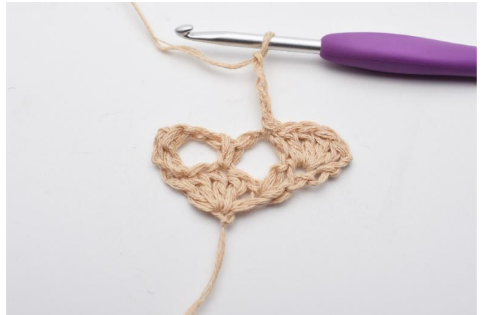
6. Lägg upp 4 lm.