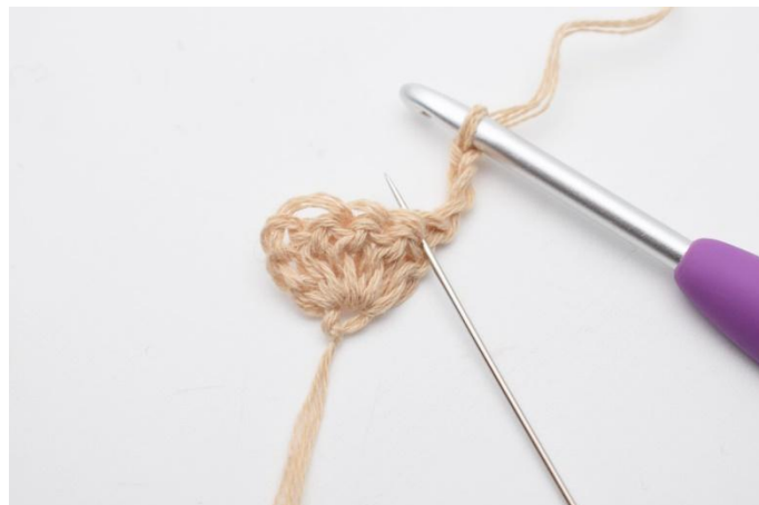
2. I första maskan, (den nålen markerer på bilden)