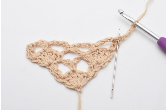
1. Vänd arbetet med 3 lm. I den första maskan, (den som nålen markerar här)