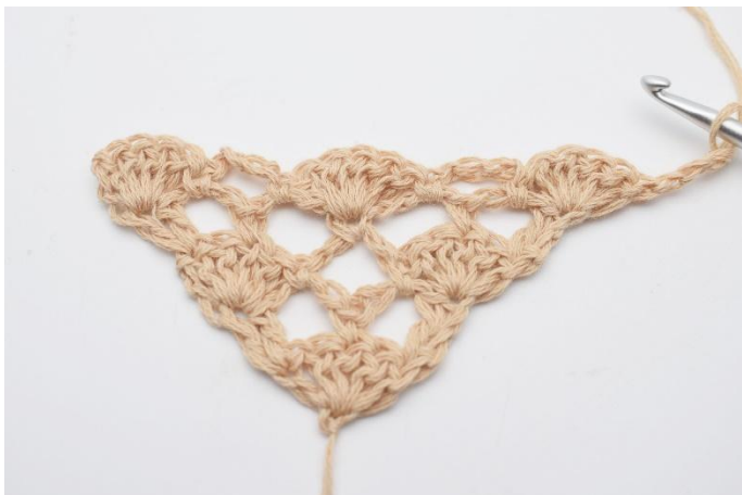
1. Vänd arbetet med 3 lm.