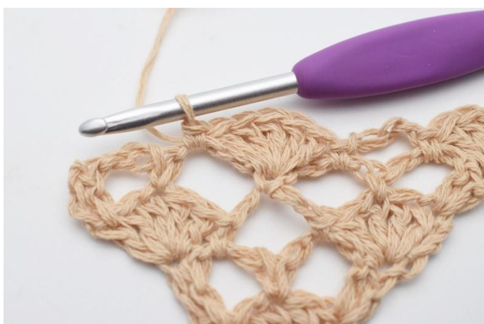
11. 1 fm.