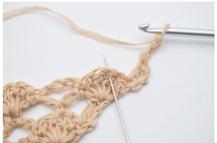
4. Lägg upp 3 lm. I den mittersta st i st-bågen under virkas