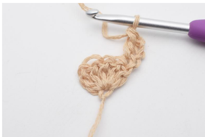
3. virkas 1 st.