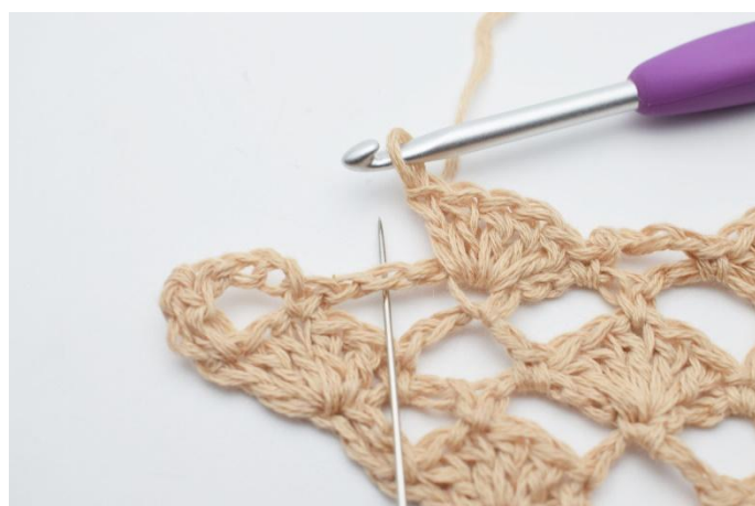
16. I nästa lm-båge virkas