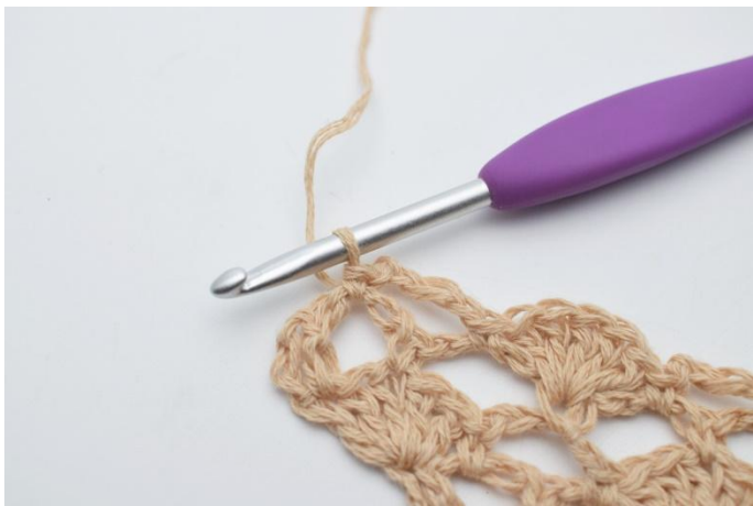
19. 1 fm.