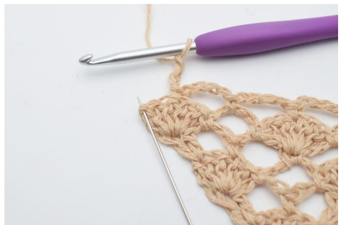
14. Lägg upp 3 lm, i den sista maskan, (den som nålen markerar här)