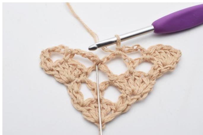
8. Virka 5 st (=1 st-båge) i fm mellan de nästa 2 lm-bågarna. (Nålen markerar här den fm din st-båge ska virkas i)