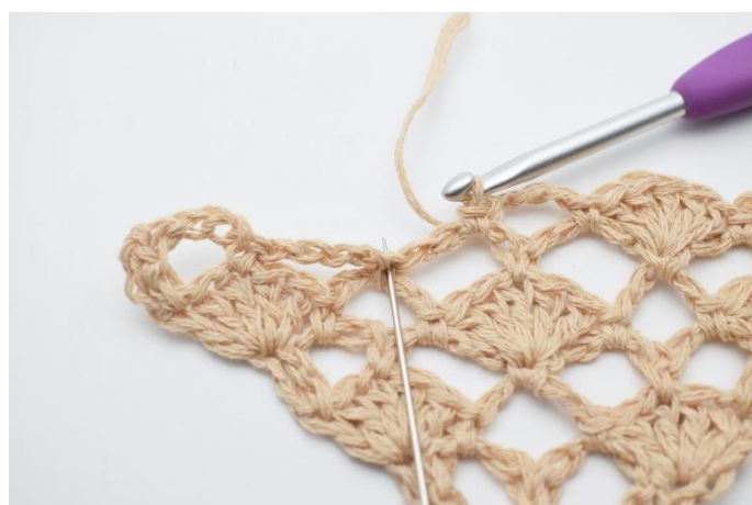
14. Nu virkas det 1 st-båge (5 st) i fm mellan de 2 nästa lm-bågarna. (Nålen markerar här den fm din st-båge ska virkas i)