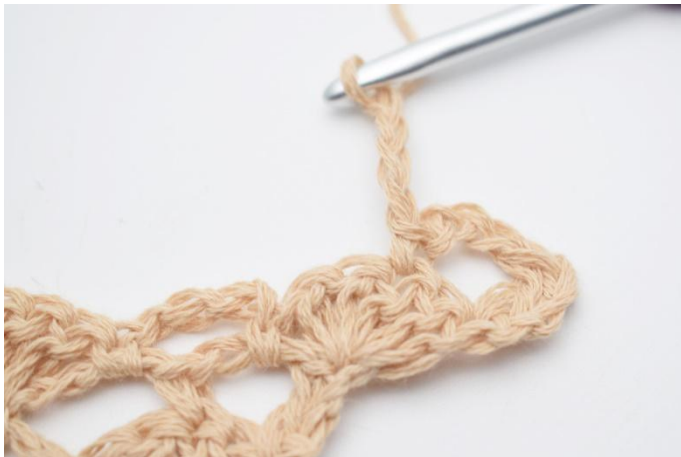
5. Lägg upp 4 lm,