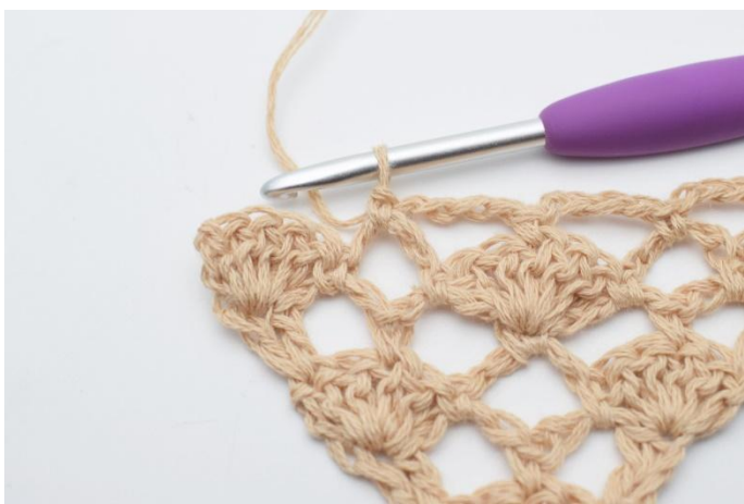
11. Så här.