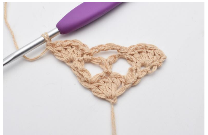
10. virkas en st-båge (5 st).