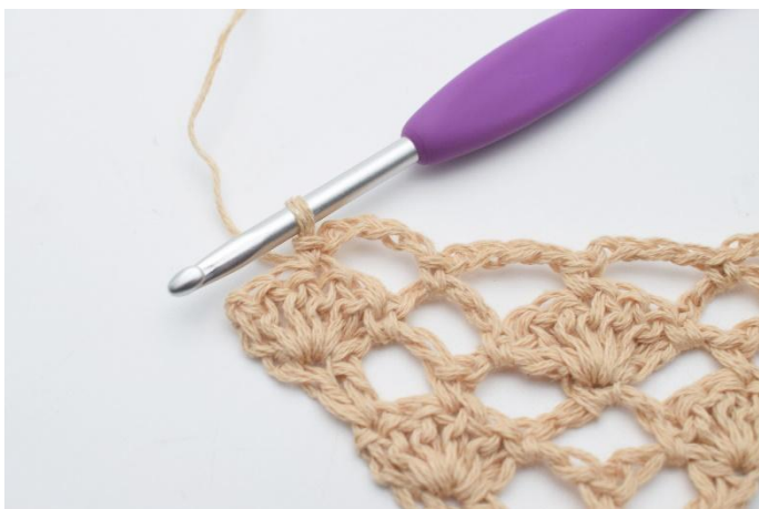
13. Så här.