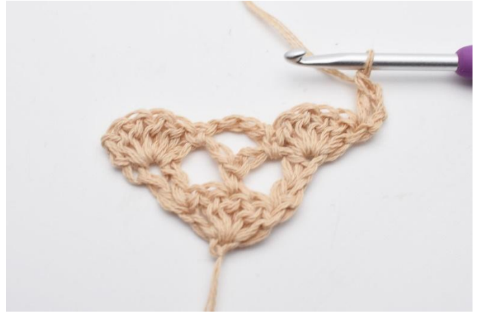
2. virkas 1 st.