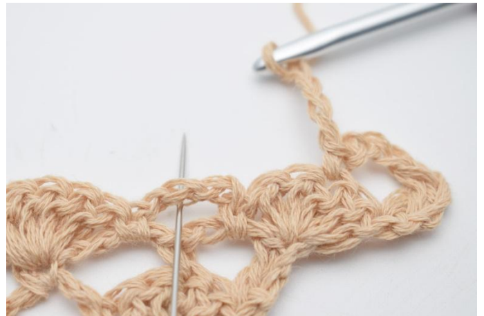
6. virka 1 fm i lm-bågen under.