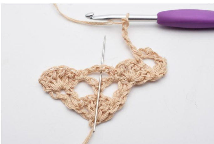
5. Lägg upp 4 lm, virka 1 fm i lm-bågen under.