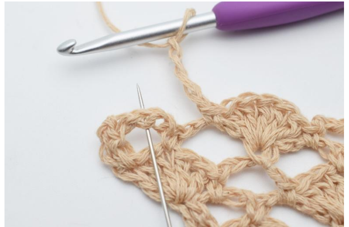
18. Lägg upp 4 lm. I nästa lm-båge virkas