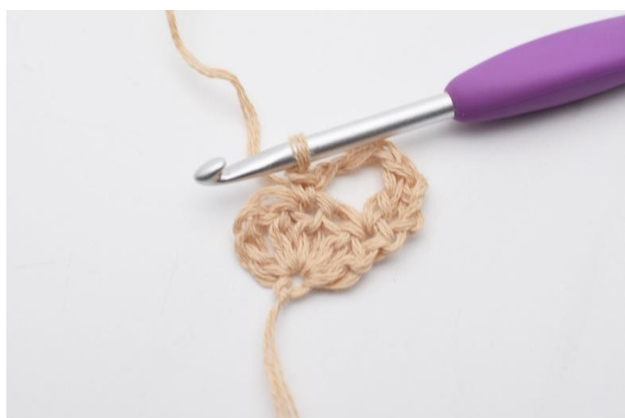
5. Så här.