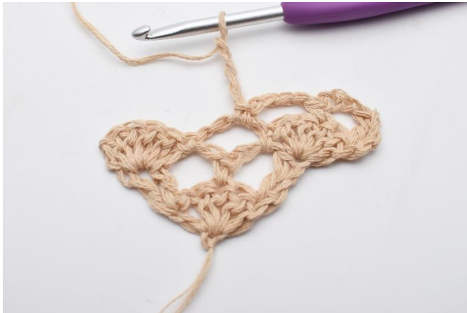
7. Lägg upp 4 lm.