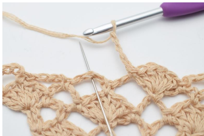
12. Lägg upp 4 lm. I nästa lm-båge virkas