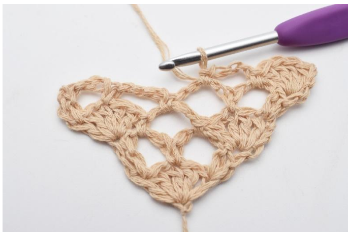
7. virkas 1 fm.