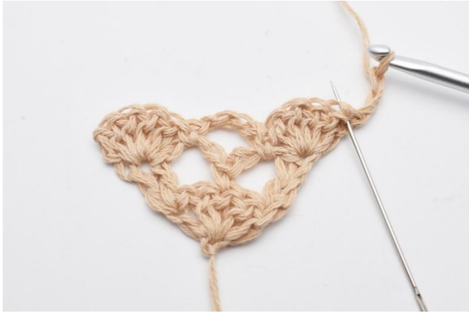
1. Vänd arbetet med 3 lm. I första maskan, (den nålen markerar här)