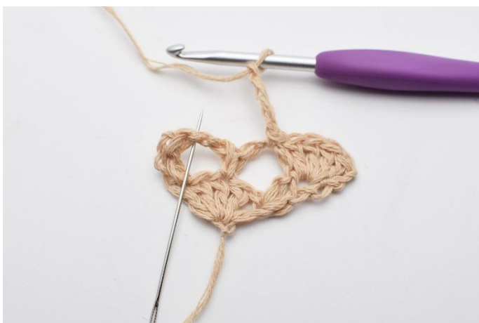
7. I nästa lm-båge,