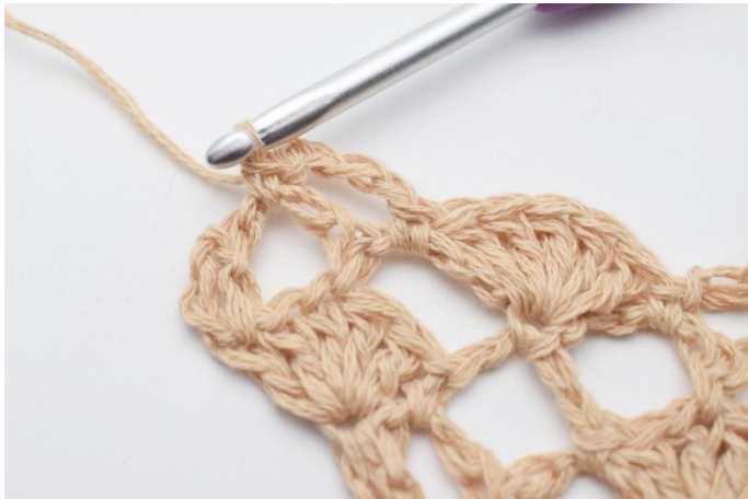
13. Så här.