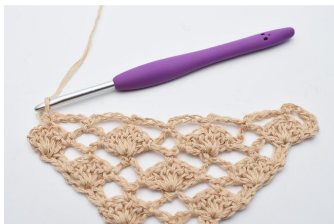
10. Upprepa detta tills sista st-bågen på varvet.