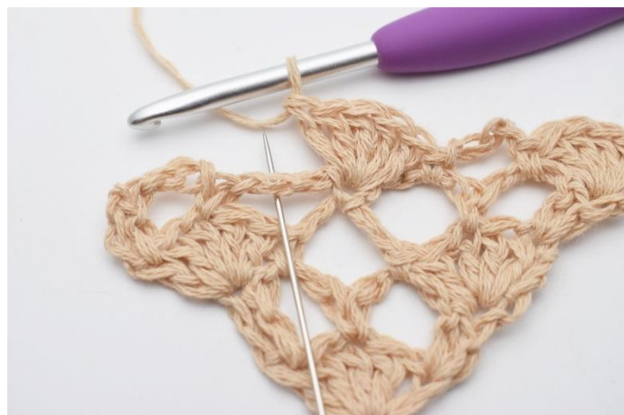
10. I nästa lm-båge virkas