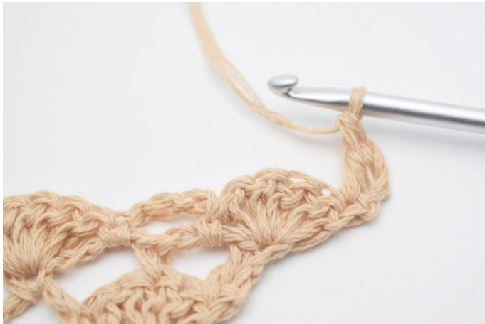
3. virkas 1 st.