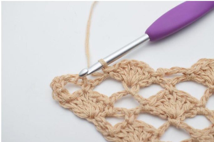
17. 1 fm.