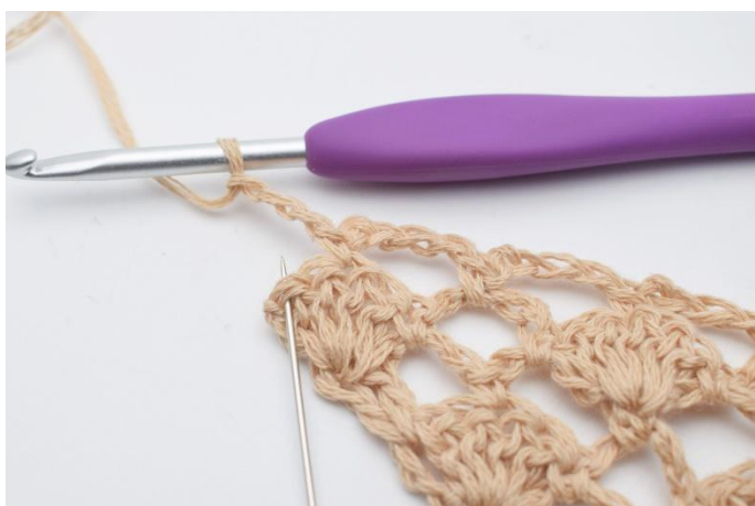
11. Lägg upp 3 lm, och i sista maskan (den som nålen markerar här)