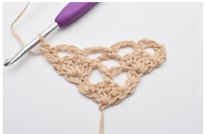
12. Så här.