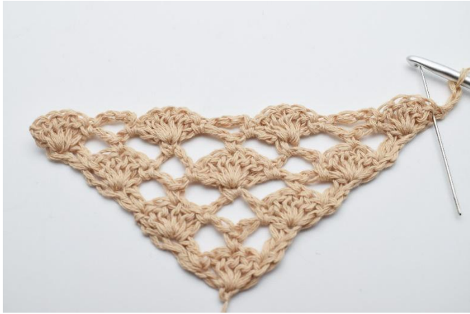
1. Vänd arbetet med 3 lm.