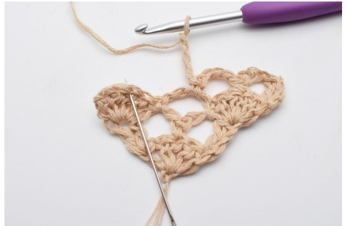
8. I den mittersta av st i st-bågen under,