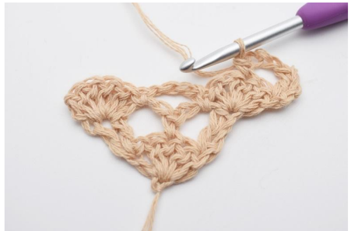
4. virkas 1 fm.