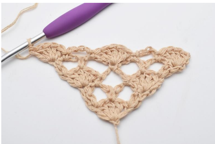
15. Virkas 1 st-båge med 5 st.