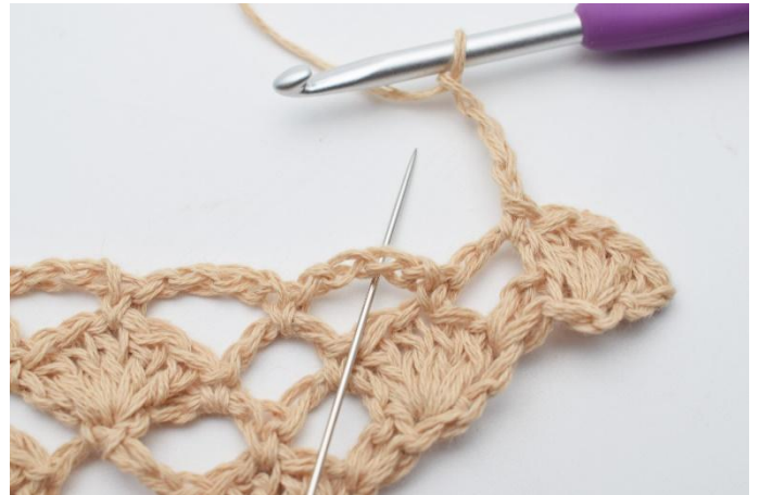
6. Lagg upp 4 lm. I nästa lm-båge virkas