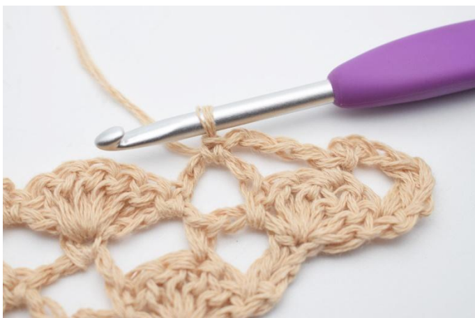
7. Så här.