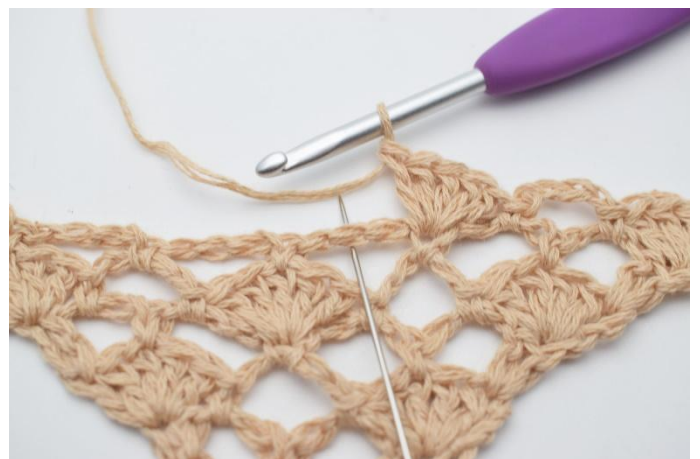
10. I nästa lm-båge virkas