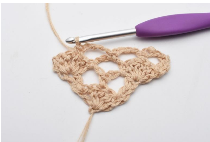
9. virkas 1 fm.