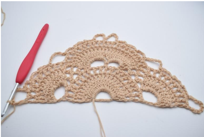
32. Så här.