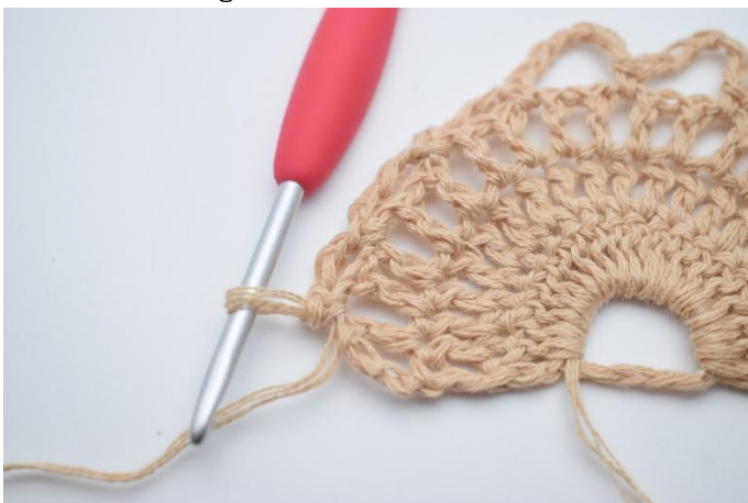
13. Upprepa 1 gång till så att du har 3 små lm-bågar med 4 lm.