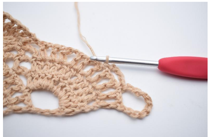
19. Lägg upp 4 lm, hoppa över 1 liten lm-båge, virka 1 fm i nästa lilla lm-båge.