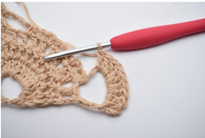
33. Vänd ditt arbete med 3 lm (ersätter 1. st). Virka 9 st i den stora lm-bågen (10 st)