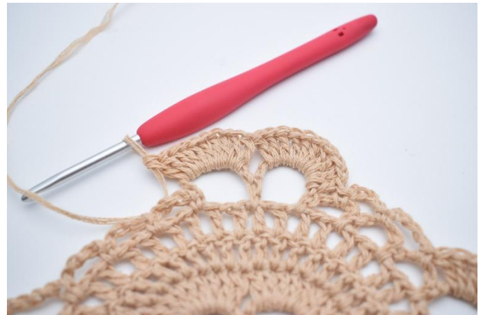
40. Virka 10 st kring nästa stora lm-båge.