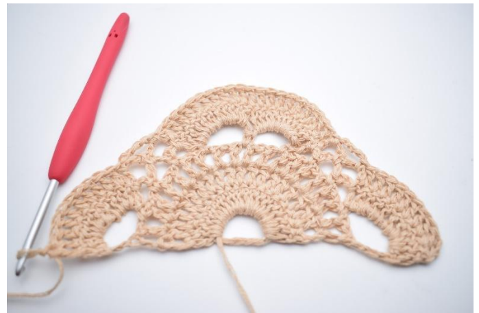
10. Virka 1 st i alla m kring den sista stora lm-bågen. (10 st)