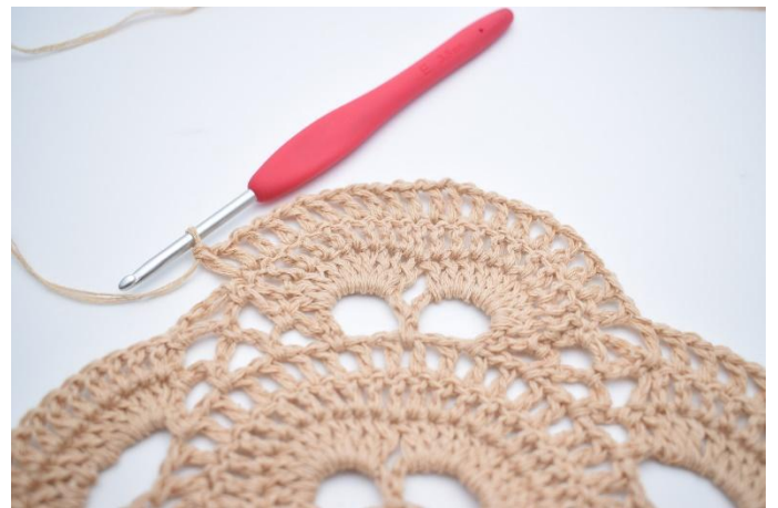
Virka "1 lm, 1 st" i alla st kring de 2 stora lm-bågarna (20 st).