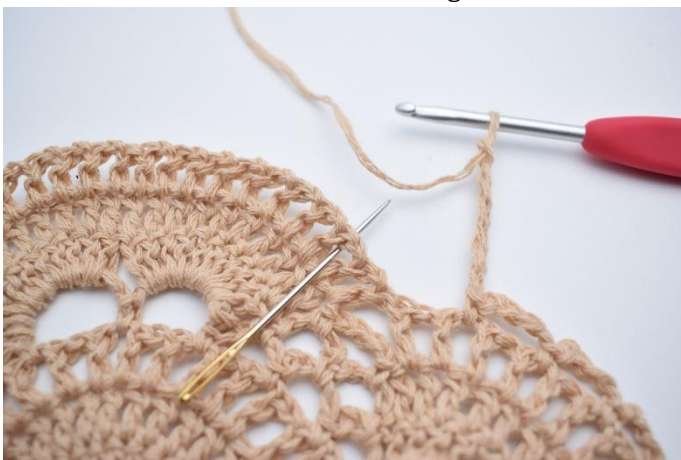
22. Lägg upp 7 lm, hoppa över 2 små lm-bågar. Virka 1 fm i nästa lilla lm-båge. Nålen markerar här var din fm ska virkas.