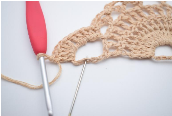
13. Virka 10 st i den sista stora lm-bågen. Den sista st virkas i 3. lm som nålen markerar här.