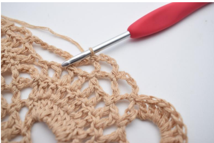
35. Lägg upp 4 lm, virka 1 fm i nästa lm-båge. Upprepa 1 gång till, så du har 2 små lm-bågar.