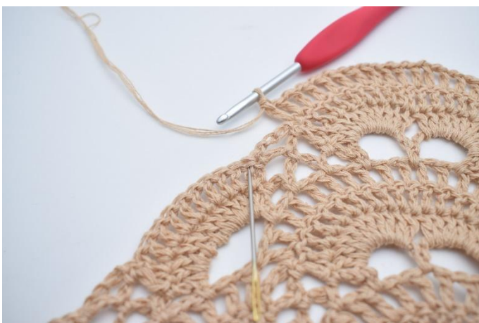
53. Hoppa över den lilla lm-bågen, virka 1 st i den första st kring den nästa stora lm-bågen. Nålen markerar här var din nästa st ska virkas.