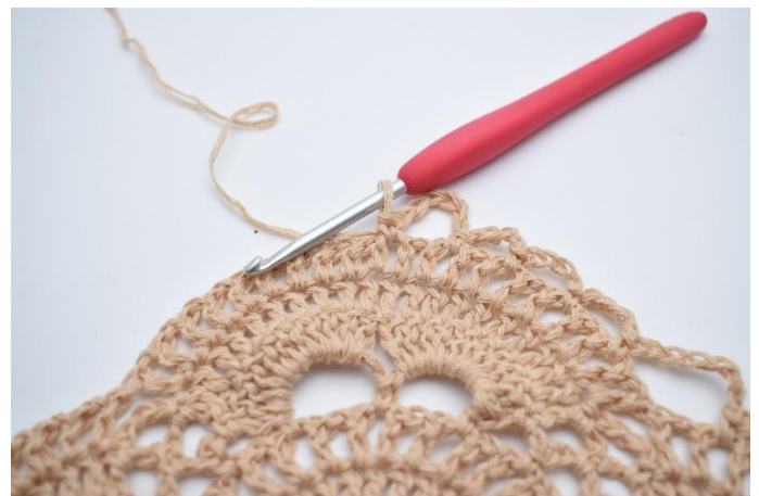
25. Lägg upp 7 lm, hoppa över 1 liten lm-båge, virka 1 fm i nästa lilla lm-båge.