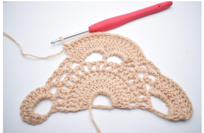
6. Virka 1 st i alla m kring de 2 stora lm-bågarna (20 st).