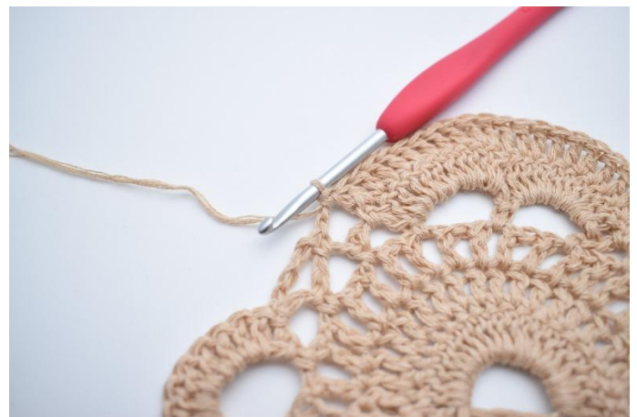
8. Så här.