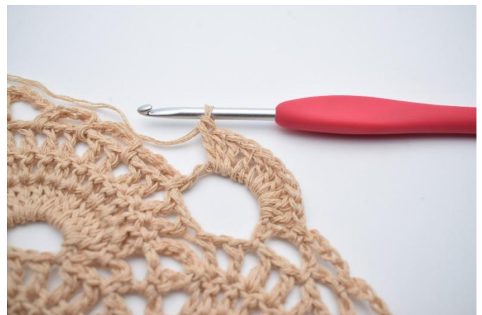
36. Virka 10 st kring den stora lm-bågen.