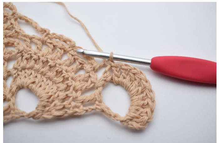
34. Virka 1 fm i lm-bågen bredvid.