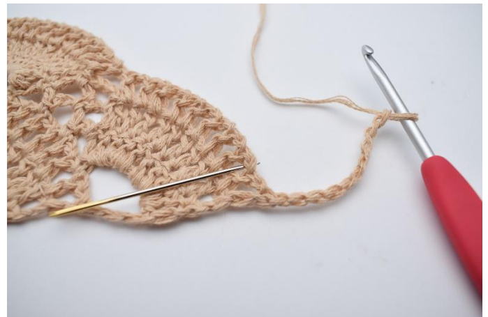
17. Hoppa över 1 lm-båge och virka 1 fm i nästa lm-båge. Nålen markerar här den lm-båge det ska virkas 1 fm i.