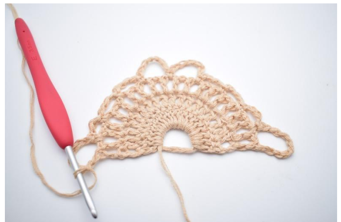
16. Så här.