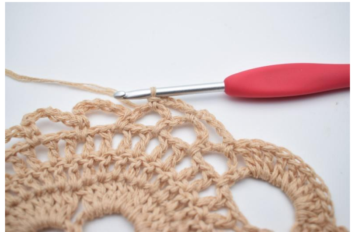
38. Lägg upp 4 lm, virka 1 fm i nästa lm-båge. Upprepa 1 gång till, så du har 2 små lm-bågar.