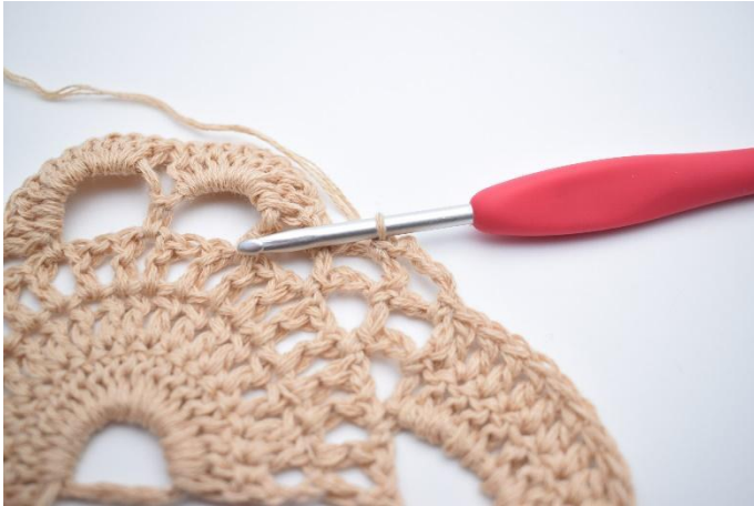
5. Lägg upp 4 lm, virka 1 fm i nästa lm-båge