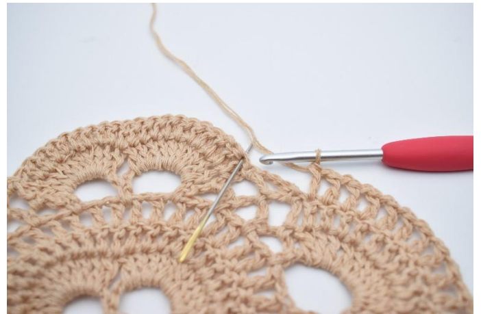
51. Hoppa över den lilla lm-bågen, virka 1 st i den första st kring den nästa stora lm-bågen. Nålen markerar här var din nästa st ska virkas.