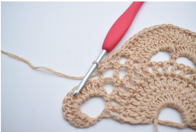
9. Lägg upp 4 lm, virka 1 fm i nästa lm-båge. Nålen markerar här var din fm ska virkas.