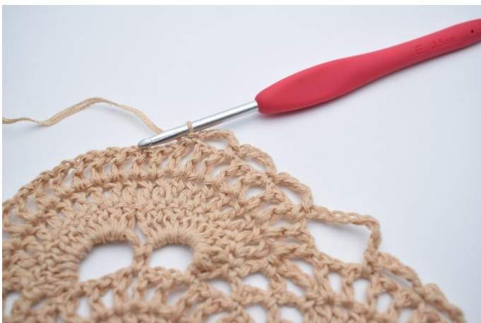
24. Lägg upp 4 lm, hoppa över 1 liten lm-båge, virka 1 fm i nästa lilla lm-båge. Upprepa " till " i allt 3 gånger. så du har 3 små lm-bågar.