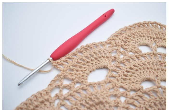
54. Virka "1 lm, 1 st" i alla st kring den stora lm-bågen (10 st).