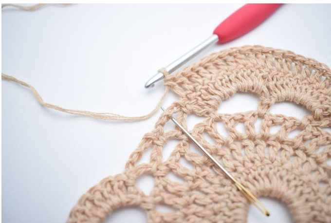
7. Virka 1 fm i nästa lm-båge. Nålen markerar här var din fm ska virkas.