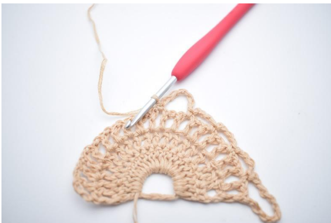
9. Så här.