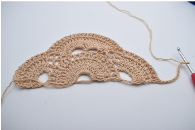
16. Vänd ditt arbete med 10 lm (ersätter 1 st och 7 lm).