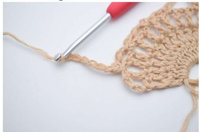
14. Lägg upp 7 lm.