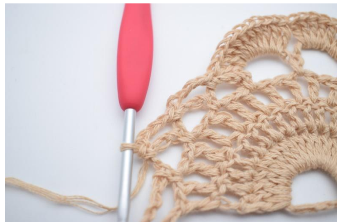
12. Lägg upp 4 lm, virka 1 fm i nästa lm-båge.