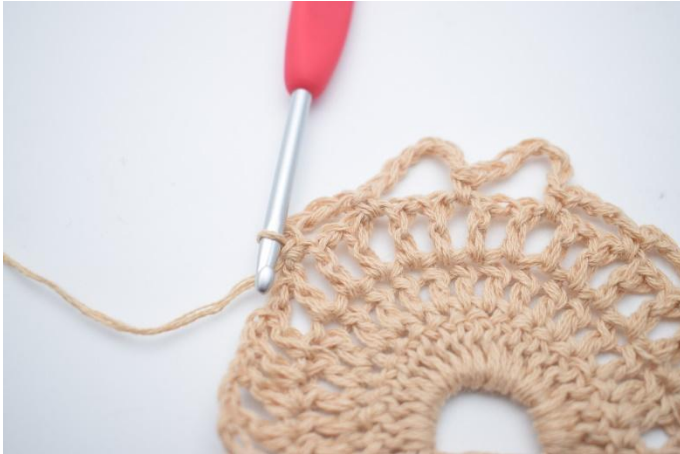
11. Lägg upp 4 lm, hoppa över 1 lm-båge, virka 1 fm i nästa lm-båge