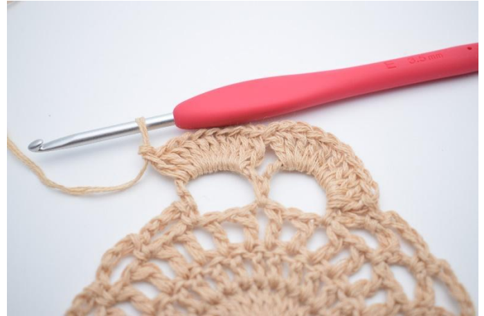
8. Virka 10 st i nästa stora lm-bågen bredvid.