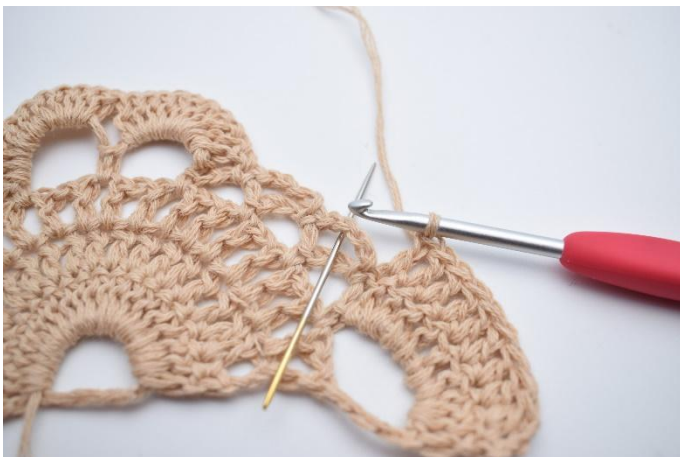
3. Virka 1 fm i nästa lm-båge. Nålen markerar här var din fm ska virkas.