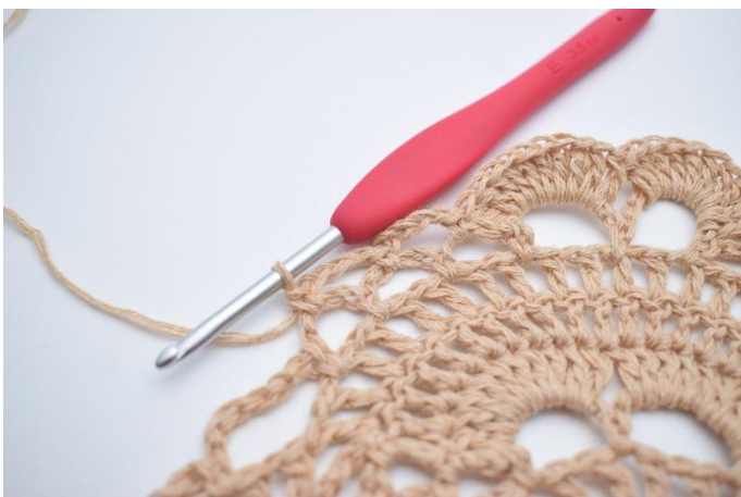
41. Lägg upp 4 lm, virka 1 fm i nästa lm-båge. Upprepa 1 gång till, så du har 2 små lm-bågar.