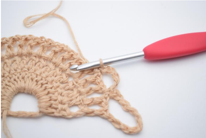
5. Så här.