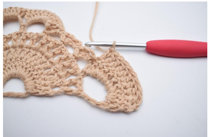
2. Virka 1 st i alla m kring den stora lm-bågen (10 st).