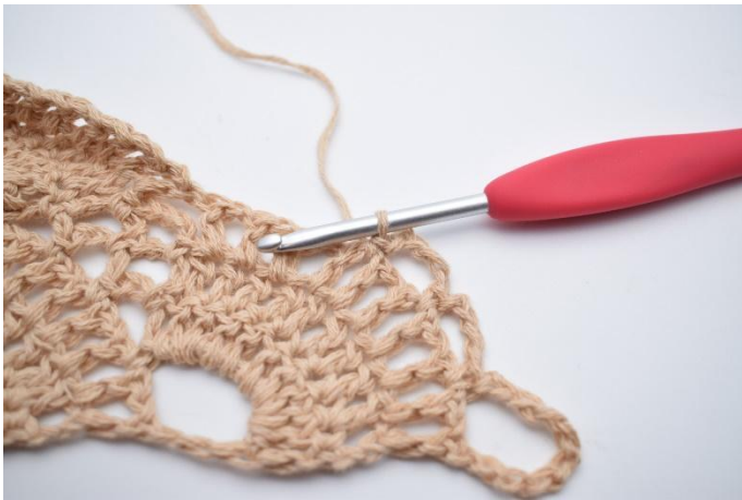
20. Lägg upp 4 lm, hoppa över 1 liten lm-båge, virka 1 fm i nästa lilla lm-båge.