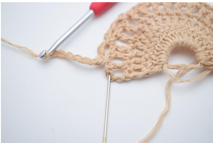
15. Lägg upp 7 lm, virka 1 st i sista m. Nålen markerar här var din st ska virkas.