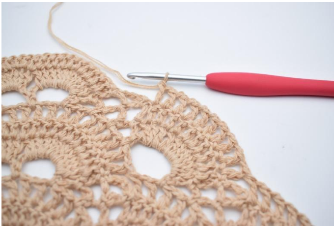
50. Virka "1 lm, 1 st" i alla st kring den stora lm-bågen (10 st).