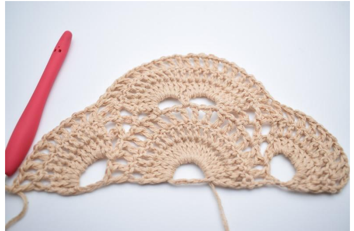
8. Virka "1 lm, 1 st" i alla maskorna runt den stora lm-bågen (10 st)