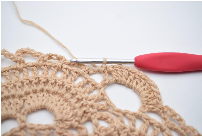
37. Virka 1 fm i lm-bågen bredvid.