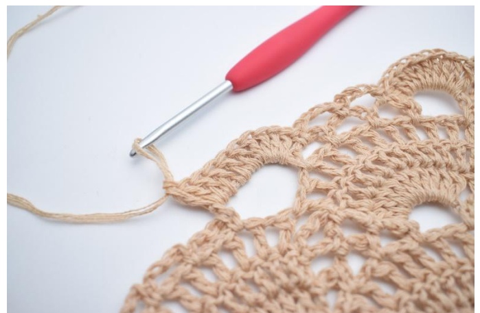
42. Virka 10 st i den nästa stora lm-bågen