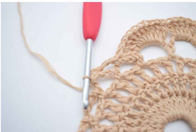
11. Lägg upp 4 lm, virka 1 fm i nästa lm-båge.