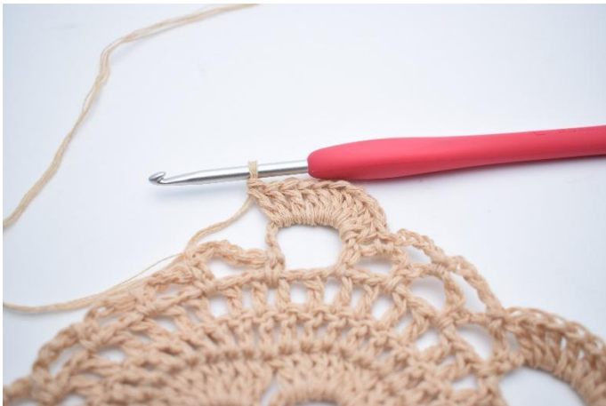
39. Virka 10 st kring den stora lm-bågen.