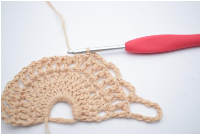
7. Upprepa 1 gång till så att du har 3 små lm-bågar.