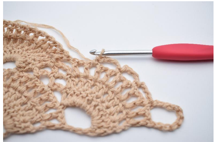
21. Upprepa 1 gång till så du har 3 små lm-bågar.