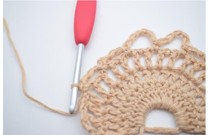
12. lägg upp 4 lm, hoppa över 1 lm-båge, virka 1 fm i nästa lm-båge.