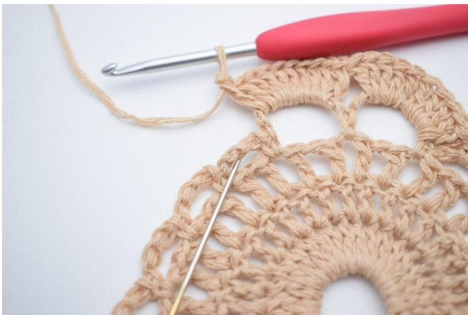
9. Virka 1 fm i nästa lm- båge. Nålen markerar här var din fm ska virkas.