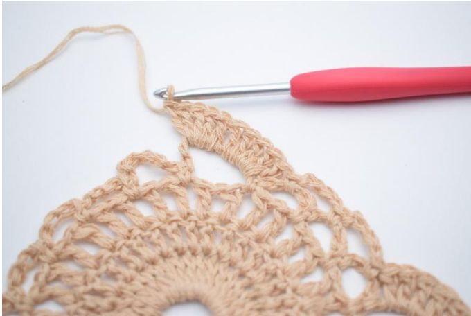
7. Virka 10 st kring den stora lm-båge.