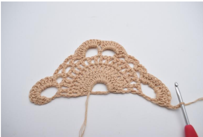
1. Vänd ditt arbete med 3 lm (ersätter 1. st).