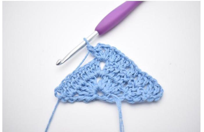
4. I lm-bågen virkas 2 st, 2 lm, 2 st.