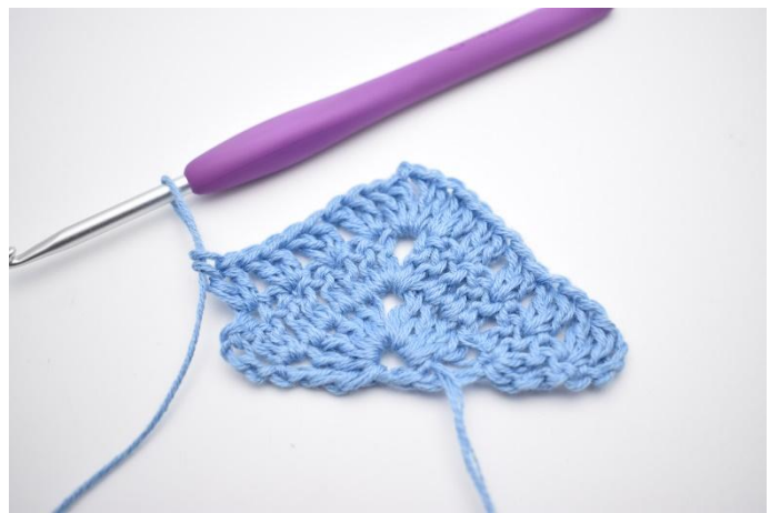
6. Upprepa "till" i allt 4 gånger.