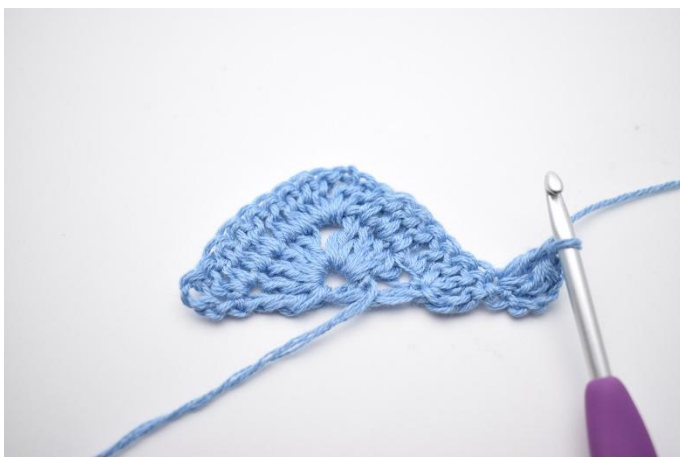
1. Vänd arbetet med 4 lm (ersätter 1 dbst). Virka 2 st i första m.