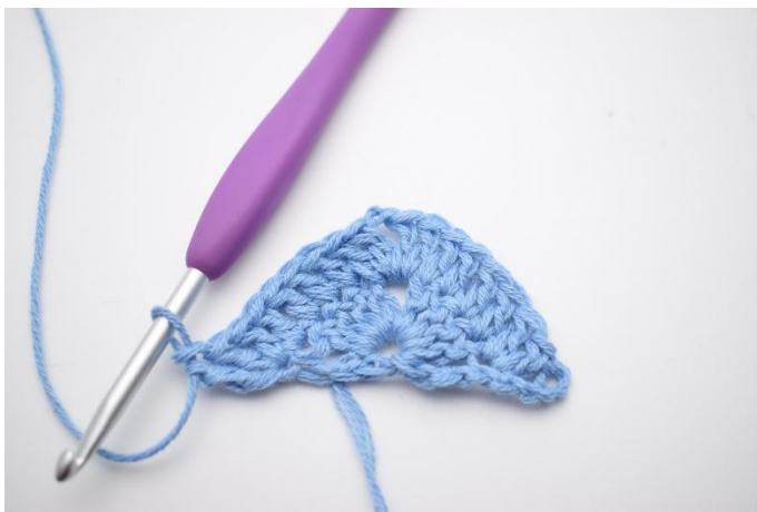
7. virkas 2 st och 1 dbst.