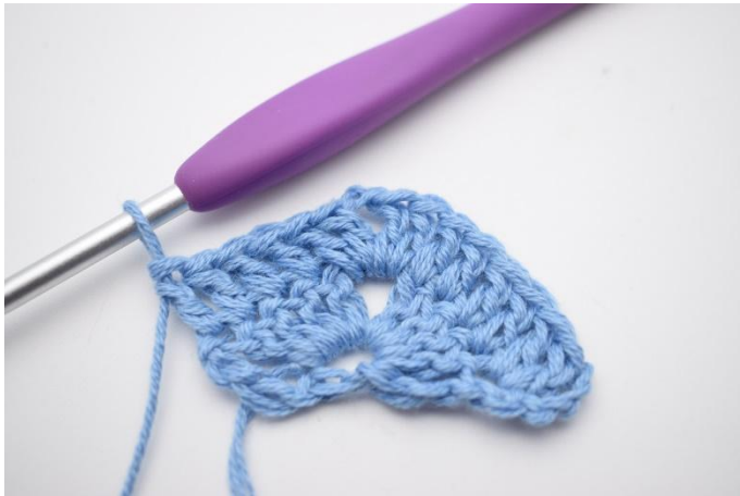
5. Virkas 1 st i de nästa 4 m.