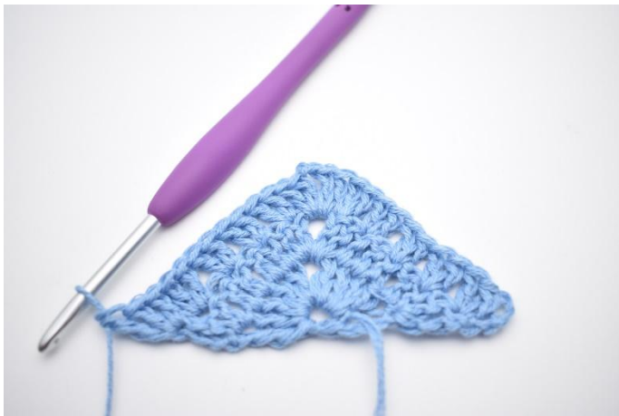
7. I sista m virkas 2 st och 1 dbst