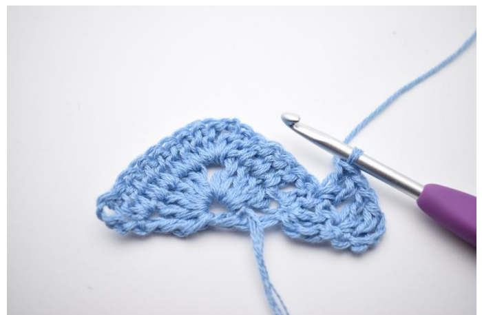
2. "Hoppa över 1 m, virka 2 st i nästa m".