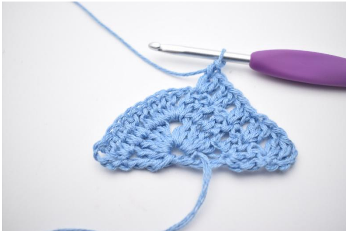
3. Upprepa "till" i allt 4 gånger.