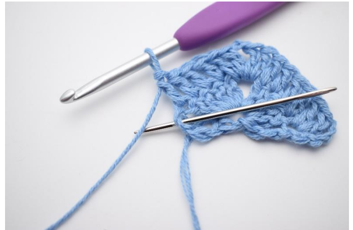
6. I sista m (den som nålen markerar här),