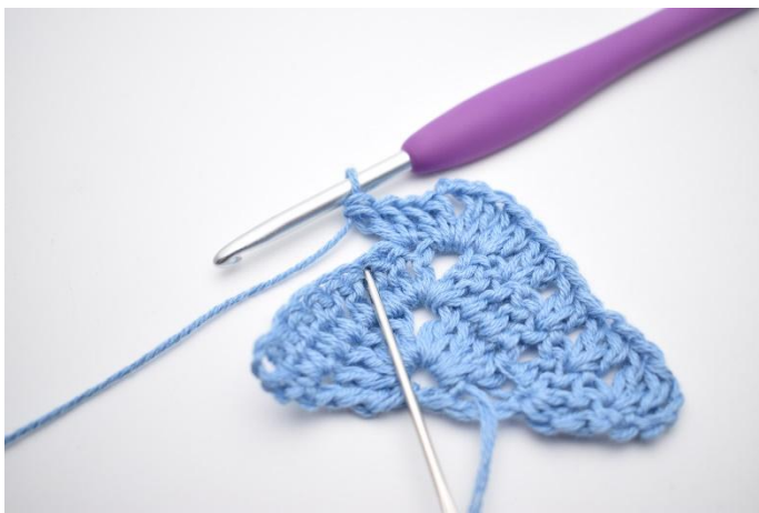
5. Virka "2 st, hoppa över 1 m".