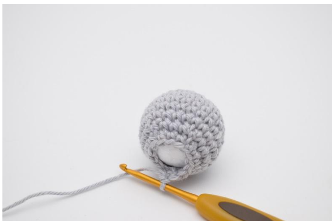
3. Det virkas nu vidare runt kulan.