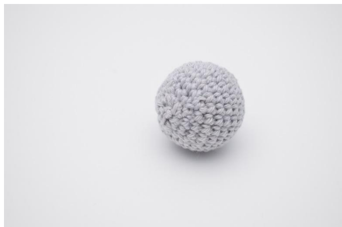
4. Sy ihop hålet, fäst ändarna.