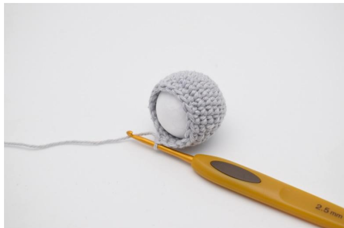
2. stoppas kulan på plats.