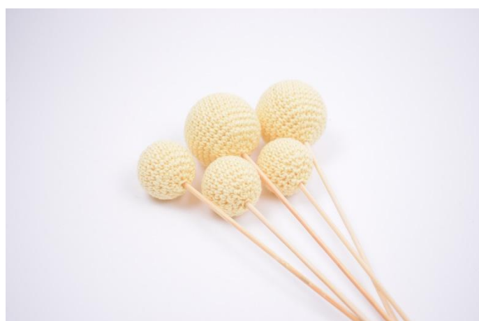
6. De är nu klara till att dekorera ditt hem 😊