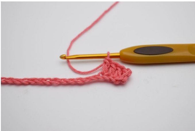
3. Virka 1 stolpe i de följande 3 lm.