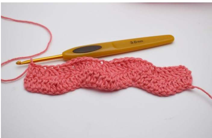
15. "Virka 1 stolpe i följande 3 m. Nu virkas 3 stolpar tillsammans i följande 3 m. Virka 1 stolpe i följande 3 m, virka 3 stolpar i samma maska." Upprepa "till" varvet ut tills du har 4 m kvar. Virka 1 stolpe i följande 3 m.