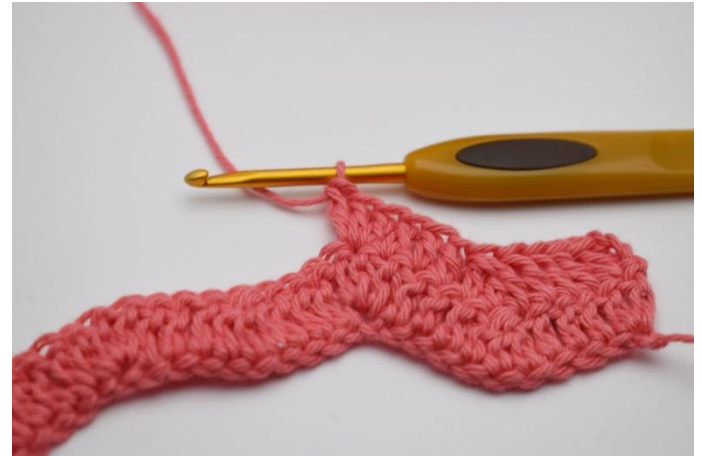
14. Virka 3 stolpar tillsammans i nästa maska.