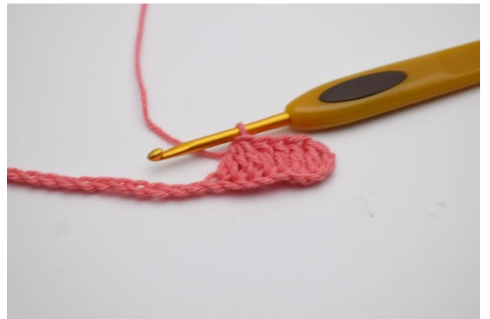
4. Nu virkas det 3 stolpar tillsamman i följande tre maskor.