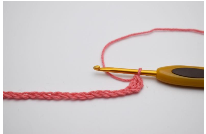
2. Virka 1 stolpe i 3 lm från virknålen.