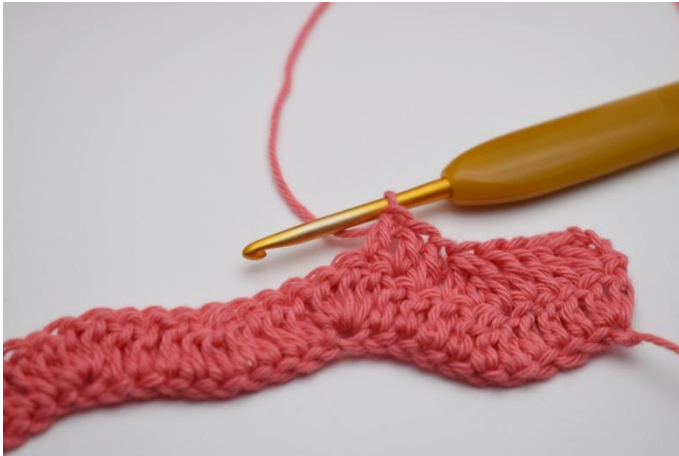
13. Virka 1 stolpe i följande 3 m.