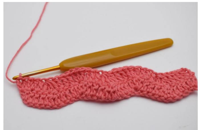
18. Upprepa varv 2 till önskad längd.