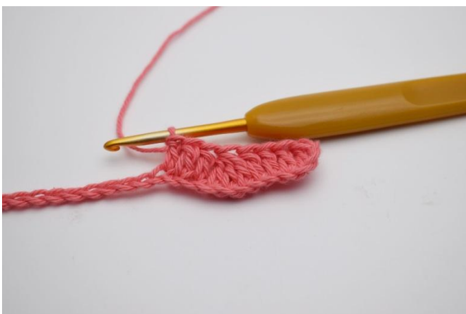
5. Virka 1 stolpe i de följande 3 lm.