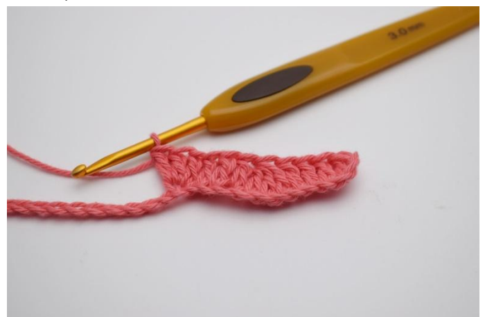
6. I efterföljande lm, Virkas 3 stm i samma lm.