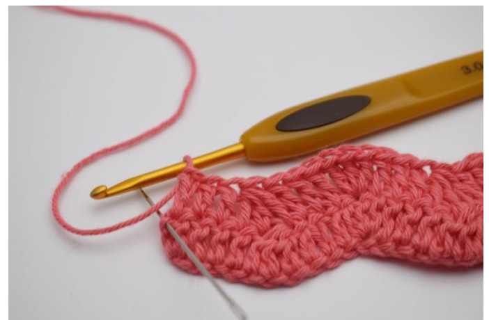
16. I sista maskan virkas 2 stolpar.