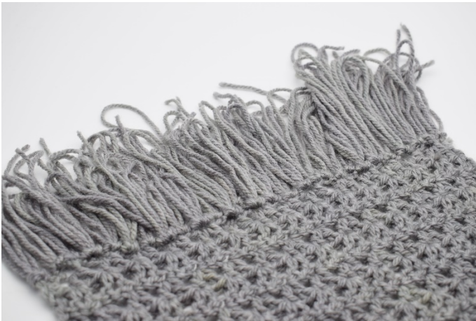
7. Upprepa hela vägen på båda sidor. Hoppa över var 2:a eller var 3:e så det inte blir för tätt med fransarna.