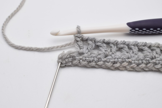
8. Hoppa över 2 m. I nästa m (nålen markerar),