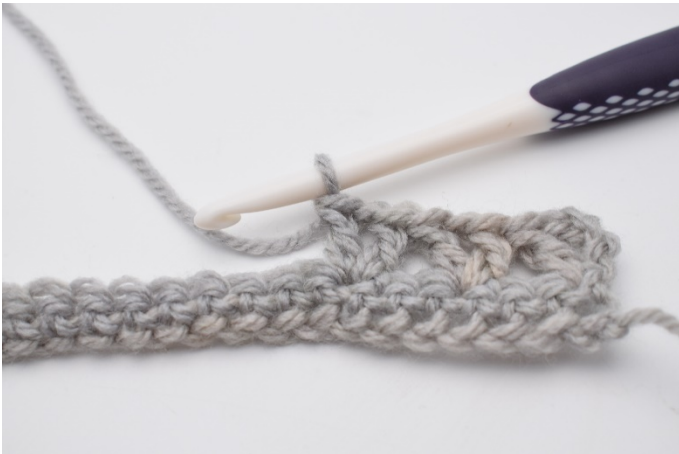
6. virkas * 1 st, 1 lm, 1 st* .