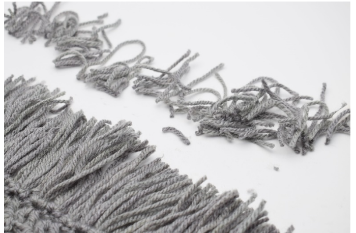
8. Klipp till fransarna så det blir jämnt.