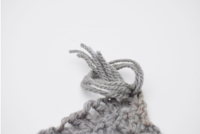
5. Här ser du hur du drar igenom.