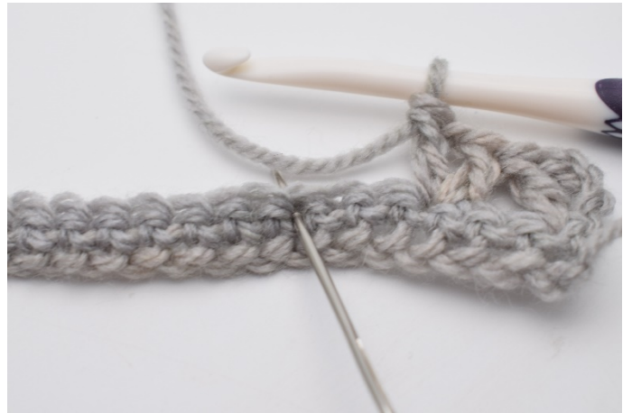
5. Hoppa över 2 m. I nästa m (nålen markerar),