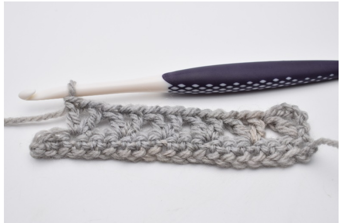
7. Upprepa detta varvet ut tills det återstår 3 m.