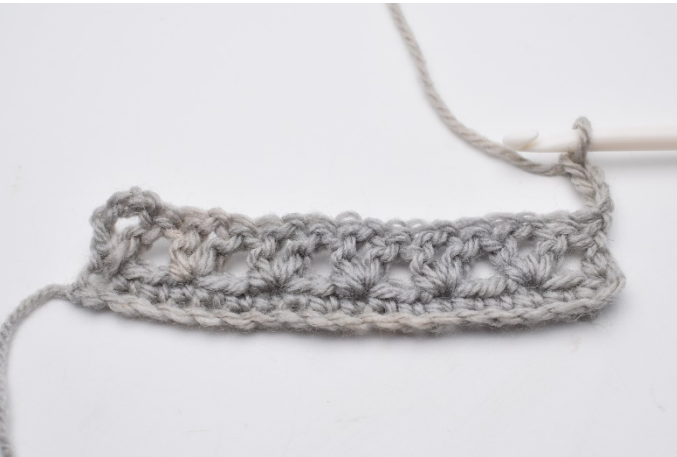
1. Vänd arbetet med 4 lm.