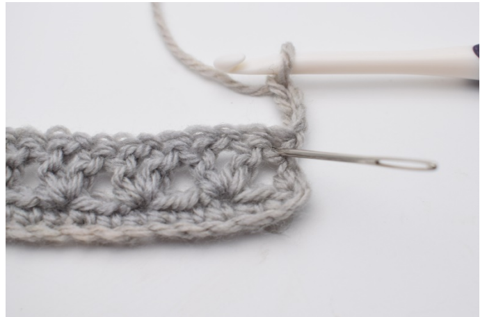
Virka 1 st i första m. Nålen markerar var.