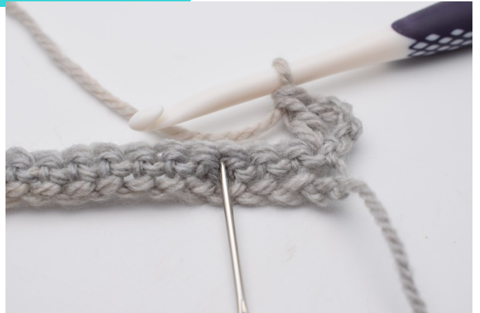
3. Hoppa över 2 m. I nästa m (nålen markerar),