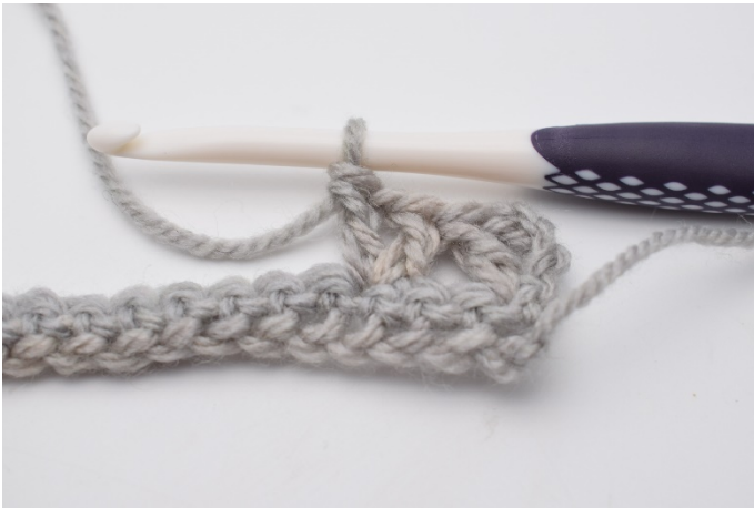
4. virkas * 1 st, 1 lm, 1 st* .