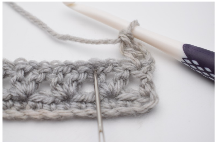
3. Hoppa över 2 m , du ska virka i 2:a st på förra varvet. ( Nålen markerar var din nästa m ska virkas.)