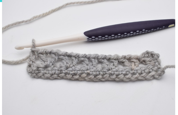
9. virkas 1 st.