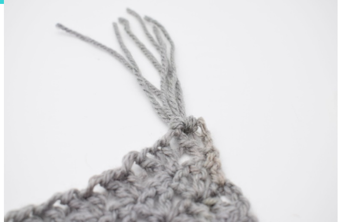
6. Dra åt lite.