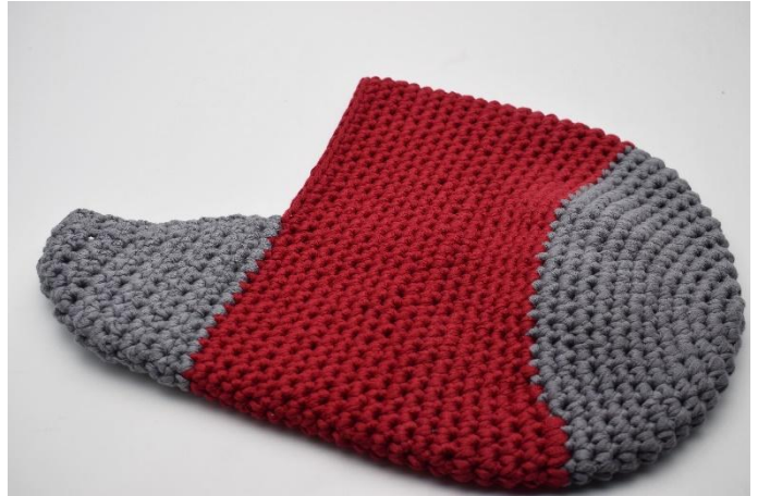
Sy ihop sidorna på avigsidan. Din häla är nu färdig.