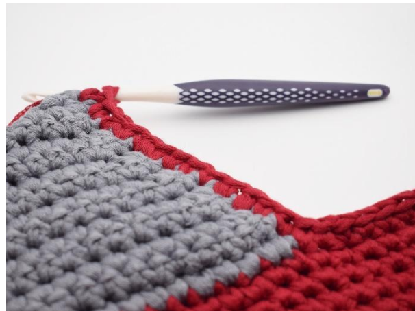
Virka nu 14 fm längs den ena sidan av hälen