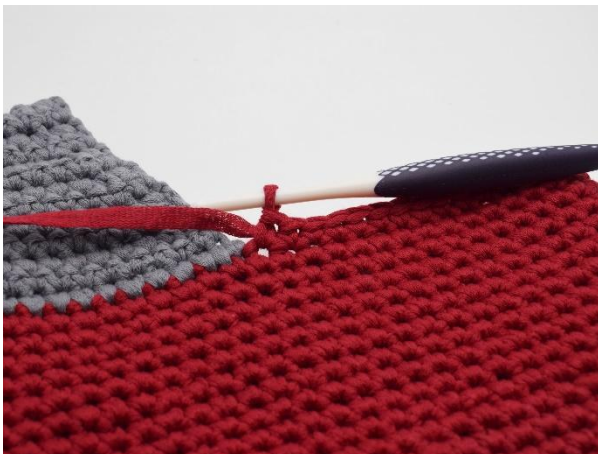
Virka 1 fm i de följande 32 m fram till där hälen börjar.