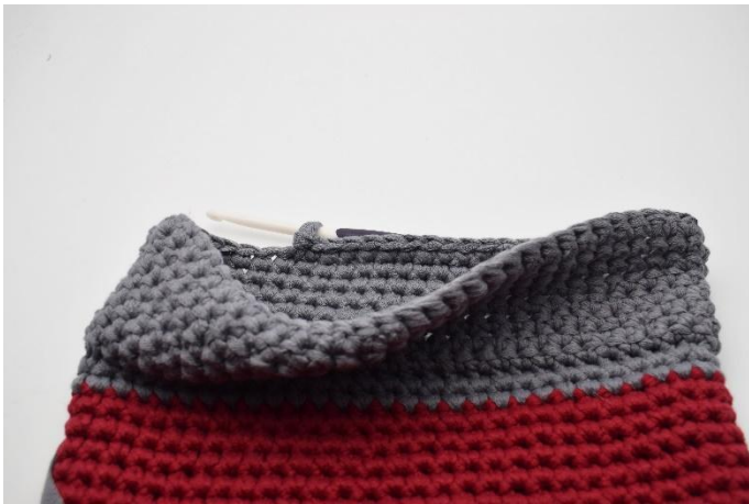
Kanten är nu färdig virkad.