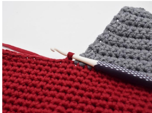
Sätt i det röda garnet.