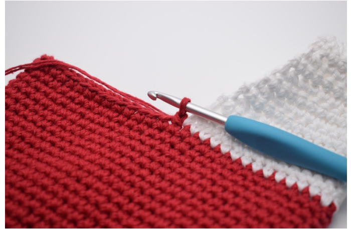
Använd det röda garnet och gör 1 sm.