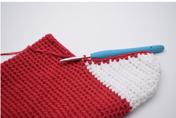
14 fm längs den andra sidan av hälen.