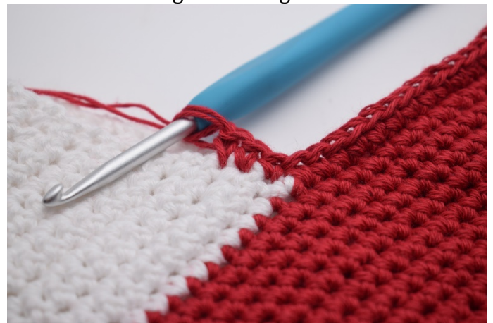
Virka 14 fm längs den ena sidan av hälen.