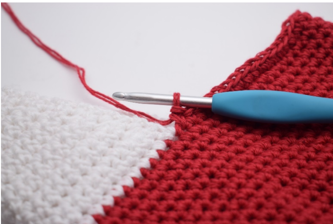
Virka 1 fm i 32 m fram tills där hälen startar.