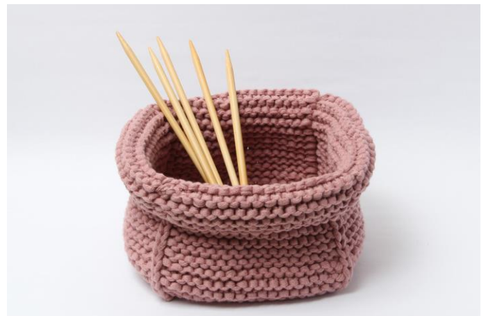
Korg med nedvikt kant