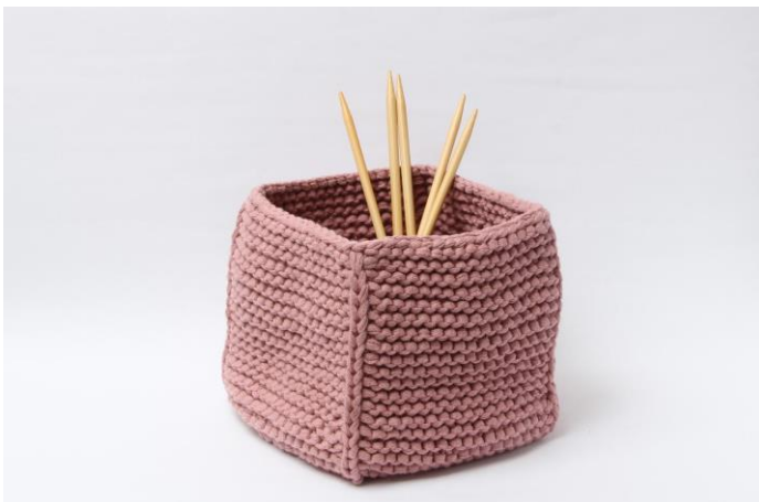
Korg utan nedvikt kant

Vänd arbetet tillbaka på rätsidan och vik ner kanten.