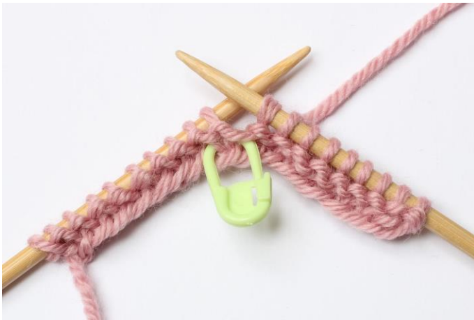
3. lyft över den på den högra stickan,