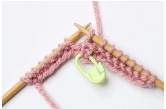
6. Drag den första lyfta maskan över de 2 stickade maskorna.