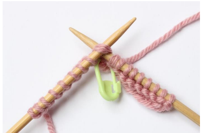
4. Sticka 2 maskor räta tills,