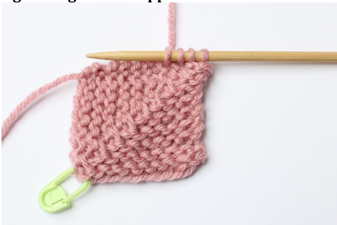
1. Stoppa in stickan genom arbetet mellan 2 maskor, hämta upp garnet tillbaka genom arbetet