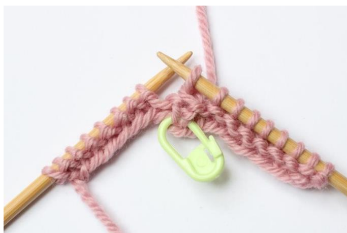
6. Dra den lyfta maskan tillbaka till vänster sticka