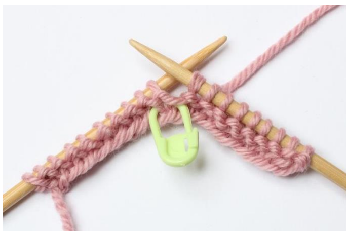
3. Lyft maskan över till höger sticka