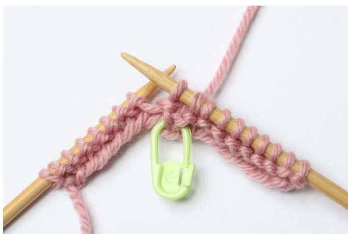
5. Sticka ihop dessa 2 maskor rät.