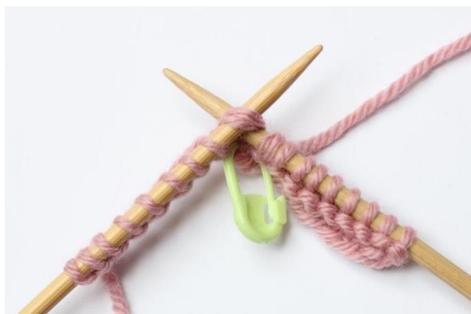
4. Stoppa in stickan i 2 maskor, från vänster mot höger.