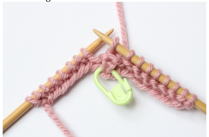
6. Dra den lyfta maskan tillbaka till vänster sticka