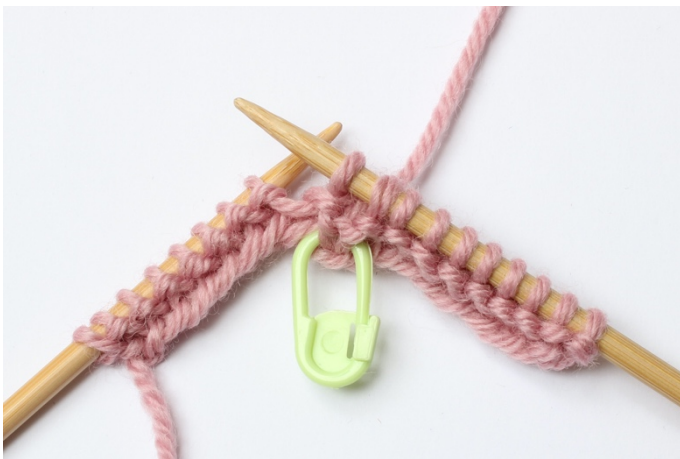
5. Sticka ihop dessa 2 maskor rät.