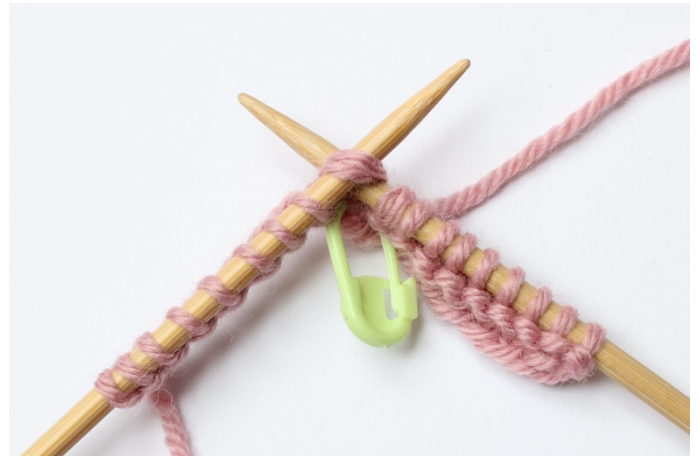
4. Stoppa in stickan i 2 maskor, från vänster mot höger.