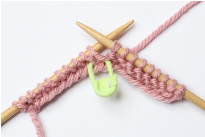
3. Lyft maskan över till höger sticka