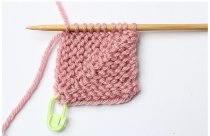
2. Upprepa till alla maskor är uppstickade.