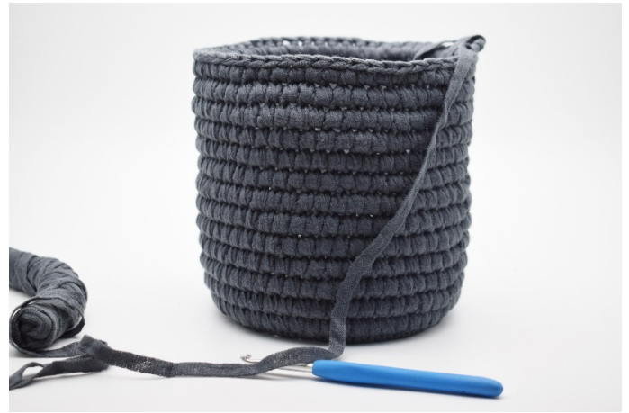
16. Upprepa * 1 varv fm, 1 varv dfm* tills du har 13 omgångar eller önskad höjd.