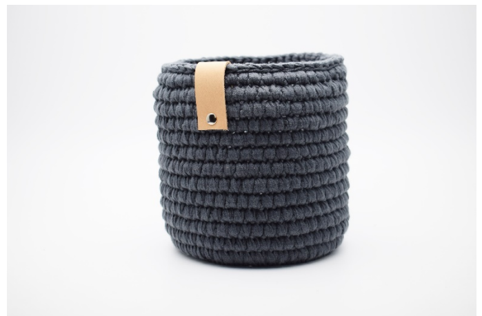
2. Sätt läderremmen ner över kanten och montera dit en nit.