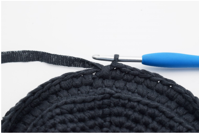
15. Upprepa dfm varvet runt.