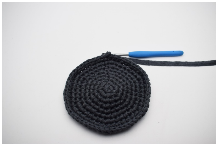
1. Här är sista varvet avslutat. (54)