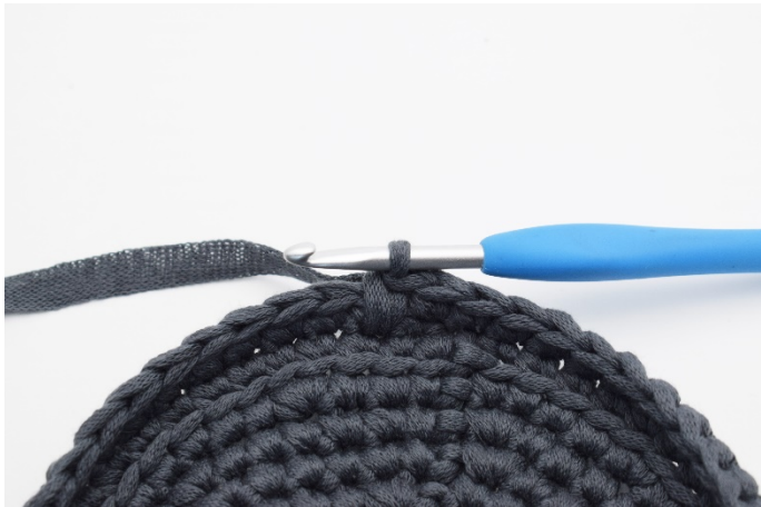
9. Så. 1 dfm är virkad.