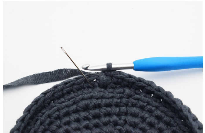
10. Nålen markerar var din nästa dfm ska virkas.