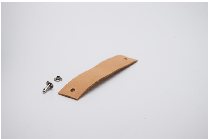
1. Klipp läderremmen i önskad storlek och gör hål i bägge ändrana.