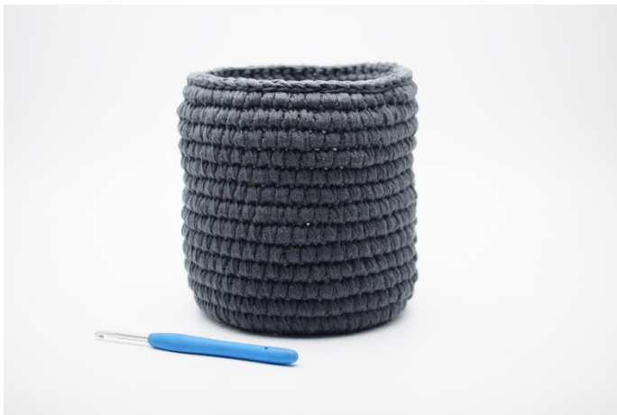
17. Avsluta med 1 varv sm.