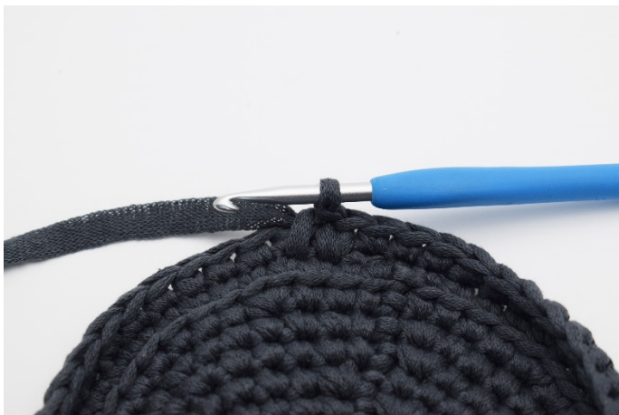
11. Så. Ännu 1 dfm är virkad.