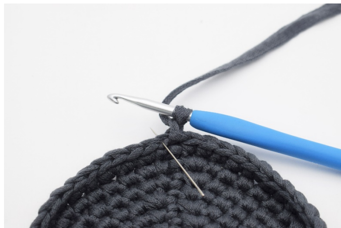
2. Nu virkas det 1 varv med fm i bmb. Virka 1 lm därefter fm i bmb. Nålen markerar var maskan virkas.