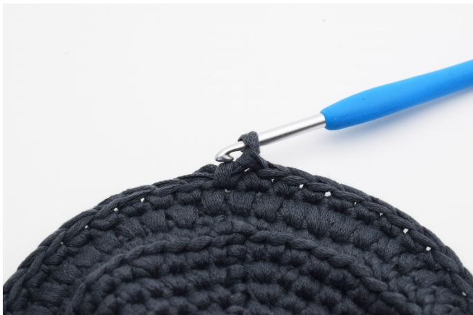
13. Virka 1 varv med "vanliga" fm..