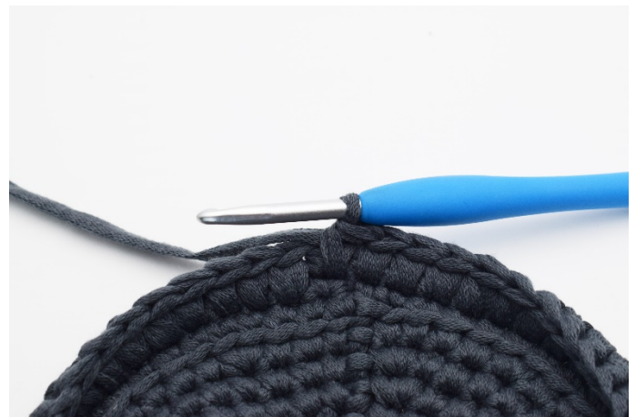
12. Upprepa dfm varvet runt.