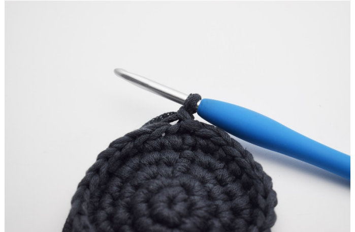
6. 1 lm.