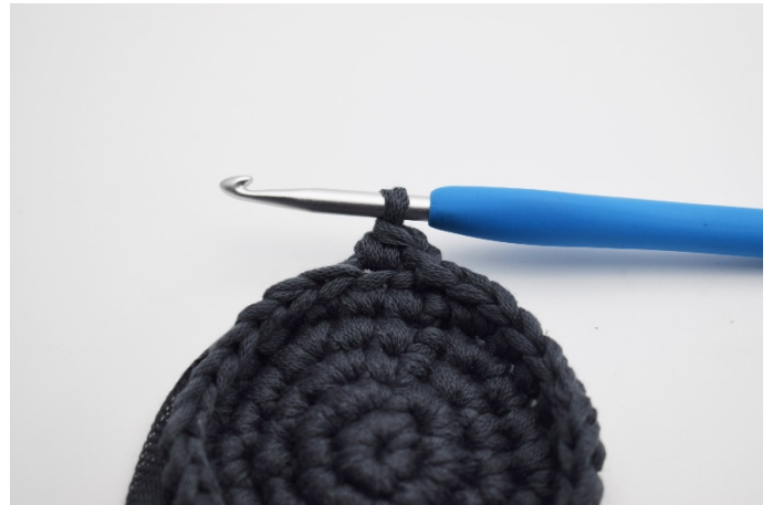
8. Så ser det ut nu, Fortsätt varvet ut och avsluta med 1 sm.