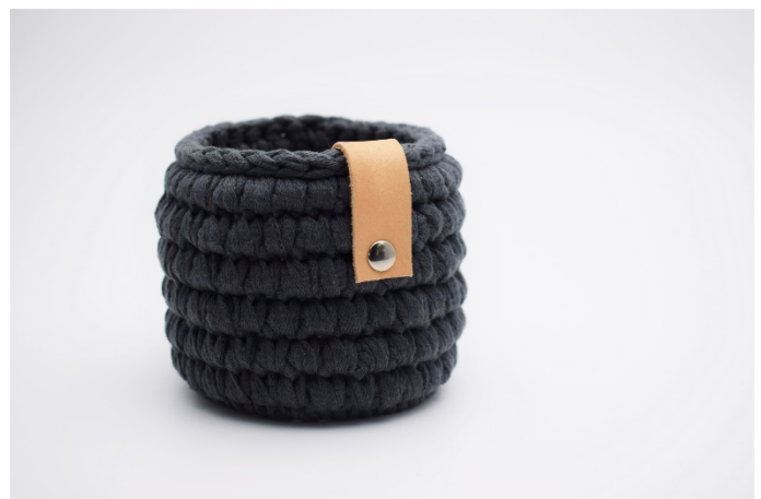
2. Sätt läderremmen ner över kanten och montera dit en nit.