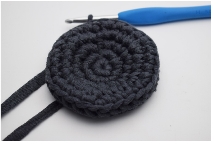
9. Nu är det gjort en "kant" och här ska sidorna virkas.