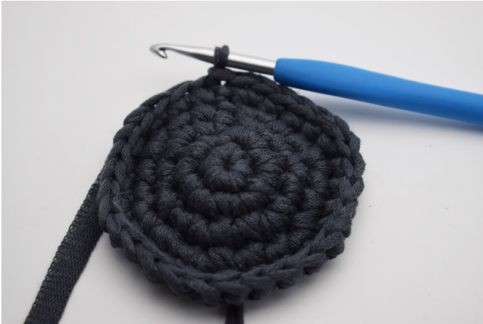
5. 1lm, * 1 fm i följande 3 m, 2 fm i nästa m* Upprepa * - * varvet ut, avsluta med 1 sm (30)