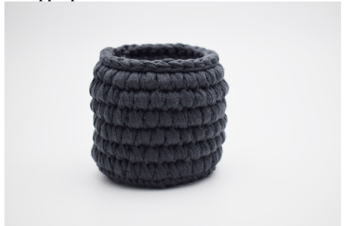
10. Avsluta med 1 varv sm.