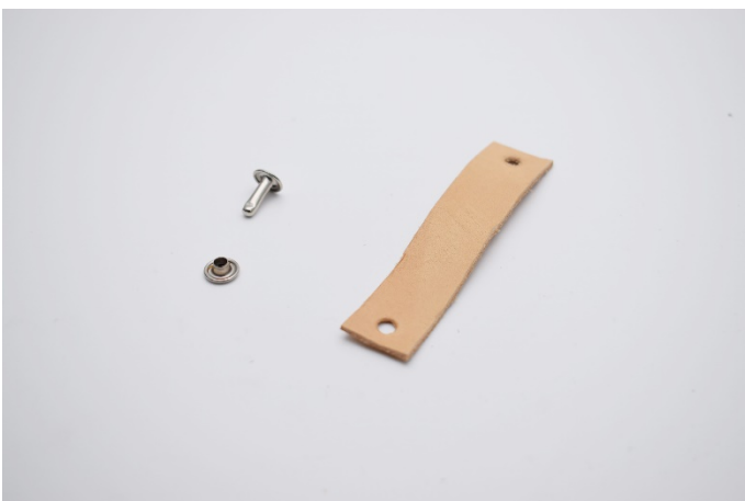
1. Klipp läderremmen i önskad storlek och gör hål i bägge ändrana.