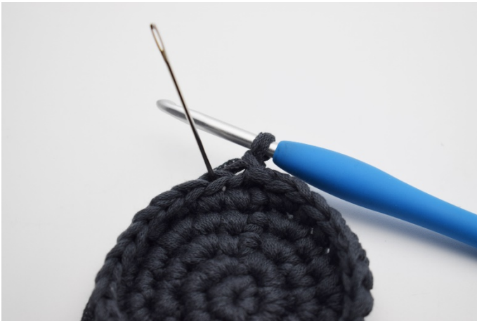
7. Detta varvet virkar man i fm i bmb utan att öka. Nålen markerarden bmb.