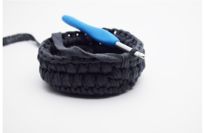
8. Upprepa varvet runt.