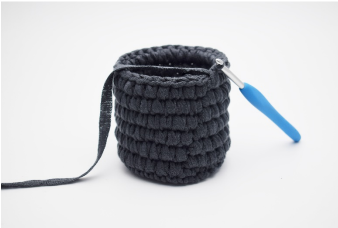
9. Upprepa dessa 2 varv tills du har 6 varv med dfm.