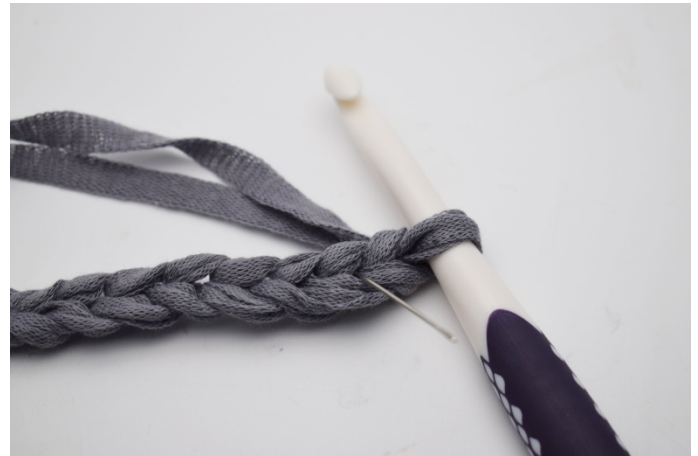
2. I 2:a. lm från nålen. (Nålen här markerar luftmasken) Virka 1 fm.