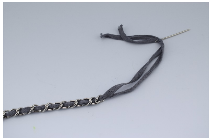
4. Träd dubbelt ribbongarn igenom kedjan.