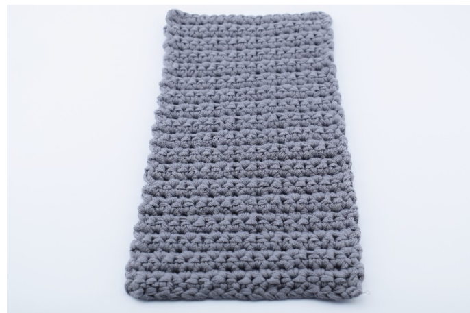
14. Upprepa nu varv 2 och 3 totalt 17 varv.