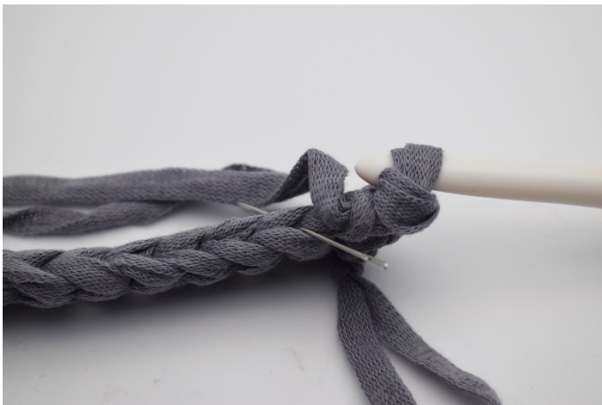
3. Fortsätt virka 1 fm i bakre maskbågen. (Nålen markerar).