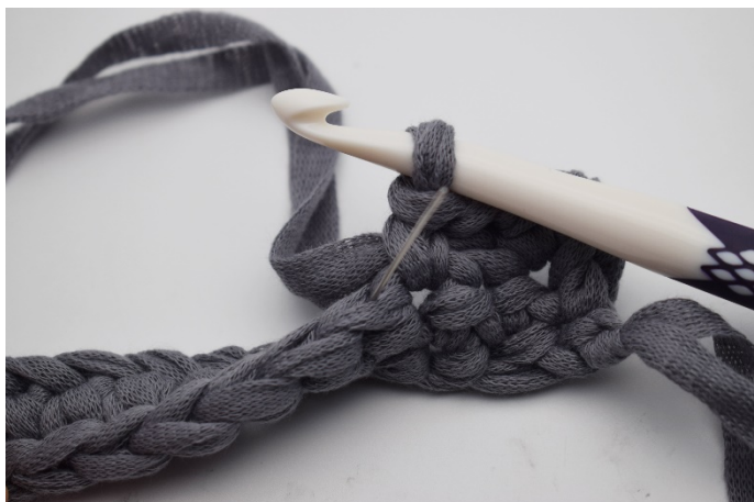
7. Nästa m virkas i bakre maskbågen. (Nålen markerar var.)