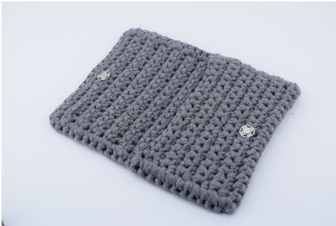
1. Sy magneten på väskan så det passar med när du stänger den.