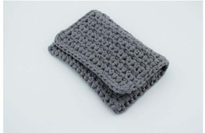
16. Väskan är nu klar. Dax att montera kedja, knapp och magnet.