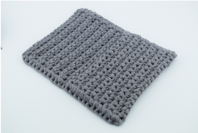
15. Fäst trådarna.