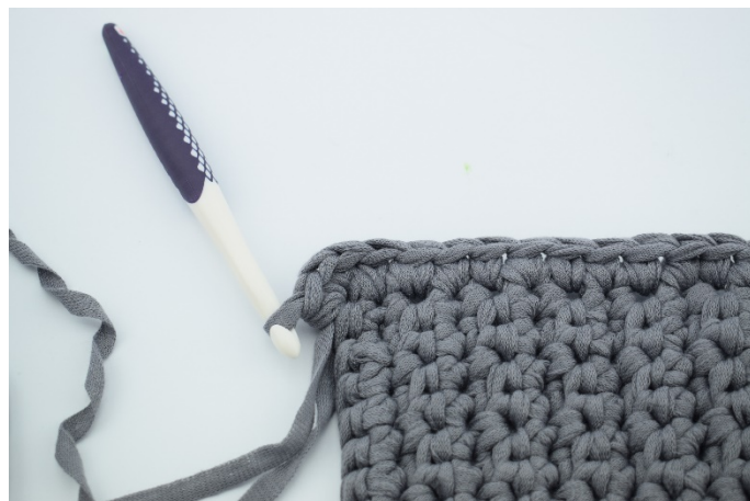
10. Här virkar du 3 fm i samma m för att få ett runt hörn.