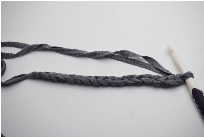
1. Lägga upp 18 lm.