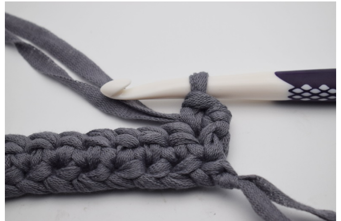
2. Virka 1 fm i första m.