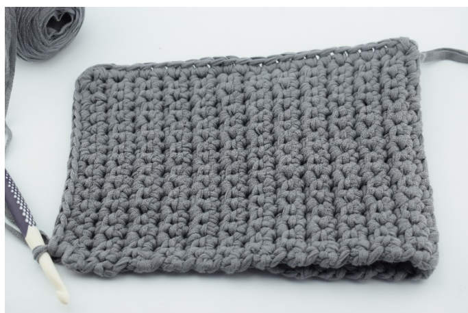
11. Fortsätt virka fm till vä hörn.