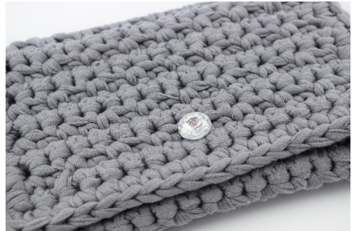
2. Sy även "dekor" knapp på framsidan