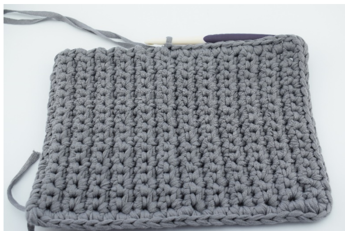
13. Fortsätt virka fm tills du kommer till den dubbla delen, där du fortsätter med fm .