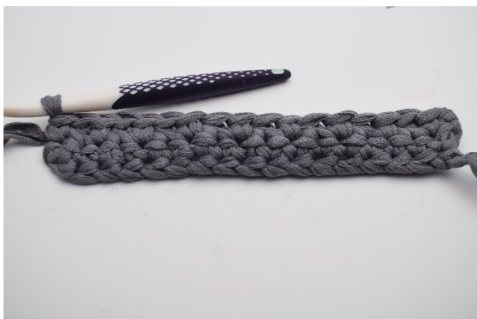
11. Fortsätt virka 1 fm i bakre maskbågen, 1 fm varvet ut.