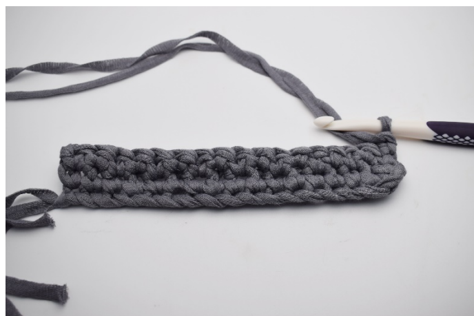
12. Vänd arbetet med 1 lm.