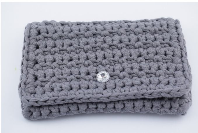
3. Så dax att montera kedjan..