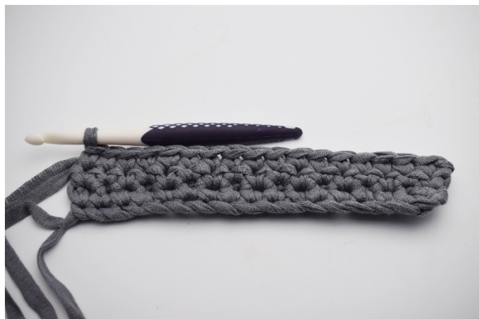
13. Virka fm i varje m hela varvet.