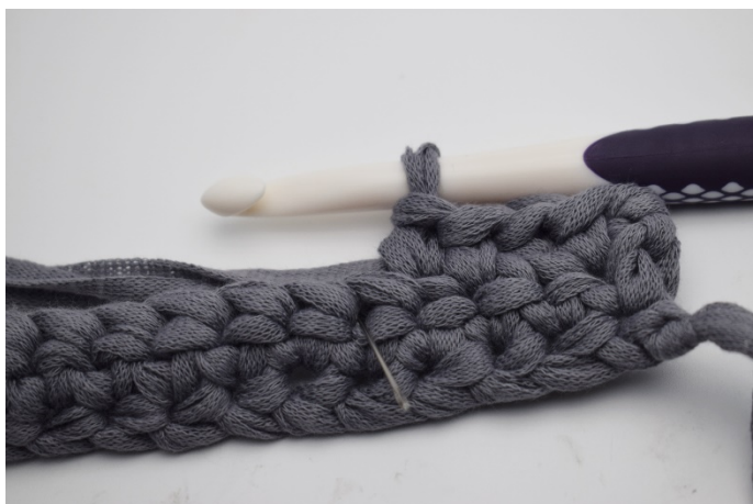
9. Nästa fm virkas som vanligt i nästa m.