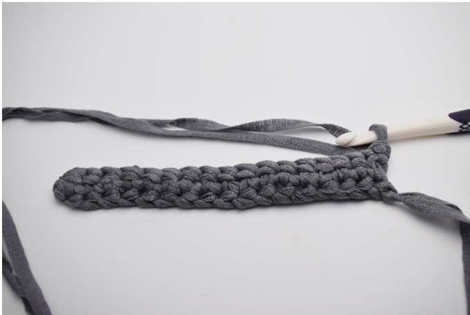
1. Vänd ditt arbete med 1 lm.