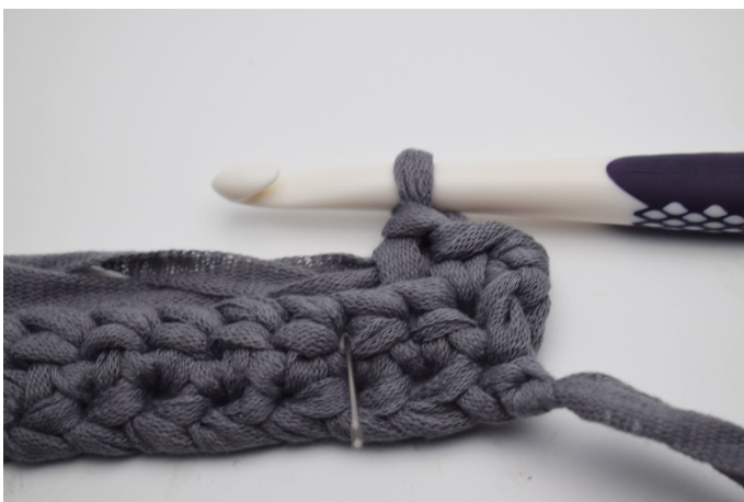
5. Virka 1 fm som vanligt i nästa m.