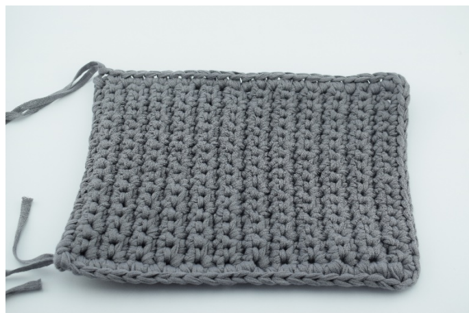
14. Virka fm genom båda delarna på väskan.