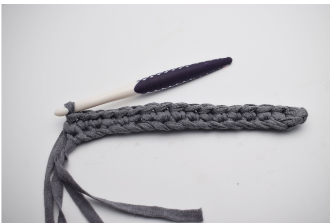
3. Virka fm i varje lm varvet ut. (17)