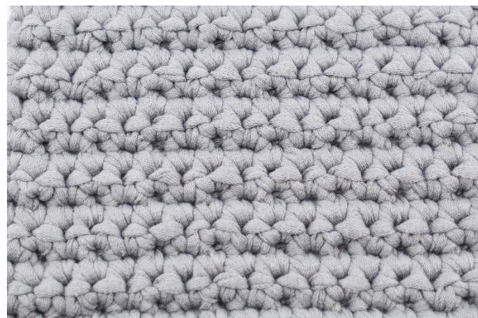
Detta är avigsidan.