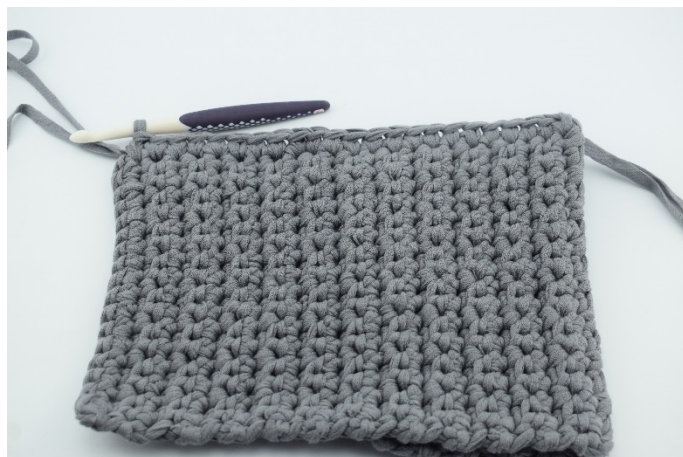
9. Fortsätt med fm fram tills hörnet.