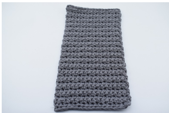
1. Lägg nu arbetet med avigsidan upp.