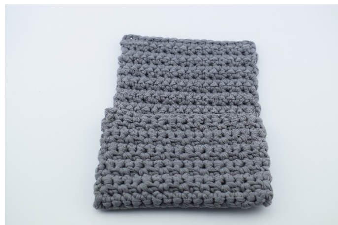
2. Vik nu arbetet som bilderna visar..