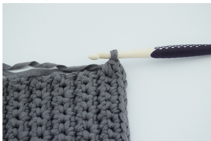
12. Här virkas 3 fm i samma m.