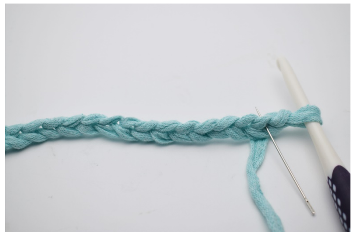
2. I 2:a .lm från nålen ( nålen markerar)