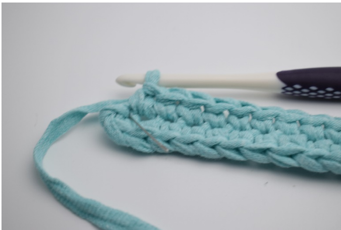
7. I sista lm. (som nålen markerar)