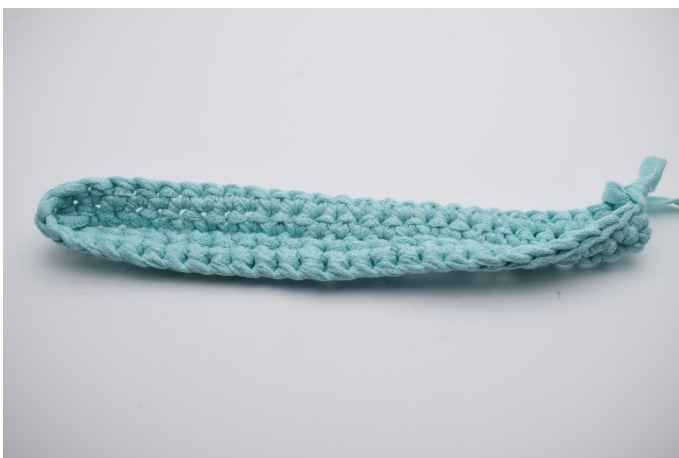
9. Virka 1 varv fm.