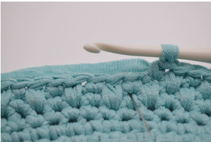
9. Nålen markerar igen var din nästa djfm ska virkas.