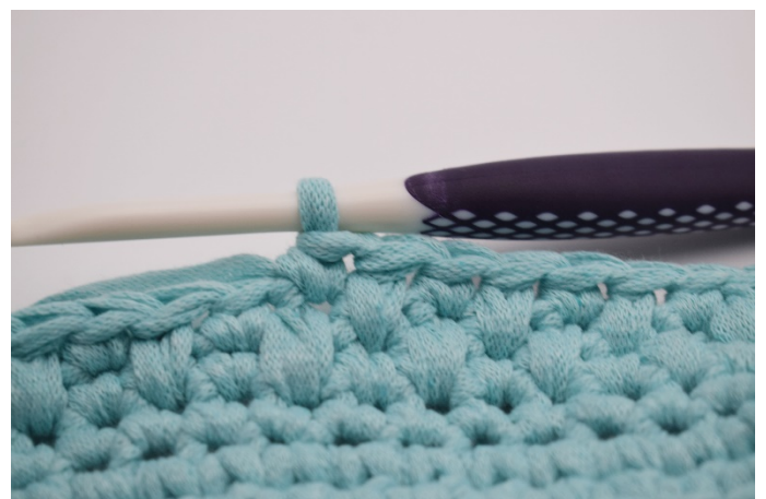
12. Så upprepas varven.