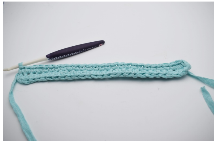
8. Virkas 1 fm ( 55)