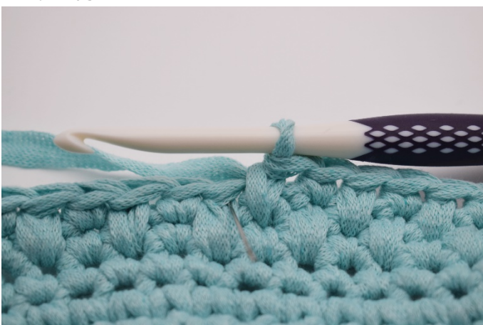
11. Nästa fm virkas som vanligt i nästa m.