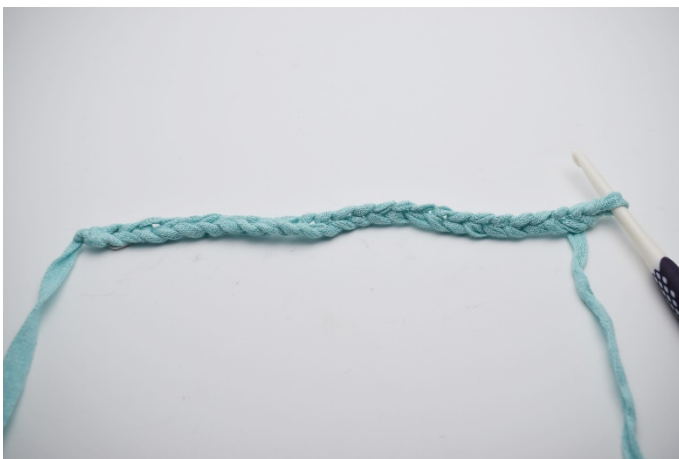
1. Lägg upp lm.