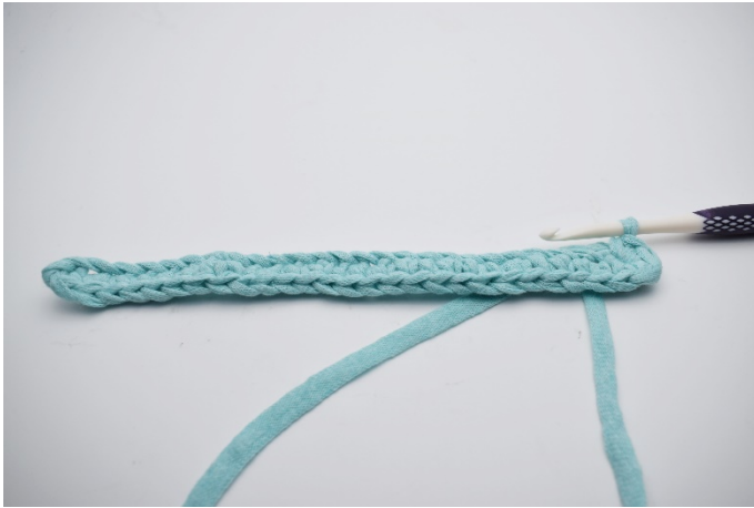
5. I sista m virkas 4 fm.