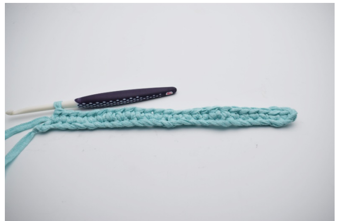
4. Virka 1 fm i följande 24 m.