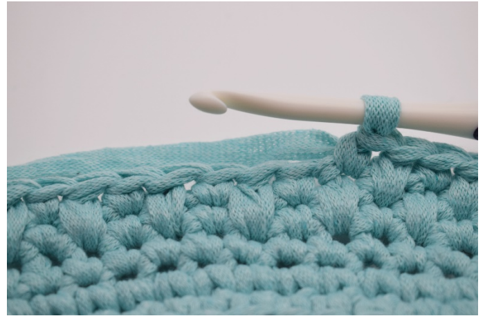
8. Nästa varv virkas växelvis * 1 djfm, 1 fm *