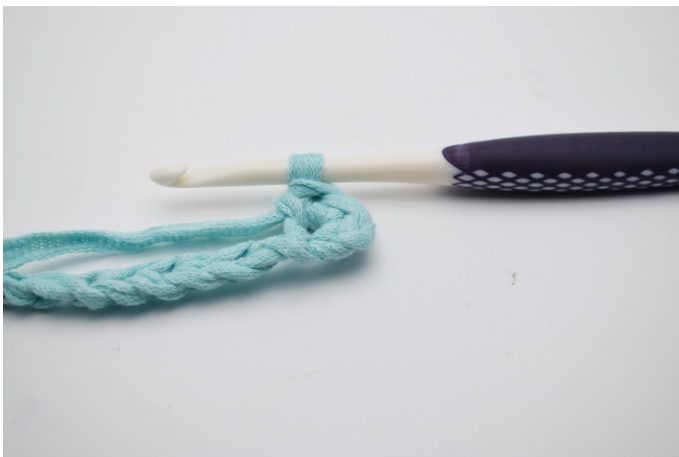
3. Virka 2 fm.