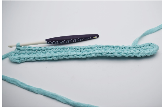
6. Nu fortsätter du på motsatta sidan med 1 fm i följande 24 lm.