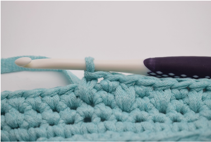
7. Upprepa växelvis 1 fm , 1 djfm varvet ut.