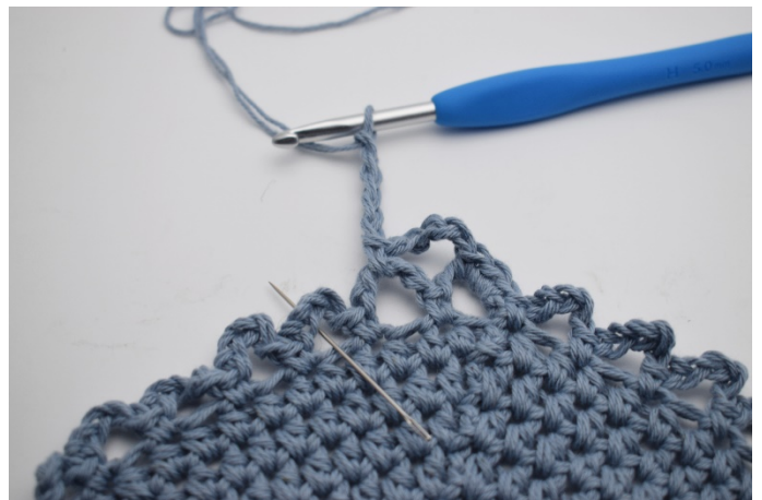
11. I nästa lm- båge. (Nålen markerar)