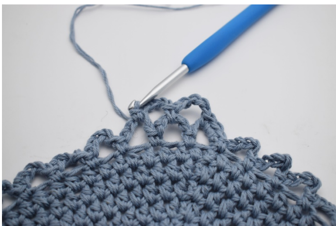
12. Virka 1 fm.