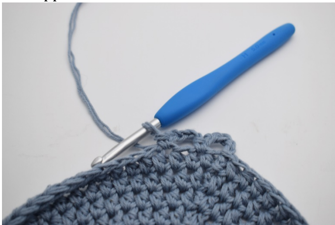
Hoppa över 1 m och virka 1 fm.