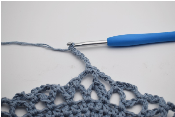
13. Virka 5 lm.