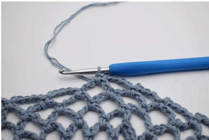
15. Det 4:e varvet avslutas här