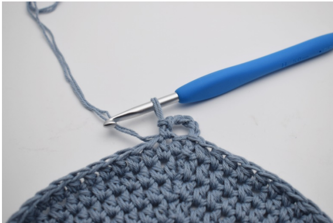
3. Hoppa över 1 m och virka 1 fm.