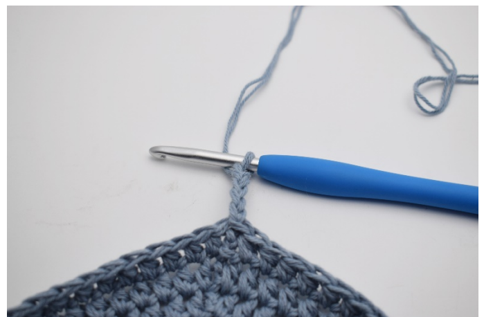
2. Gör 5 lm.