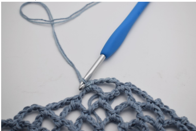
17. Virka 1 fm i nästa lm – båge. Så här upprepar du hela vägen. Glöm inte att BYTA garn så du får det ton i ton. ( se längre upp )