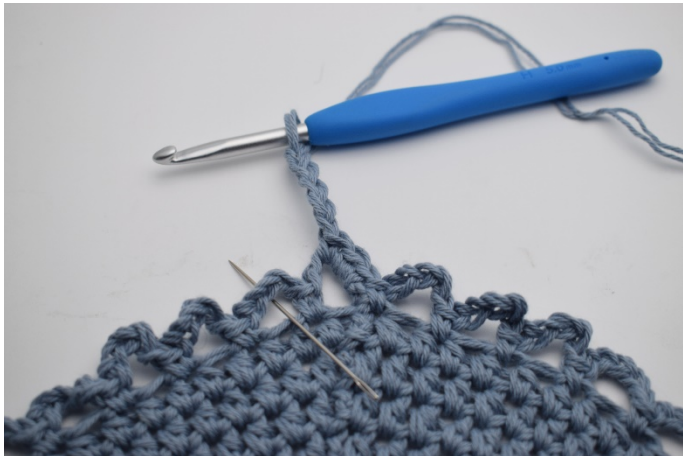
8. I nästa lm- båge. (Nålen markerar)