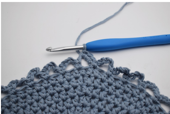
6. Virka 3 sm längs den 1:a lm – bågen, då startar du i mitten på bågen.