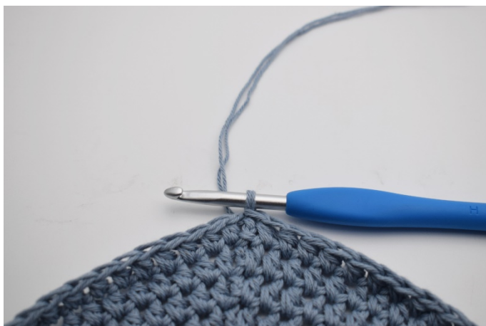
1. Här är botten avslutad med 1 sm.