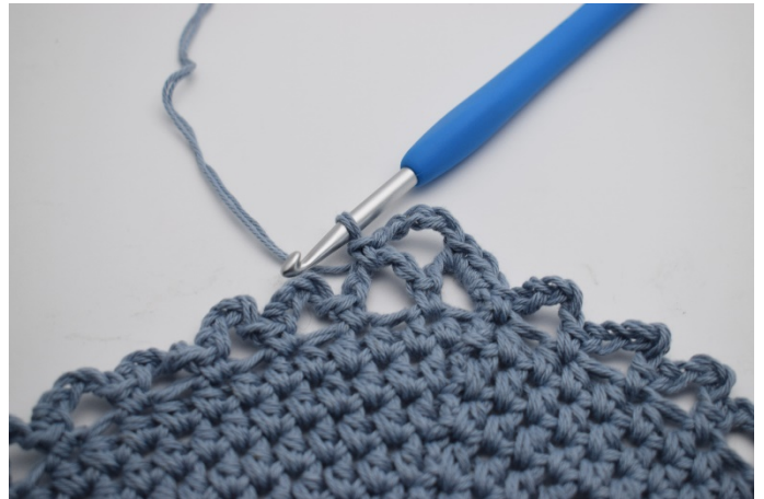
9. Virkas 1 fm.