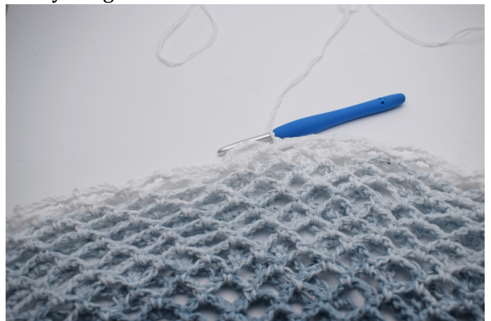
18. Så totalt 20 varv virkat och du avslutar med 2 nystan i färg 4.