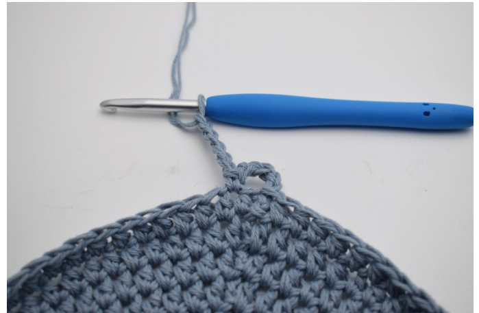
4. Gör 5 lm.