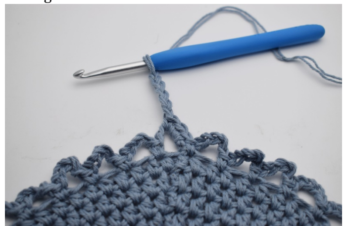
7. Virka 5 lm.