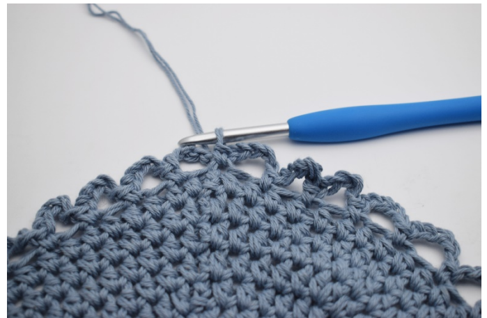
5. Upprepa så hela varvet ut, då har du 36 lm – bågar.