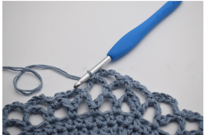
14. 1 fm i nästa lm – båge. Upprepa varvet ut, 4 varv med färg 1.