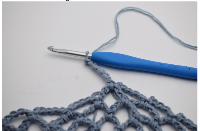
16. Byt färg så du virkar med 1 och 2. Gör 5 lm.