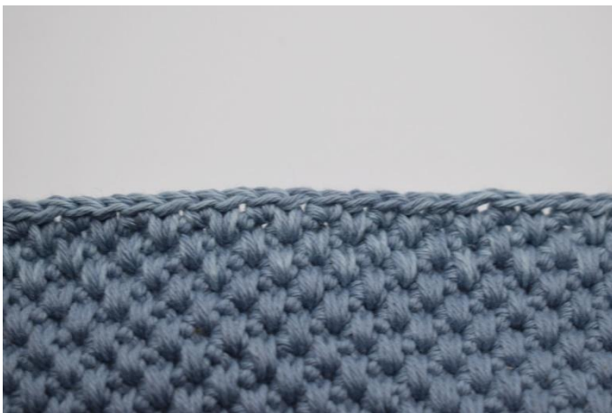
3. Virka 3 varv.