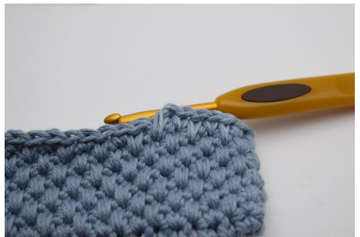
2. Byt ut den ena tråden mot färg nr 2, nu virkar du med färg nr 1 & 2.