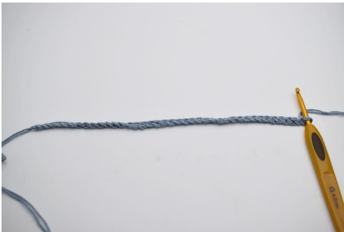
1. Börja med att slå upp dina lm.