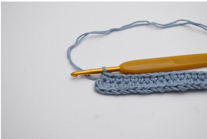
7. Virkas 1 fm. (79)