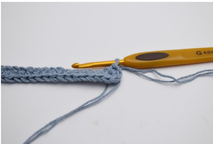
5. Virkas 4 fm. Nu virkas det på motsatta sidan av din lm rad.