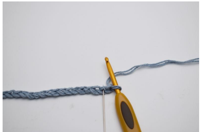
2. I 2. lm från virknålen (Nålen markerar den här)