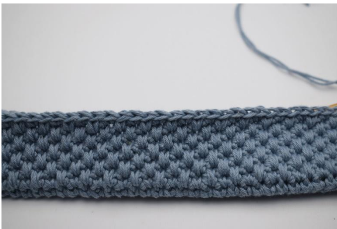
1. Det har virkats 7 varv med växelvis fm, och dfm med färg nr 1.

Byt ut den ena tråden så du bara har färg nr 4. Virka 4 varv. Avsluta med 1 varv fm.