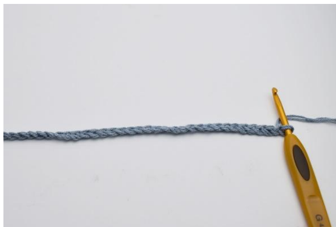
1. Börja med att lägga upp dina luftmaskor.