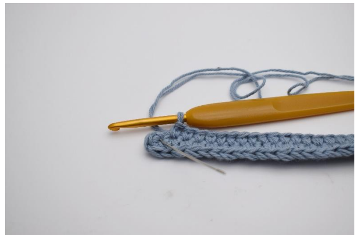
6. Virka 1 fm i de nästa 30 lm. I sista lm (Som nålen markerar här)