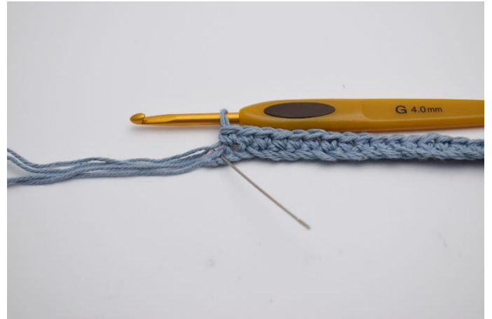
4. Virka nu 1 fm i de nästa 30 lm. I sista lm (Nålen markerar den här)