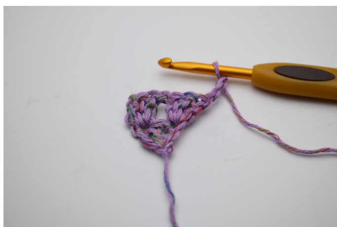
Vänd arbetet och gör 3 lm. (Ersätter 1 st.)