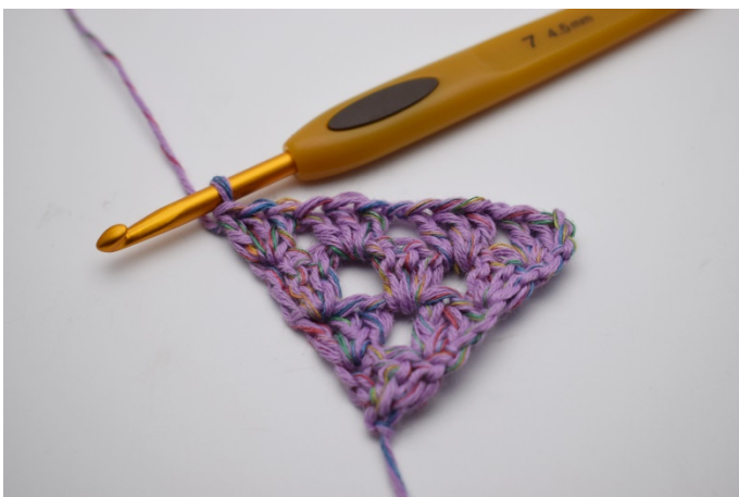
19. Virkas 1 stgr. Upprepa tills du har gjort 65 varv eller önskad storlek.