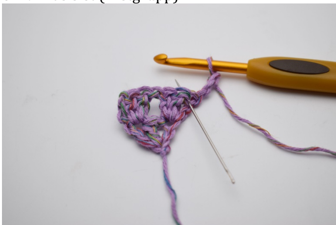
9. I första m (nålen markerar)