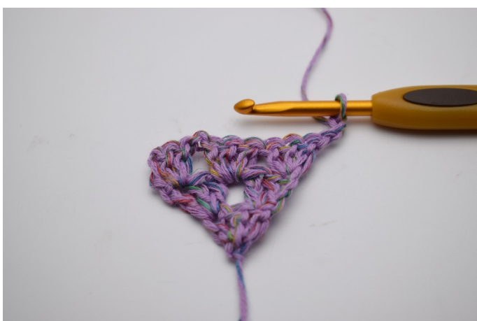
13. Vänd arbetet och gör 3 lm. (Ersätter 1 st.)