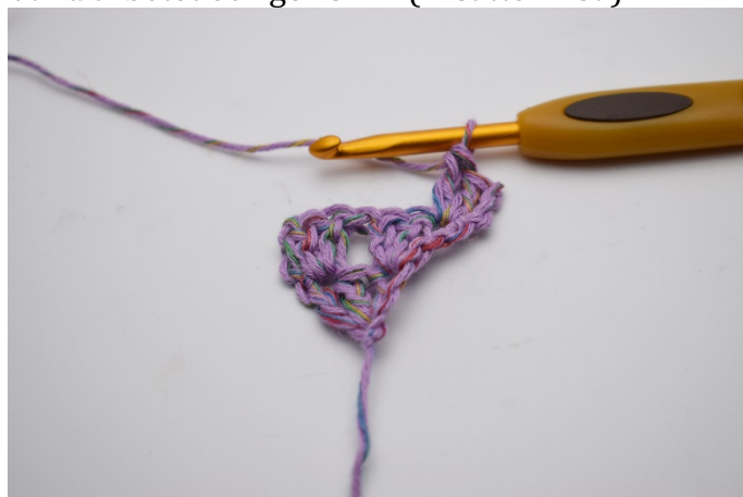
10. Virkas 2 st. Ytterliggare 1 stgr är gjord. ( De 3 lm ersätter den 1: st)