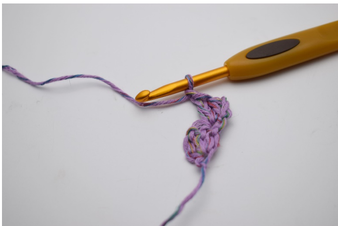
7. Gör 1 lm.