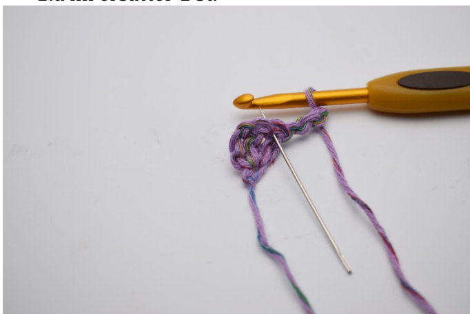
5. I första m (nålen markerar)