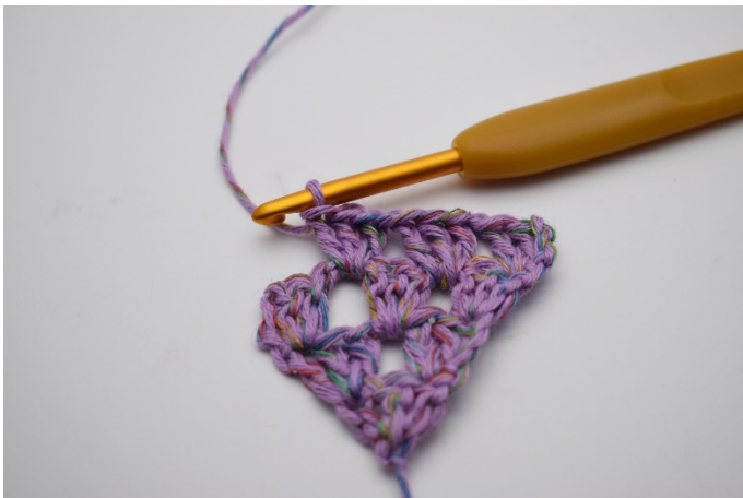
17. Inästa lm-mellanrum virkas 1 stgr.