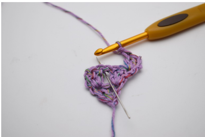
11. Gör 1 lm. I lm-mellanrummet från förra varvet (Nålen markerar mellanrummet)