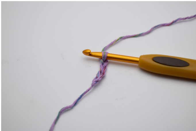
1. Lägg upp 4 lm.