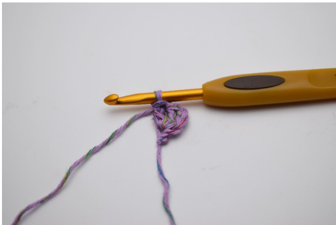
3. Virka 2 st. Du har nu gjort en stgr ( 3 st)den 1:a lm ersätter 1 st.