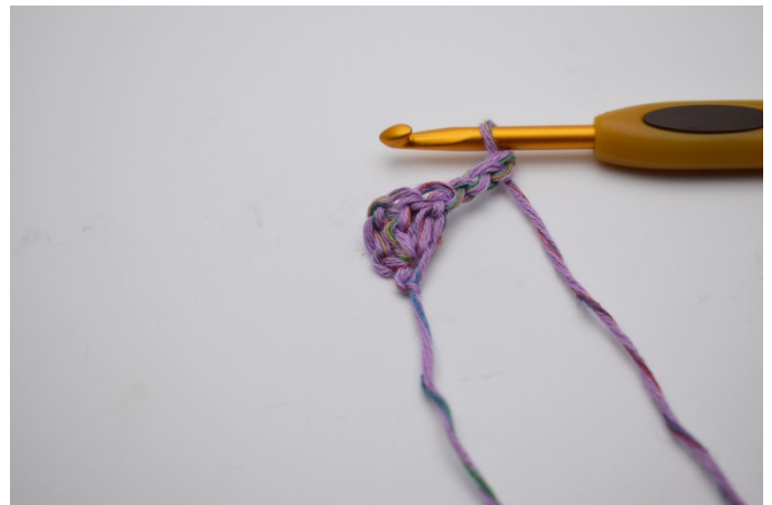
4. Vänd arbetet och gör 3 lm. (Ersätter 1 st.)