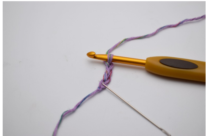
2. I sista lm från nålen ( nålen markerar)