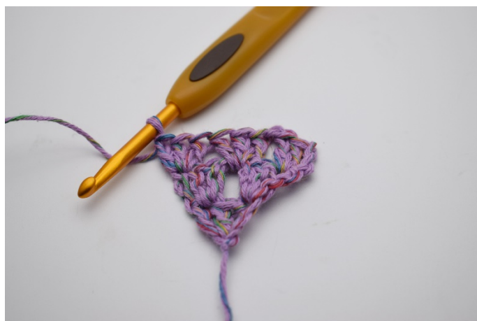
Virkas 1 stgrupp.