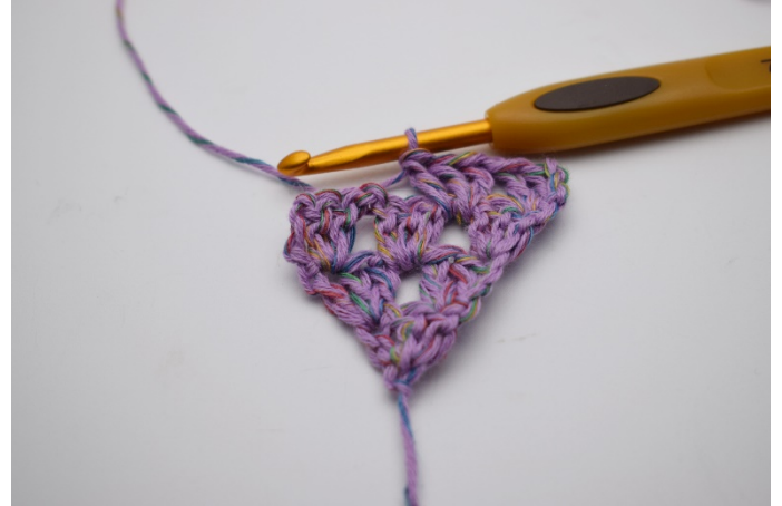
16. Gör 1 lm. I lm-mellanrummet från förra varvet virkas 1 stgr.