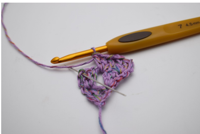
12. Gör 1 lm. I sista m som nålen markerar