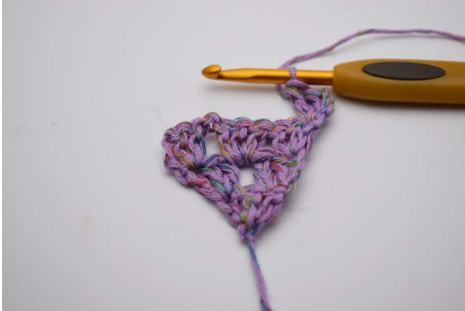
15. Virkas 2 st. Ytterliggare 1 stgr är gjord. ( De 3 lm ersätter den 1: st)