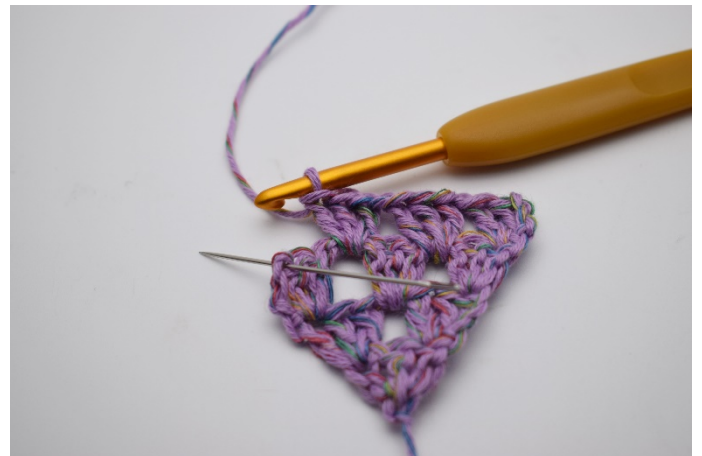
18. I sista m som nålen markerar..