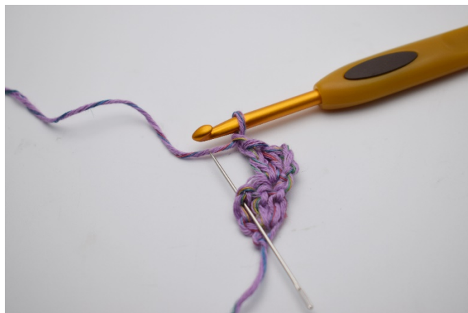
Hoppa över 1 m. I sista m, (nålen markerar )