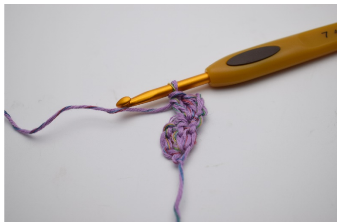
6. Virkas 2 st. Ytterliggare 1 stgr är gjord. ( De 3 lm ersätter den 1: st)