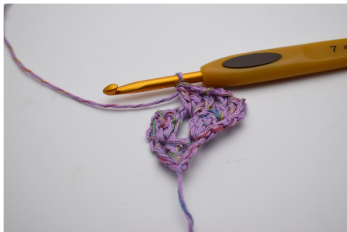
Virkas 1 stgrupp.