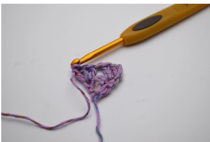
8. virkas 3 st ( 1 stgrupp)