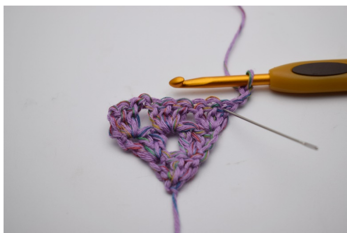
14. I 1:a m, som nålen markerar