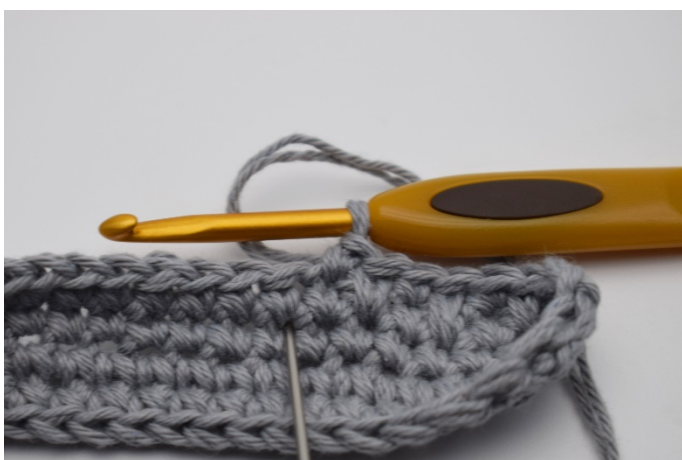
5. Nästa m virkar du 1 dfm. Som en vanlig fm men i maskan under.. (Nålen markerar var du ska göra dfm.)