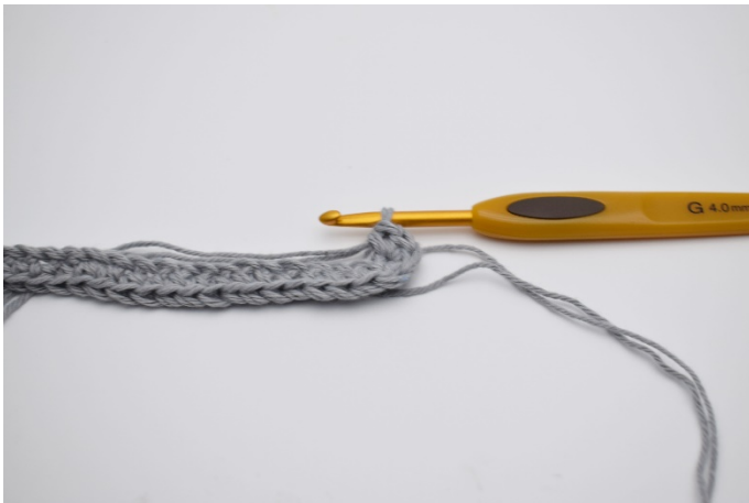
5. Virka 4 fm. Nu fortsätter du och virka på motsatta sidan av din lm kedja.