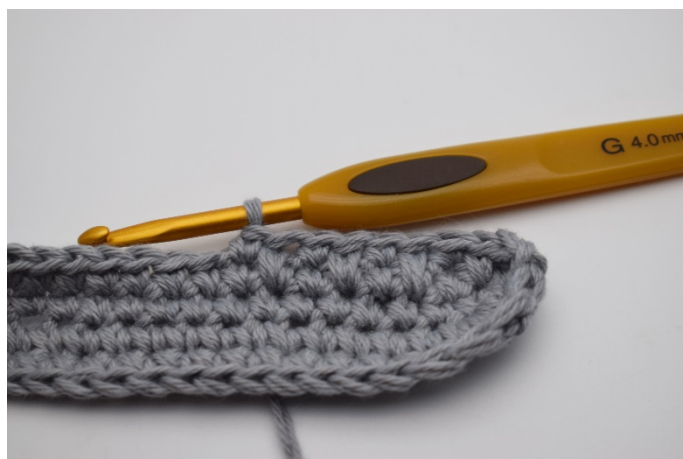
8. Fortsätt och virka likadant varvet ut och avsluta med en sm.