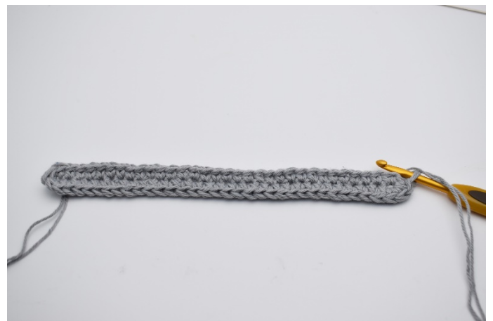
8. virka 2 lm. Avsluta med 1 sm.. (68)