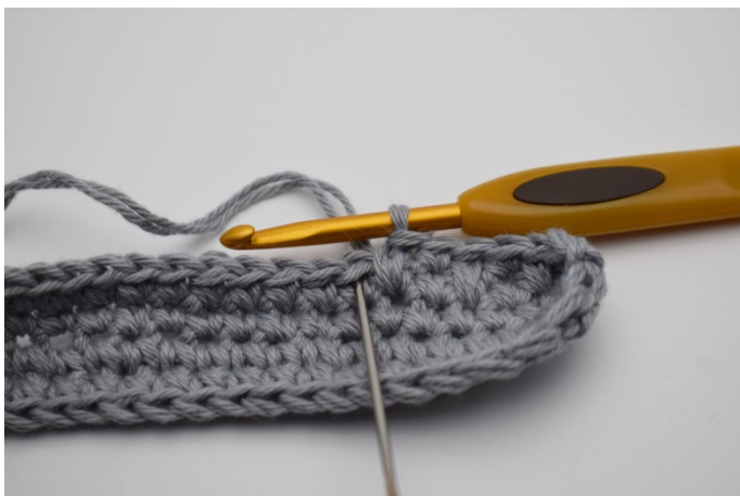
3. Virka 1 fm i nästa m