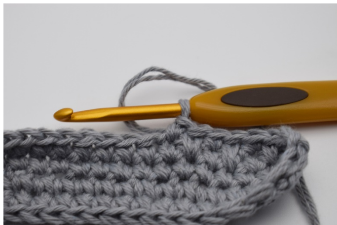
4. Så ser det ut.