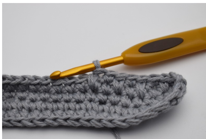
6. Så ser det ut.