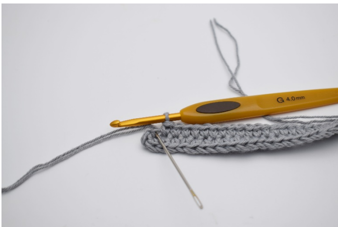
7. I den sidsta lm (Nålen markerar den här)