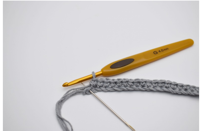
4. Virka 1 fm i följande 30 lm, I sista lm, (Nålen markerar den här)