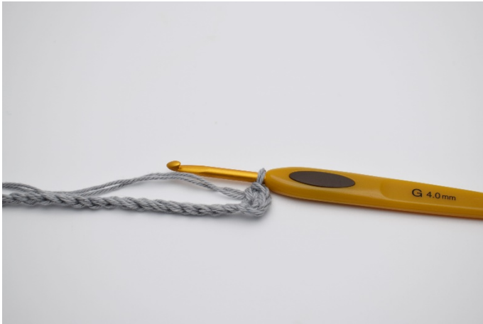
3. Virka 2 fm.