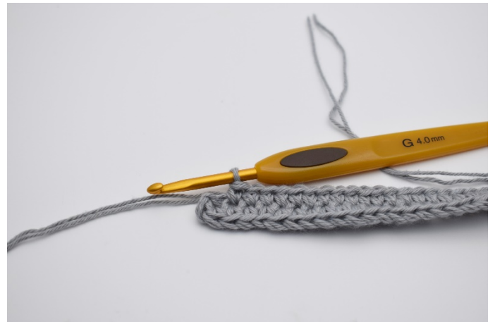
6. Virka 1 fm i följande 30 lm.