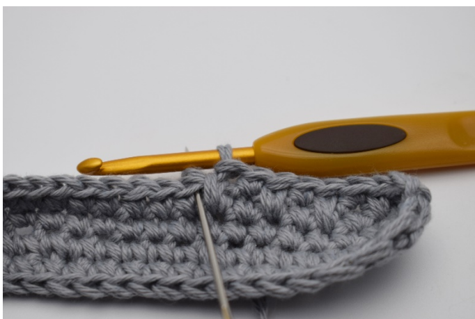
7. Virka 1 fm.