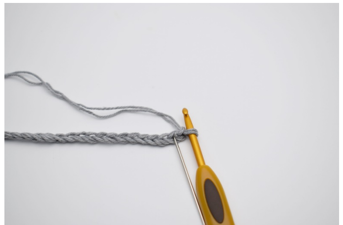
2. I 2:a lm från nålen (Nålen markerar den )