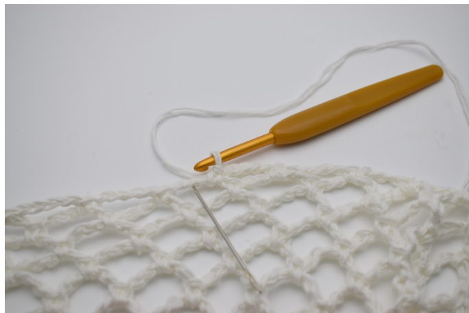
1. I varje lm- båge virkas 4 fm.