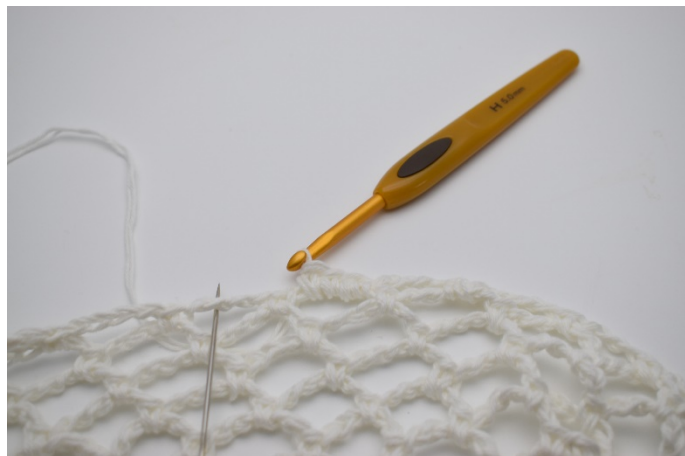
2. Fortsätt med 4 fm i VARJE lm – båge varvet ut.