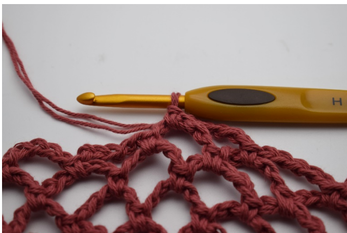
17. Efter 5 omgångar med mörk gammelrosa avslutar du.