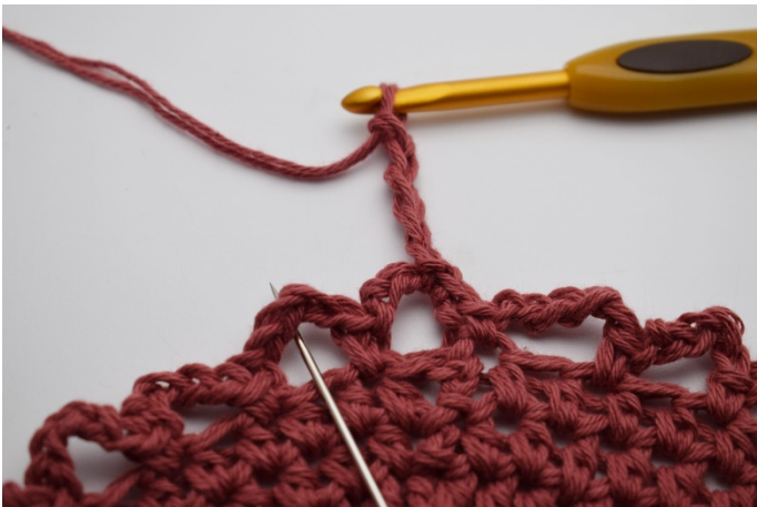
9. I nästa lm- båge. (Nålen markerar.)