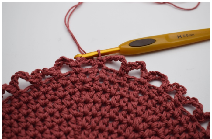
6. Fortsätt virka så varvet ut. Totalt har du 36 lm bågar om din botten.