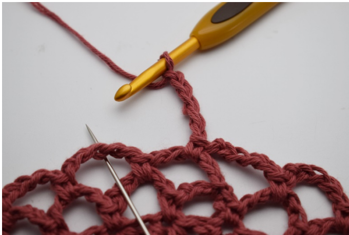
15. Virka 5 lm.