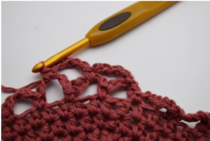
13. Virka 1 fm.