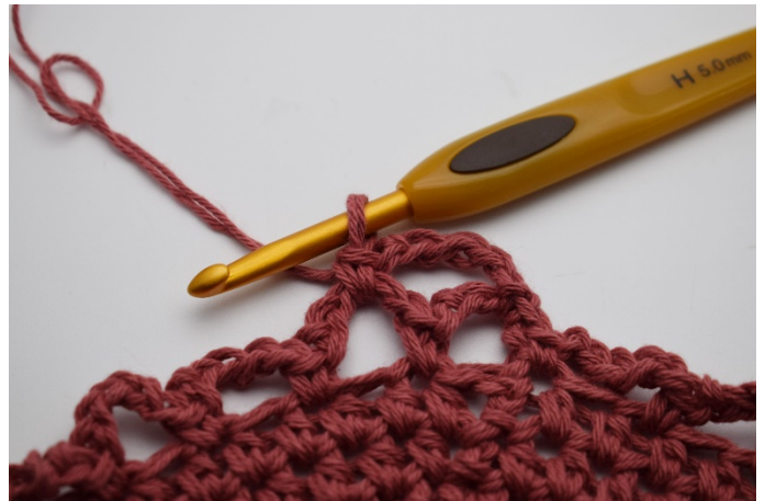
10. Virka 1 fm.