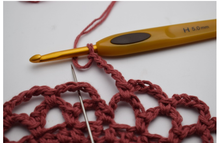
14. Upprepa varvet ut och avsluta med 1 fm i den 1:a lm bågen. ( där nålen pekar )