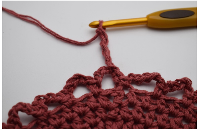
8. Virka 5 lm.