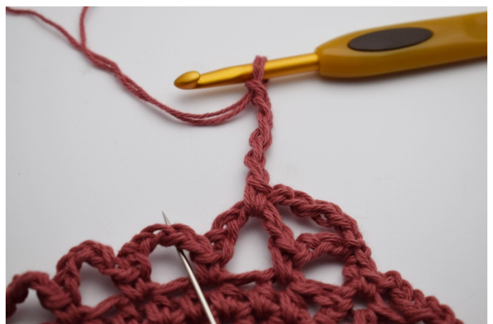
12. I nästa lm - båge. (Nålen markerar)