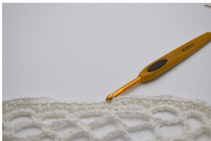
4. Virka 1 lm, därefter fm i varje m och avsluta med 1 sm.