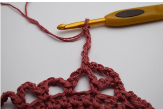
11. Virka 5 lm.