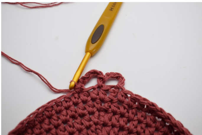
5. Hoppa över 1 m och virka 1 fm i nästa m.