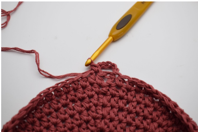
3. Hoppa över 1 m och virka 1 fm i nästa m.