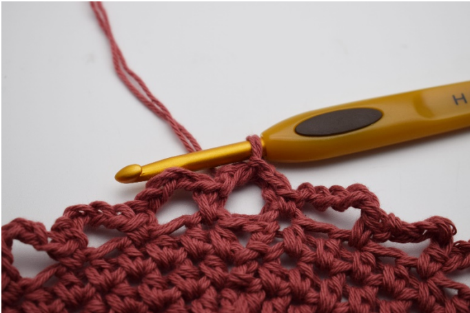
7. Virka 3 sm på den första lm- bågen så du startar i mitten.