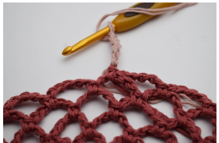
17. Byt till ljus gammelrosa och virka 5 lm med den ljusa.