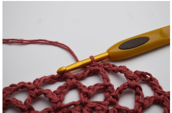
16. Virka 1 fm i nästa lm-båge. Detta upprepas till du har 5 varv med den mörka gammelrosa.