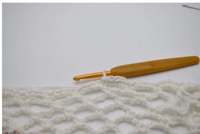
3. Avsluta med 1 sm. Du har nu 144 fm på detta varvet.