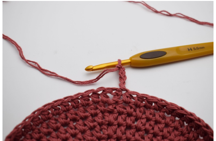
2. Virka 5 lm.