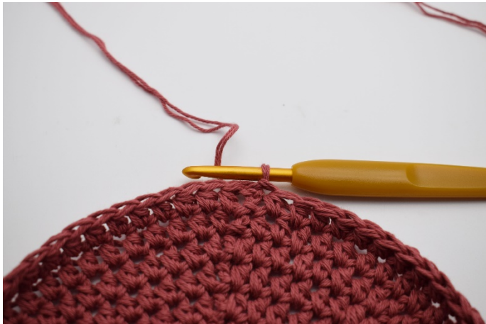
1. Här är botten. Avsluta med en sm.