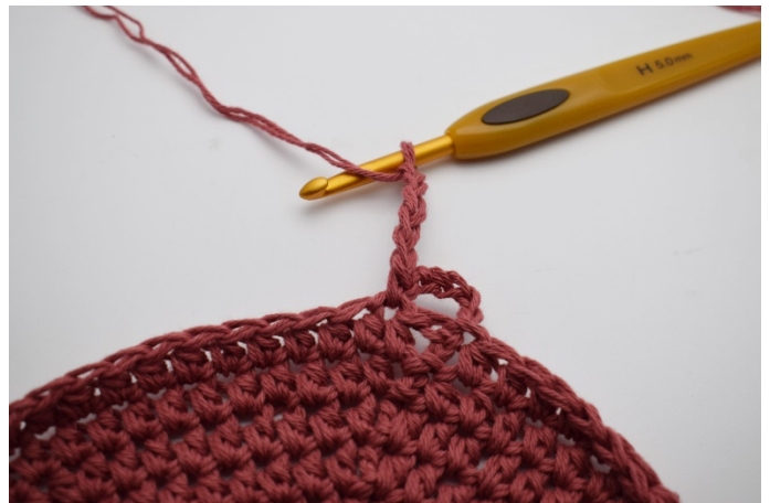
4. Virka 5 lm.