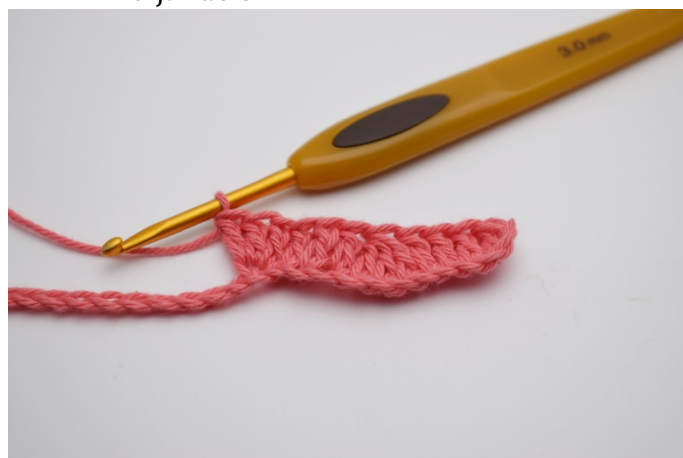
6. Virka 3 m i TILLSAMMANS i nästa lm.