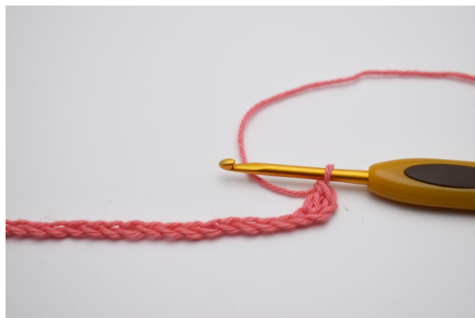
2. Den första stolpen virkas i 3 lm från nålen.