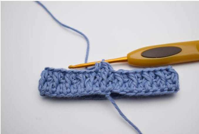
9. I nästa maska virkas en vanlig hst.