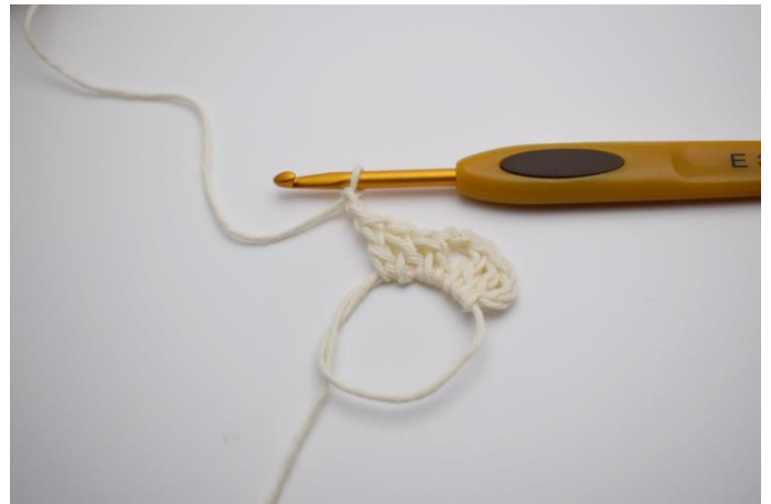
2. Virka 3 st, 2 lm.