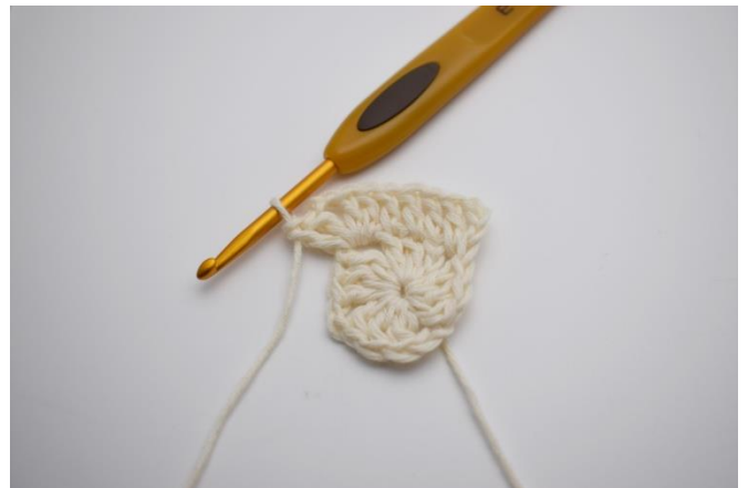
8. Virka 2 st, 2 lm, 2 st om lm bågen.