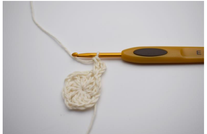
6. Virka 3 lm (ersätter 1:a st) Virka 1 st om lm bågen.