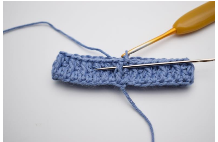
8. Virka 1 lm, och virka 1 r hst fr runt hst i föregående varv. Nålen på bilden visar hur man virkar ned hst framifrån runt hst i föregående varv.