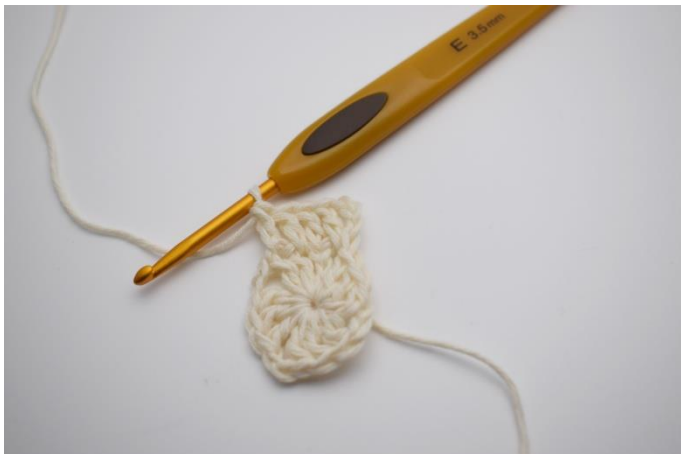
7. Virka st i alla maskor fram till nästa lm hörn.