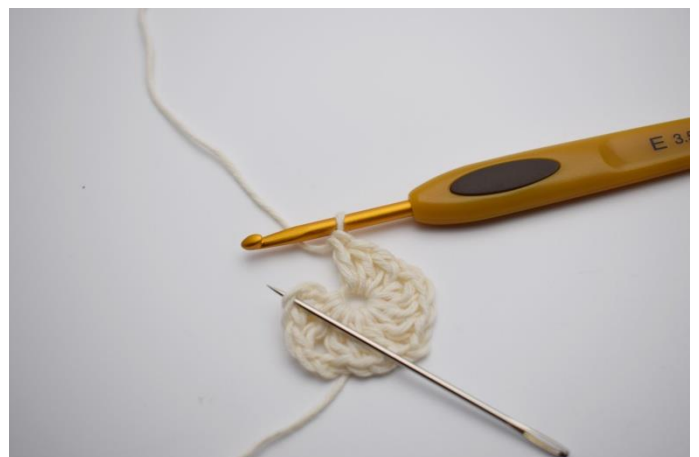
4. Virka 3 st och 1 hst i 3:e lm.