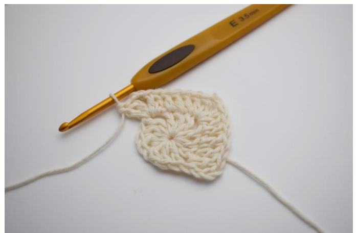
10. Virka 2 st, 2 lm, 2 st om lm bågen.