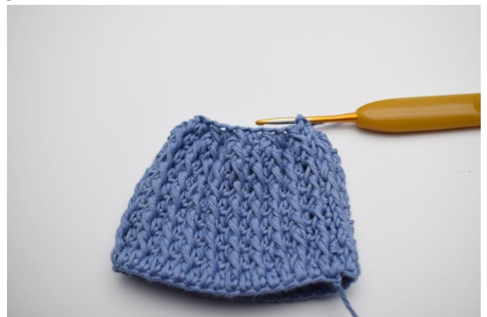
12. Virka 1 lm, " 2 m ihop som rst fr". Upprepa "-" varvet ut. Avsluta med 1 sm.