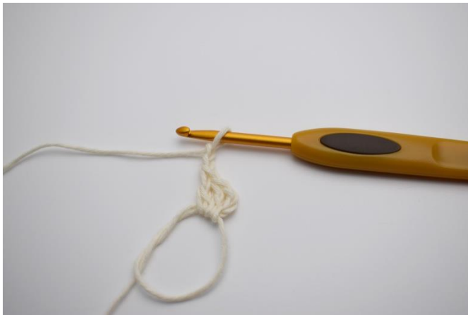
1. Börja med färg 1 och virka en Mr. Virka 3 lm (ersätter 1:a st) Virka 2 st och 2 lm.