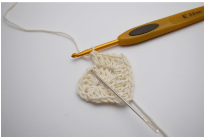
9. Virka nu st i alla maskor fram till nästa lm hörn.