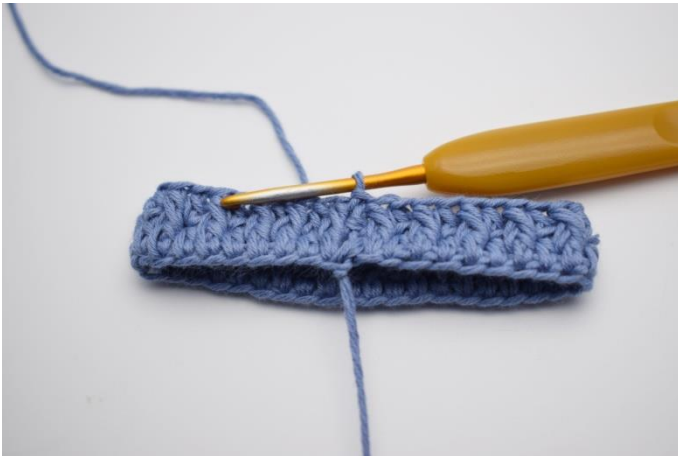
7. Upprepa växelvis varvet ut och avsluta med 1 sm.