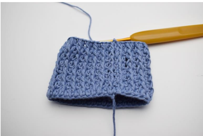
11. Upprepa tills du har totalt 8 varv.