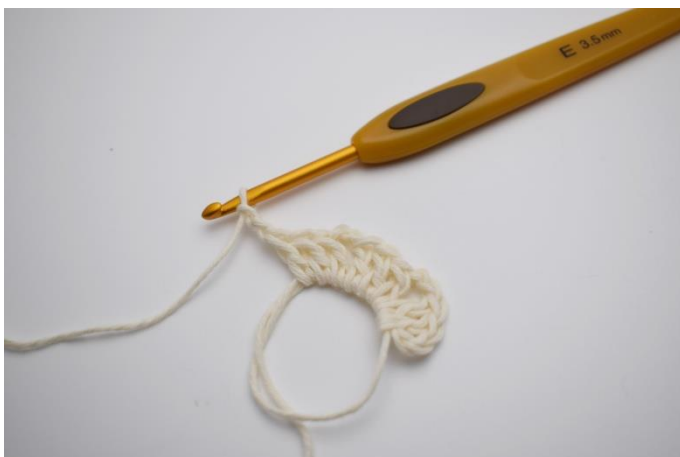
3. Upprepa och virka 3 st, 2 lm.