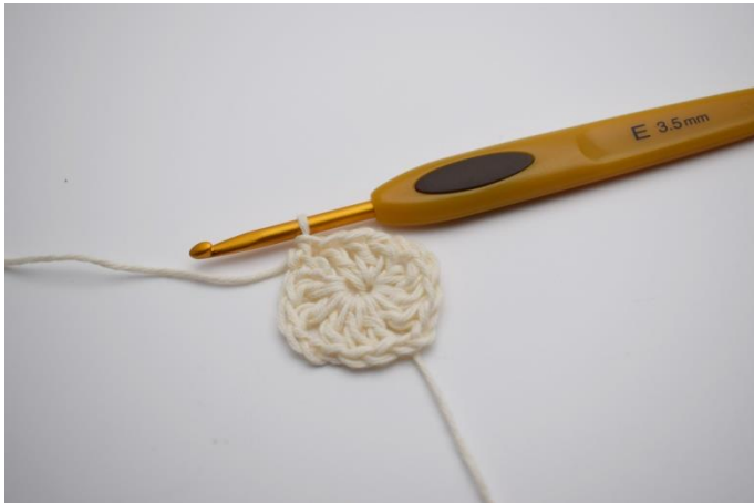
5. 1:a varvet är nu färdigt.