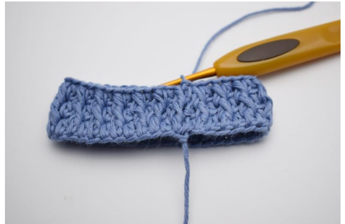
10. Upprepa växelvis varvet ut och avsluta med 1 sm.